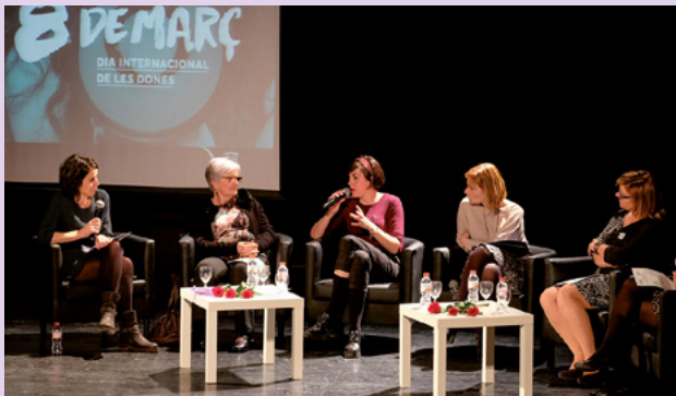
Acte central de la programació del 8 de març, Dia internacional de les dones, d'homenatge a les dones vinculades professionalment a la Salut Mental