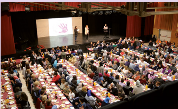
Dinar intercultural organitzat per l'Associació de dones El Farah i per l'Ajuntament amb la col·laboració del Consell municipal de les dones