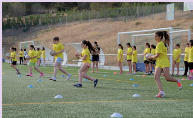
5a Trobada de Sant Boi boig per l'esport femení en la qual van participar diversos clubs esportius de la ciutat