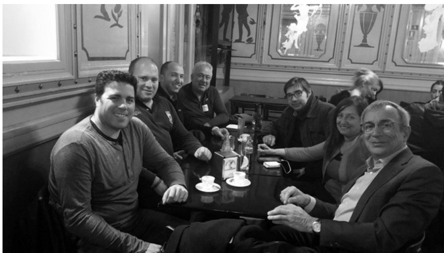
Equip actual de Zero Macho a Catalunya

S'identifiquen amb la feina que es realitza des de col·lectius com el Moviment Democràtic de Dones de Catalunya o la Xarxa de ciutats lliures de tràfic de dones, nenes i nens destinats a la prostitució.