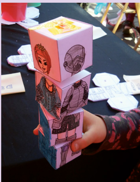
Activitat vinculada al projecte Contes per la coeducació en el marc de la Diada de Sant Jordi