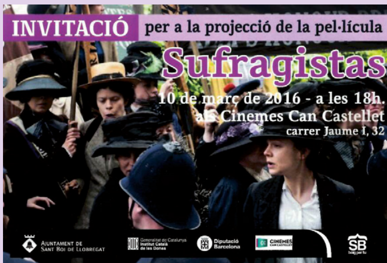
Als cinemes Can Castellet es va projectar la pel·lícula "Sufragistas" que tracta sobre la lluita pels drets polítics de les dones