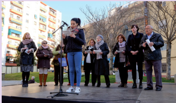
Ofrena floral al monument de la Dona treballadora de ciutat cooperativa