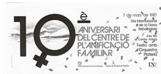
Commemoració del 10è aniversari