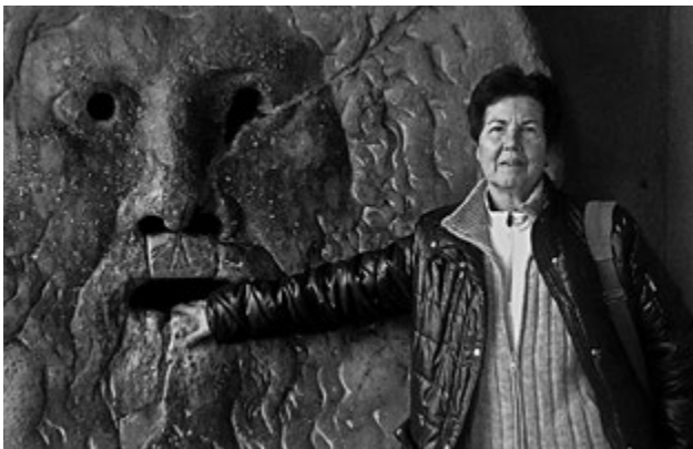
Judith Astelarra , sociòloga i pensadora feminista reflexiona en aquest escrit sobre el tema

Els anys 70 del segle XX el moviment feminista era molt viu. Tot estava per fer: igualtat en les lleis, divorci, avortament, drets sexuals.... Amb l'arribada de la democràcia a les institucions la dècada dels 80 moltes de les dones que lluitaven en associacions i grups feministes van entrar a formar part de les institucions. Assoleixen càrrecs i aquestes institucions es fan seves moltes de les reivindicacions del moviment. Aquest fet de la institucionalització del feminisme ha debilitat el moviment o l'ha diversificat? Ara vivim en una societat complexa amb mirades diferents, però encara no s'ha aconseguit eradicar els valors del patriarcat. Per tant el rol de les institucions es necessari i caldrà definir quines polítiques requereix el nou context social.