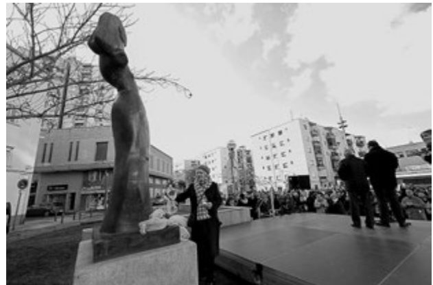
La presidenta Carmen Espí en l'ofrena floral al monument de la Dona treballadora de ciutat cooperativa amb motiu de la commemoració del 8 de març de 2016

Actualment des de l'Associació, es porta a terme el programa "T'escoltem dona", des del qual s'ofereix informació i orientació especialitzada en funció de cada cas, ja sigui de caire psicològic o jurídic.