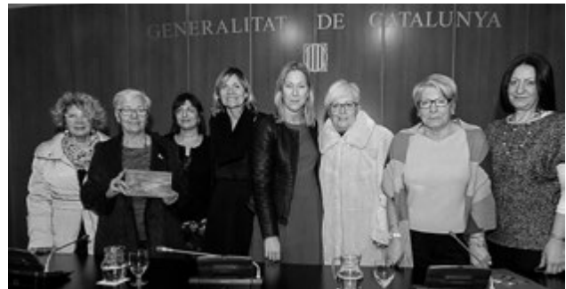
L'any 2014 l'Associació de Dones de Sant Boi va fer 25 anys. Per aquest motiu el Govern de la Generalitat li va retre un homenatge i el reconeixement públic per 25 anys de trajectòria en favor de l'equitat de gènere. En aquesta fotografia podem veure, entre d'altres, la consellera Neus Munté, l'alcaldessa Lluïsa Moret i la presidenta Carmen Espí, la segona per l'esquerra, amb la placa commemorativa

A més a més s'organitzen al llarg de l'any al voltant de 15 activitats lúdiques , formatives i terapèutiques així com tallers de memòria i salut, d'autoestima i d'equilibri emocional .