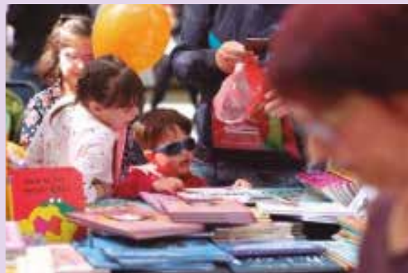
El projecte contes per a la coeducació en el marc de la Diada de Sant Jordi 2017.