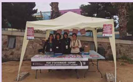
Festa Major 2017: Punt d'informació i suport vinculat al protocol d'actuació davant les agressions sexistes a les festes.