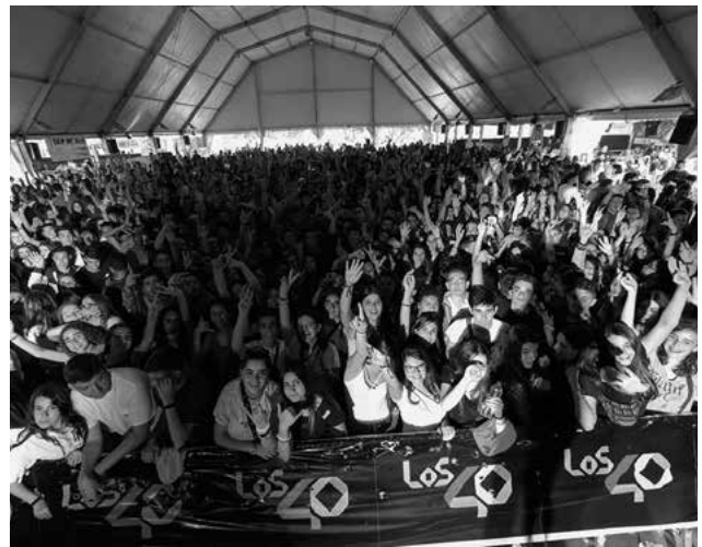
Concert Los 40 on tour. Festa Major Sant Boi 2017

El mes de maig de 2017 la ciutat de Sant Boi va posar en marxa per primera vegada el Protocol d'actuació davant les agressions sexistes a les festes majors i altres esdeveniments de la ciutat vinculats a l'oci. Durant les quatre nits de la Festa Major de Sant Boi 2017-del 18 al 21 de maig-l'Ajuntament va instal·lar dos punts d'informació i suport en els que un equip de professionals expertes en violències masclistes i LGTBIfòbies van oferir informació de caire preventiu i van atendre de manera individual i confidencial a totes aquelles persones que havien viscut una agressió. Alhora es va crear un sistema de coordinació entre el personal tècnic responsable dels esdeveniments, les entitats participants i les responsables dels punts d'informació i suport per tal de generar respostes col·lectives i adequades davant de qualsevol agressió masclista en l'espai de concerts.