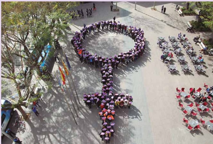
Acte institucional amb les treballadores i treballadors de l'Ajuntament en el marc de la programació del 8 de març de 2017.

A continuació presenten 7 fotografies representatives dels actes que van tenir lloc a Sant Boi al voltant del mes de març