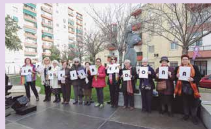
Actuació del grup de poesia de gent gran en motiu de l'Ofrena floral al monument de la Dona treballadora del 8 de març.