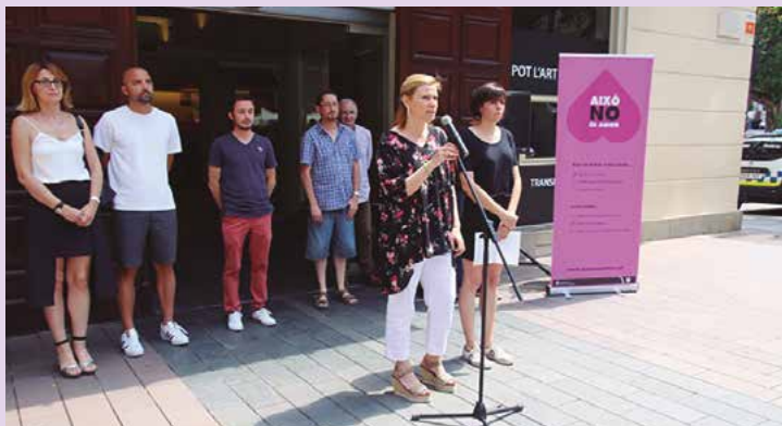
Mobilització el #19J: Alerta feminista en contra de les violències masclistes i com a protesta pels pocs recursos per a la igualtat dels pressupostos generals de l'Estat 2017.