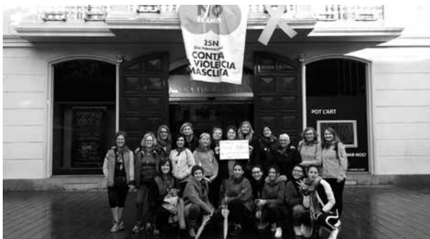
Sortida de la Plaça de la Vila de les participants a la Marxa Contra la Violència Masclista 2016

El passat mes de setembre el Congrés dels Diputats va aprovar el Pacte d'Estat en matèria de Violència de Gènere , sense unanimitat de tots el grups polítics ja que Podemos es va abstenir per considerar-lo insuficient. Una qüestió a destacar d'aquest document és la definició de violència de gènere que s'amplia no només a la que es produeix per la parella o exparella sinó que inclou altres tipus de violència contra les dones que recull el Conveni d'Istanbul com és el cas de la lluita contra el tràfic d'éssers humans amb finalitat d'exploració sexual.