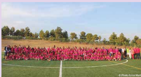
6a Trobada de Sant Boi boig per l'esport femení en la qual van participar diversos clubs esportius de la ciutat