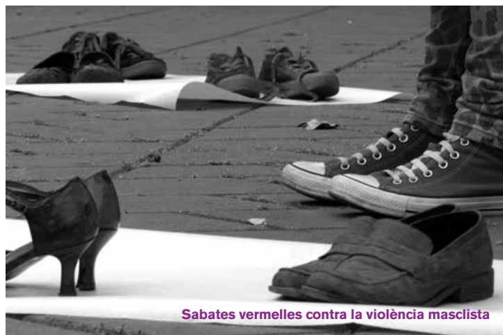
Sabates vermelles contra la violència masclista

Perquè viuen en una cultura que els diu que a les dones bones no els passa res. De fet, el maltractador repeteix missatges com: això és perquè ets una mala mare o una mala dona. Missatges que critiquen l'actitud de la dona per justificar la