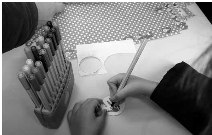
Tallers de txapes per conscienciar contra la violència masclista

El masclisme és cultura i la cultura és coneixement, que són totes aquestes idees, referències, costums que ens hem donat històricament per establir la convivència dins la societat, i la masclista