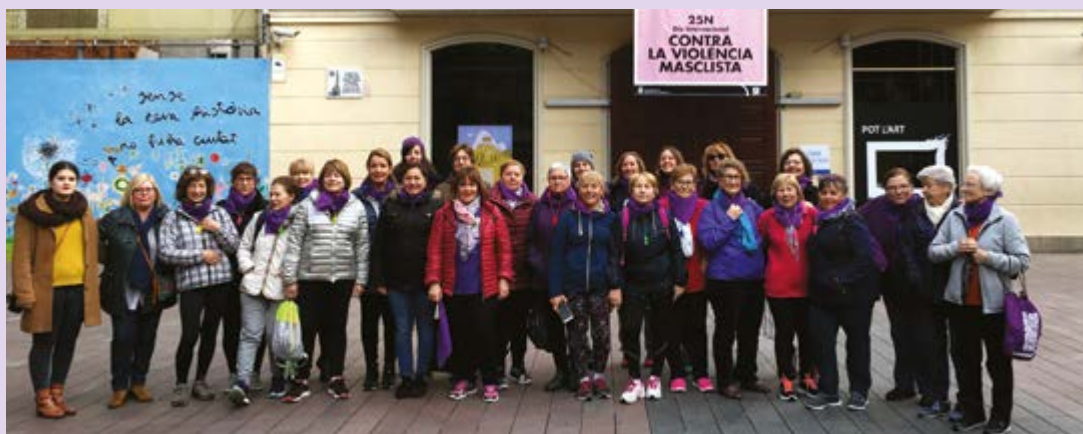
25 de novembre. VI Marxa del Baix Llobregat contra la violència masclista, organitzada pel Consell Comarcal amb els ajuntaments de la comarca. Sortida de Sant Boi fins el Parc Torrelblanca de Sant Feliu de Llobregat