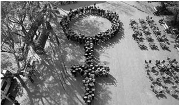
Sant Boi s'ha declarat Municipi Feminista

Les desigualtats de gènere estan presents en les relacions entre els homes i les dones en tots els àmbits de la vida social, econòmica, política i personal, això, comporta desigualtats i discriminacions per raó de gènere que poden afectar tant a homes com a dones, però que en general fa que les dones en siguin les principals perjudicades. Les administracions locals tenen un rol central en la promoció i implementació de les polítiques d'igualtat de gènere . Per la seva proximitat amb la ciutadania, el seu paper és primordial per promoure societats més igualitàries i respectuoses. Sant Boi de Llobregat, declarada ciutat feminista l'any 2018, sempre ha estat una ciutat referent en la lluita per a la igualtat entre dones i homes.