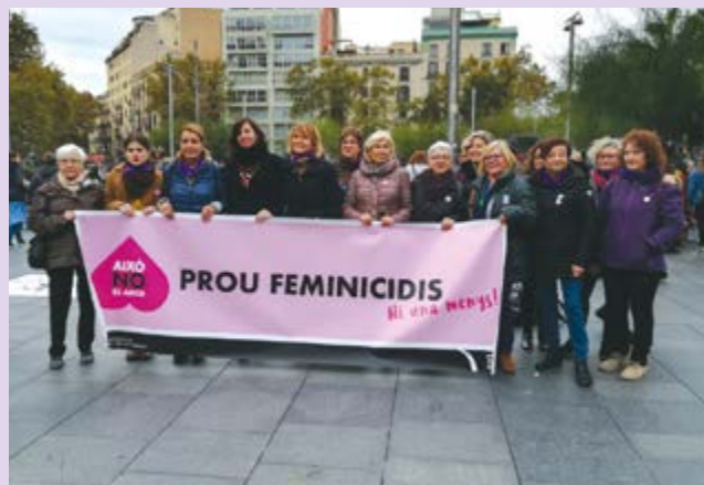
25 de novembre. 'Alcem la veu contra la violència masclista', comitiva santboiana a la manifestació unitària de Barcelona.