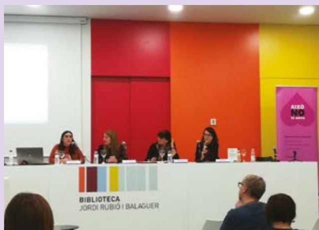
22 de novembre. Jornada tècnica 'Violències a l'espai públic', a la Biblioteca Jordi Rubió i Balaguer durant tot el matí.