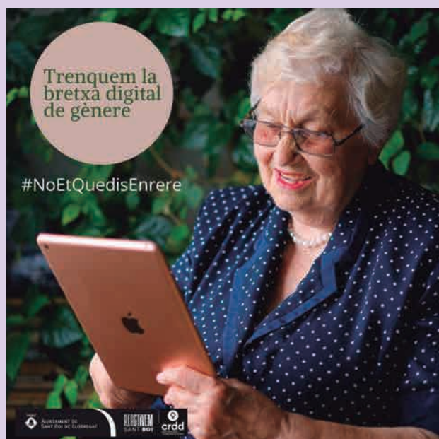
Campanya No et quedis enrere , per conscienciar sobre la bretxa digital de gènere i fomentar la igualtat d'oportunitats.