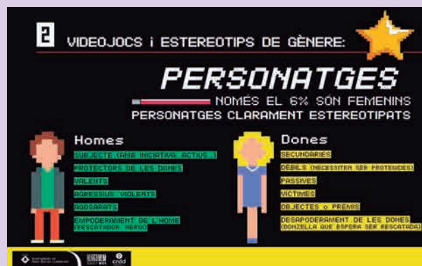
Campanya Videojocs lliures de sexisme , per visibilitzar la discriminació de les dones en el món dels videojocs i conscienciar sobre l'impacte dels valors agressius i sexistes de molts dels videojocs en la infància i l'adolescència.