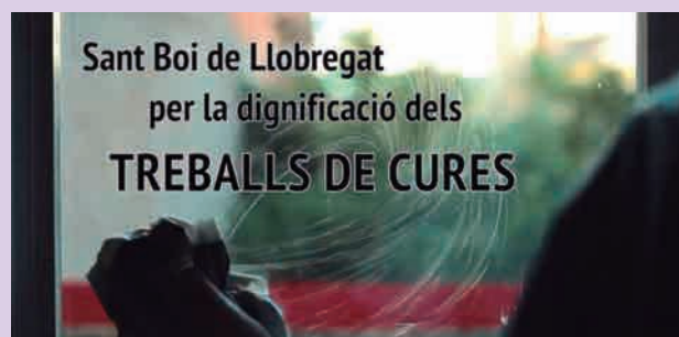
Campanya Visibilitzem la cura , per la visibilització i reconeixement dels treballs de cura remunerats i no remunerats.