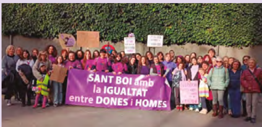
▲ Comitativa santboiana a la manifestació unitària de Barcelona del 8 de març

Aquí us deixem un recull d'alguns actes i activitats que s'han portat a terme aquest 2024: