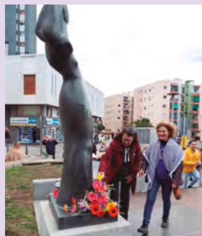
▲ Ofrena floral al monument de la Dona Treballadora en el marc de la commemoració del 8 de març