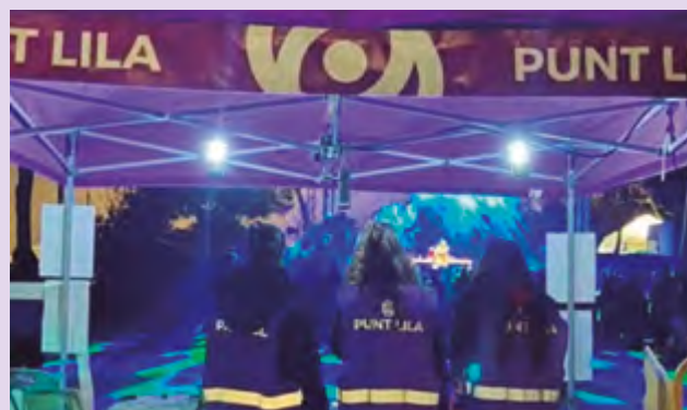
▲ Punt Lila contra les violències masclistes i lgtbifòbies a la Festa Major i al Festival Altaveu.