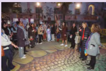
▲ Trobada intercultural en el marc de la celebració del 8 de març