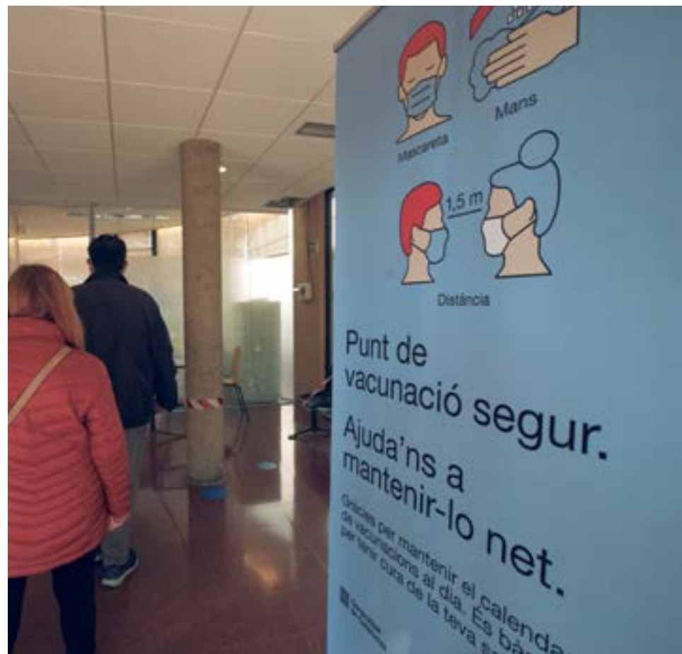
El Casal de Marianao ha estat un dels espais municipals habilitats per a la campanya de la grip

Així mateix, l'Ajuntament també està donant suport a la lluita contra la Covid-19 amb la realització de proves amb test PCR. Concretament, en el punt sanitari situat a l'Olivera, on es realitzen els tests a persones assintomàtiques que han pogut estar en contacte amb persones infectades.