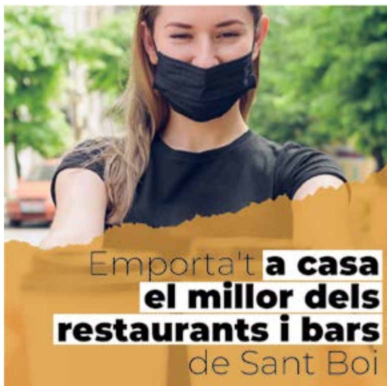
La campaña #TakeAwaySantBoi anuncia los establecimientos de Sant Boi con servicio de recogida en el local y/o entrega a domicilio

La economía de Sant Boi no se resigna a la situación generada por la COVID-19. Los bares y restaurantes de la ciudad, los pequeños comercios y empresas de servicios y las paradas de los mercados están haciendo un gran esfuerzo para, en la medida de sus posibilidades, mantener sus negocios a flote, adaptarse al nuevo contexto y continuar ofreciendo el mejor servicio a la clientela, siempre garantizando el cumplimiento de las medidas preventivas y de seguridad.