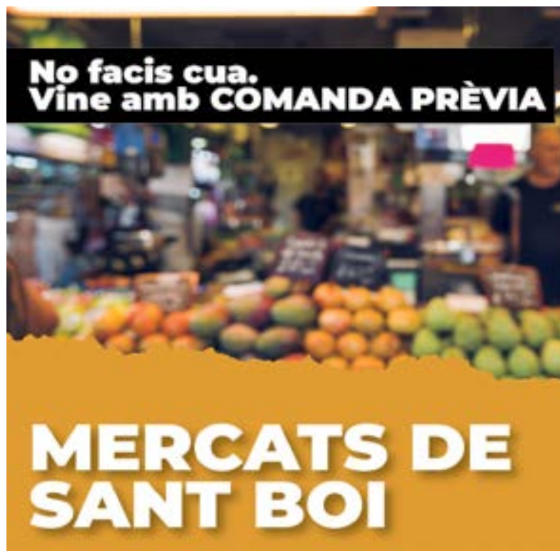
Los mercados municipales recomiendan encargar previamente la compra para evitar colas. Están abiertos tres tardes a la semana

Comercios locales, bares, restaurantes y paradistas de los mercados han participado en acciones formativas para proteger mejor a su personal y a su clientela