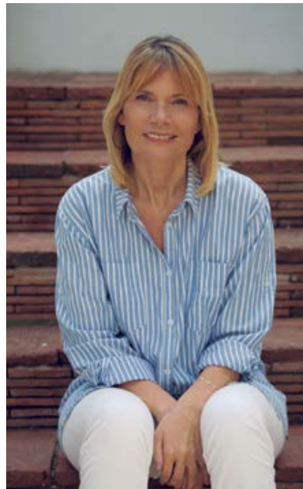
Lluïsa Moret i Sabidó, alcaldessa