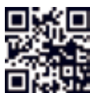
Vídeo del Fòrum empresarial

Tres empreses de Sant Boi van explicar al Fòrum empresarial com han aplicat una mirada innovadora als seus negocis