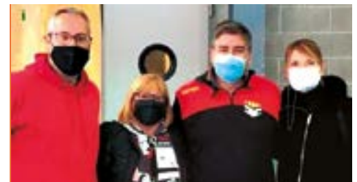
Club de Handbol Ciutat Cooperativa