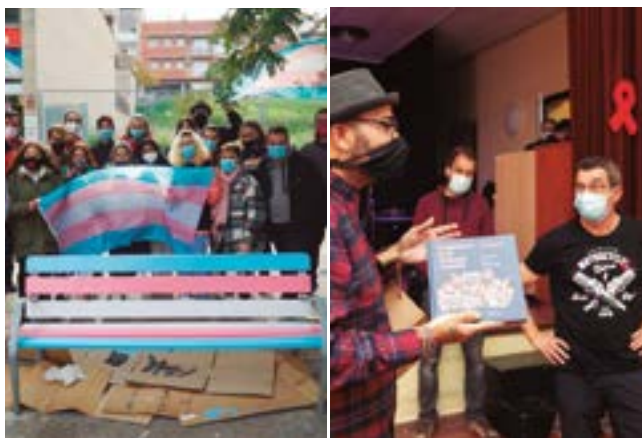
Sant Boi en Positiu