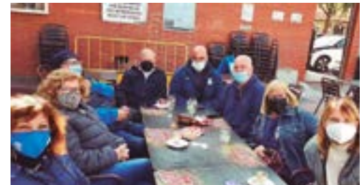
Club de Futbol Vinyets i Molí Vell