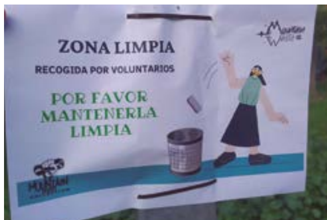
Mountain Waste Colection