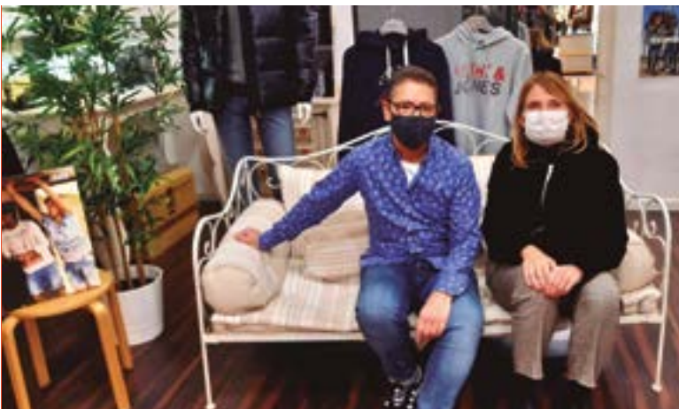
Velo Vestir (carrer de Francesc Macià, 28)