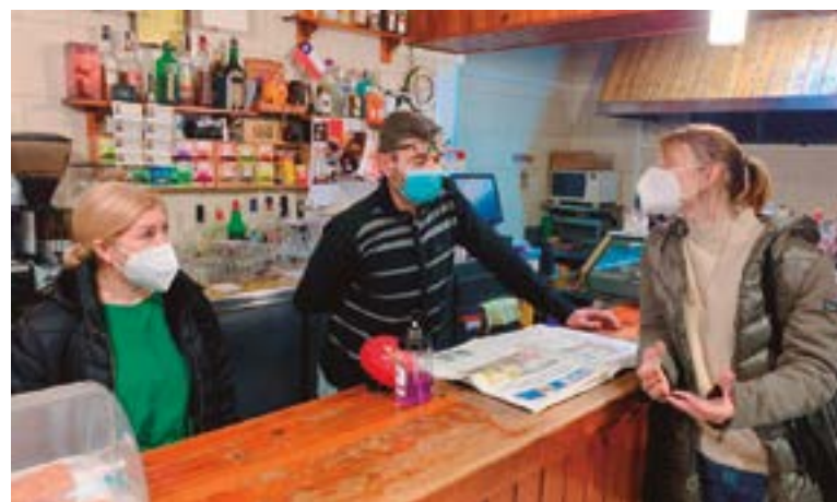
Frankfurt La Campana (plaça Joan XXIII, 7)