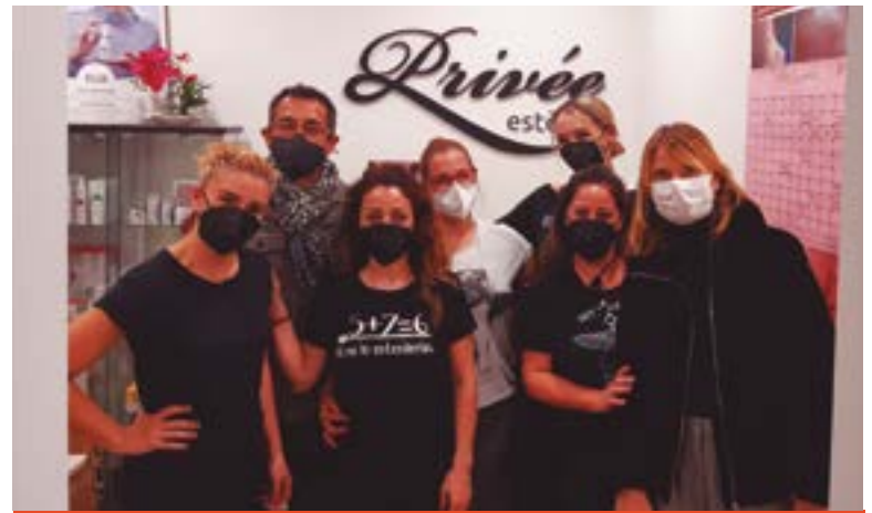
Privée Perruqueria (carrer Pintor Marià Fortuny, 53)