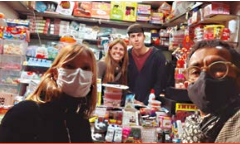
Quiosc Plaça Catalunya (plaça de Catalunya, 3)