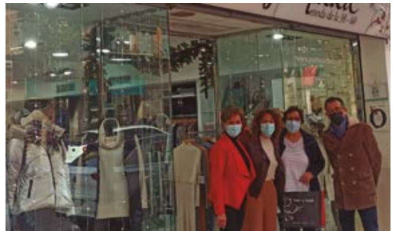
Punto y Aparte Moda (carrer Francesc Macià, 46)