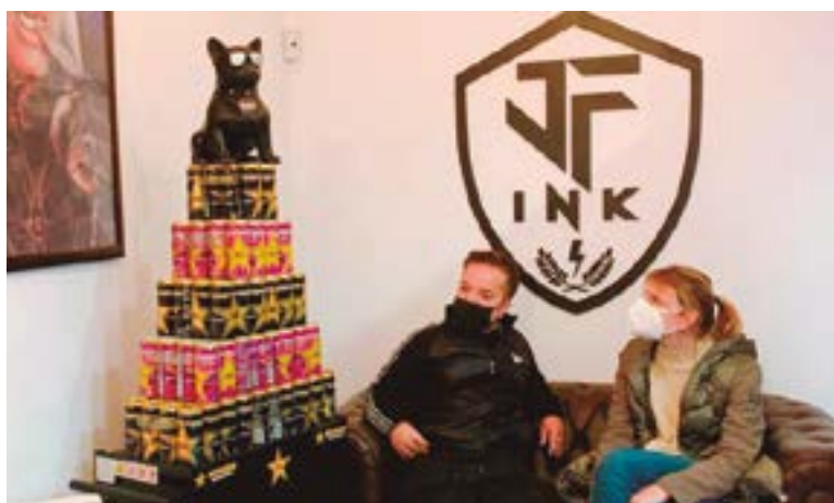
Veneno en la Piel Tattoo Studio (carrer Joventut, 26)