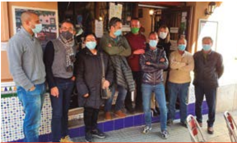
Restaurant La Trocha (carrer Jaume Balmes, 67)