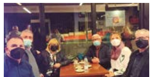
Club de Futbol Marianao Poblet