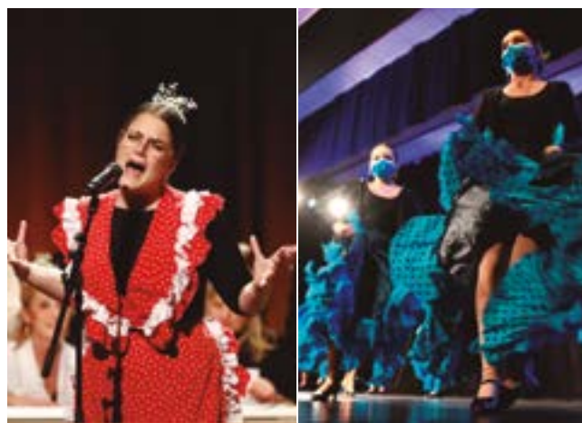
Casa de Sevilla i Casa de Granada