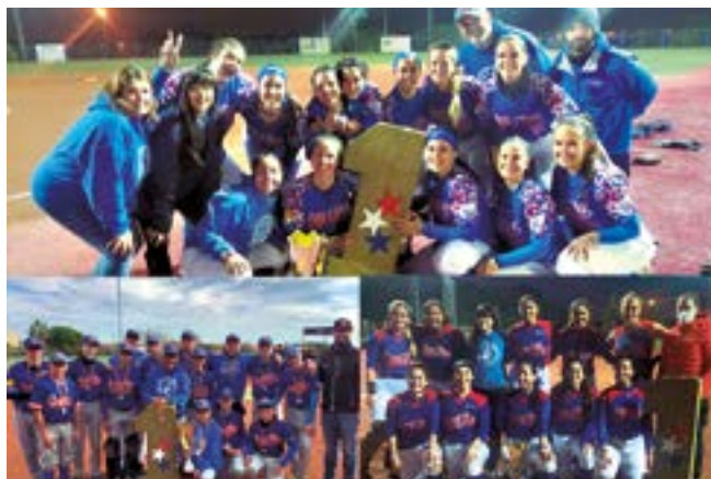
C Beisbol i Softbol Sant Boi

A les dates de l'any en què ens trobem la vida de la ciutat s'ha anat recuperant. Amb tota la prudència ja que cal atendre en tot moment la situació sanitària, les entitats i les associacions santboianes continuen aportant el seu esforç, treball i vitalitat a la vida social i cultural de la ciutat. Així, segueixen demostrant que són unes entitats vives que contribueixen de manera determinant a la reactivació emocional de la ciutat.