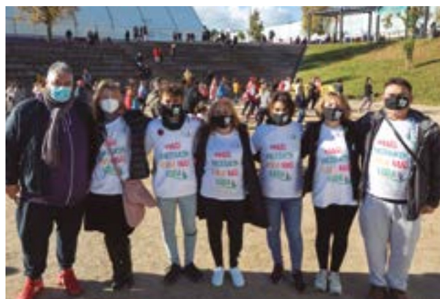
Ass. Dones Càncer Metastàtic