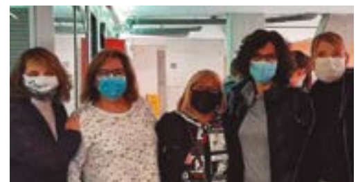
Club Voleibol Sant Boi