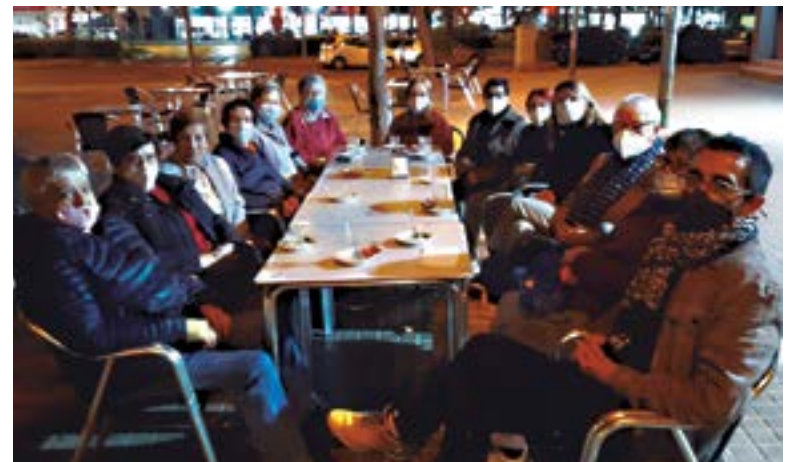
Reunió amb un grup de veïnes del barri de Vinyets i Molí Vell

i dona suport al teixit comercial i de restauració de proximitat als barris. Les visites que s'hi fan serveixen per conversar sobre la situació actual, parlar de nous projectes i escoltar els punts de vista del sector.