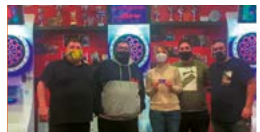
Club Dardos Goyos