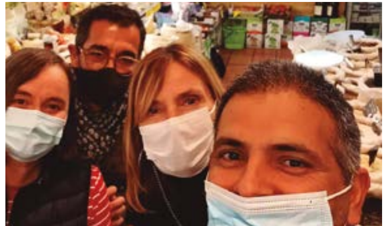
Tot a Granel (carrer Lluís Pasqual Roca, 11)