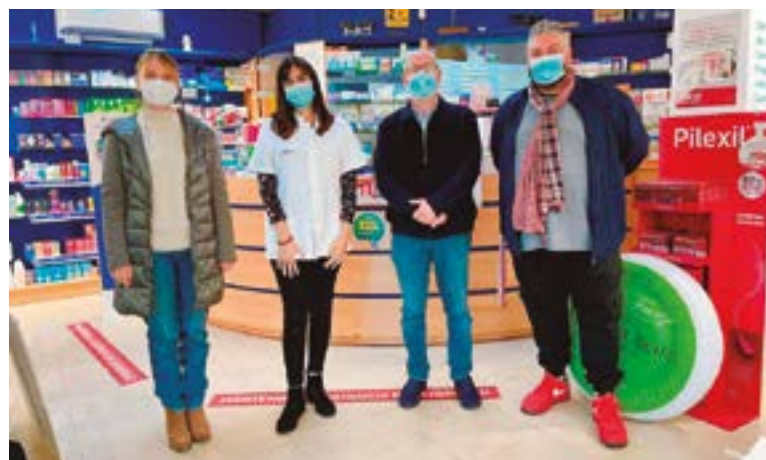
Farmàcia Ayala Pauner-Farmabaix (plaça del Penedès, 2)