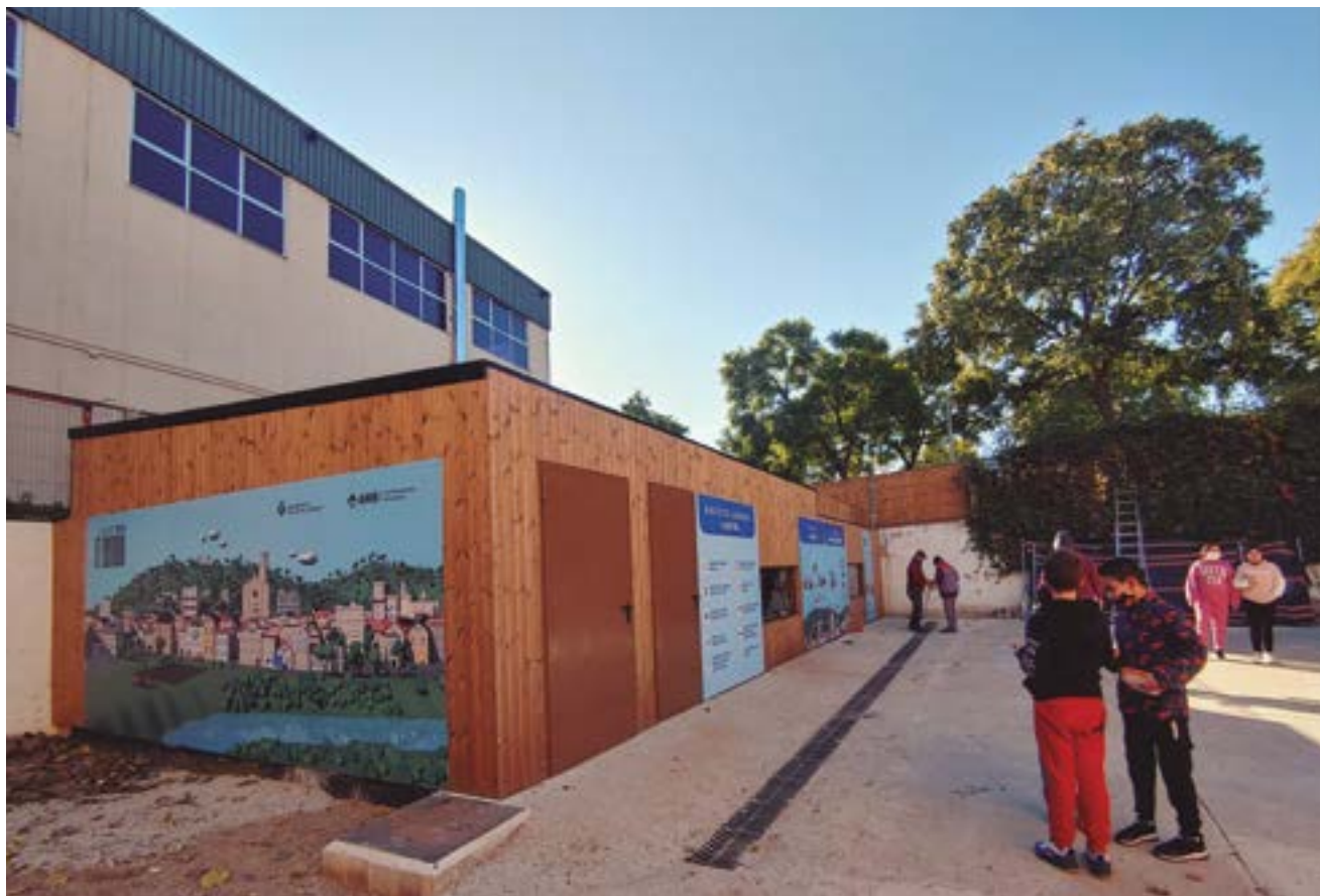
Una caldera de biomassa situada al pati de l'escola alimenta també el poliesportiu i els vestidors del camp de futbol