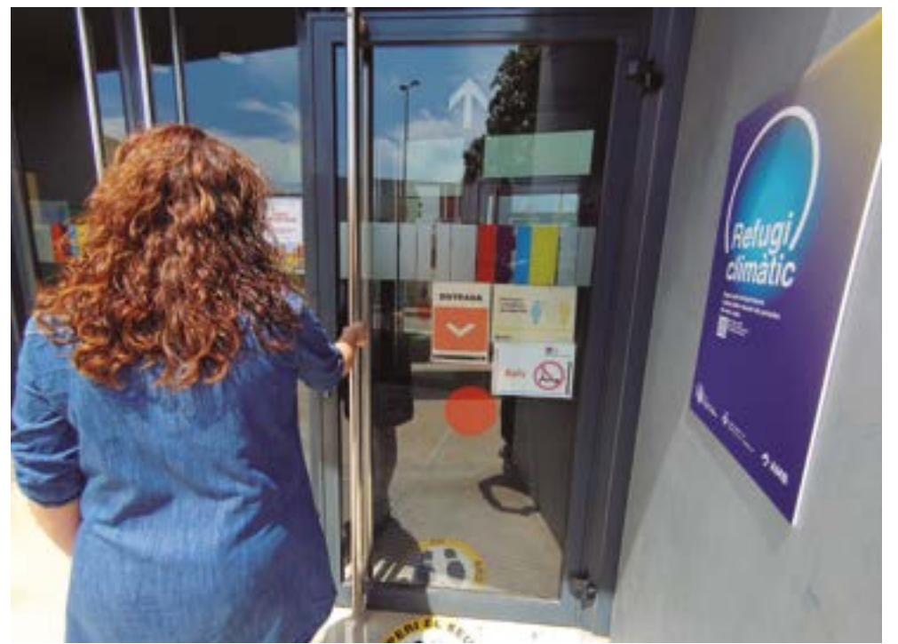
Un cartell identifica la Biblioteca Jordi Rubió i Balaguer com a refugi climàtic

Els refugis climàtics són llocs accessibles per a tota la ciutadania, exteriors o interiors, que poden proporcionar confort tèrmic, descans i protecció a les persones durant els dies i les hores de més calor (en especial, a les més vulnerables -menors de 5 anys i majors de 65-).