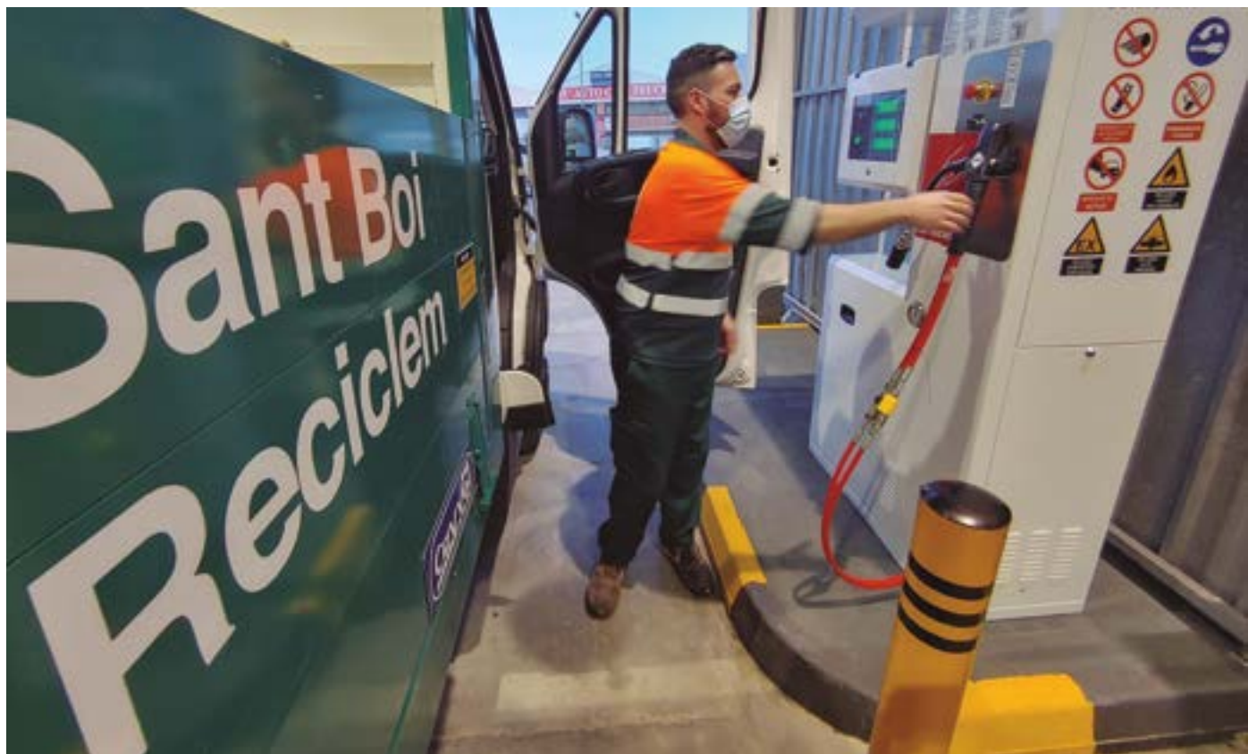
En aquest punt se subministra gas natural comprimit (GNC), el combustible més sostenible per als vehicles pesants

aparcaments municipals de Baldiri Aleu, el Mercat de Sant Jordi, la plaça del Mercat Vell i la plaça de Montserrat Roig ja compten també amb punts de recàrrega lenta per a concessionaris i persones abonades. L'Ajuntament posarà en marxa nous punts a mida que creixi el nombre de vehicles elèctrics i híbrids endollables en circulació al municipi. Sant Boi aposta per l'ús energies alternatives, per la reducció de l'emissió de gas d'efecte hivernacle a l'atmosfera i per un nou model de mobilitat menys contaminant, descarbonitzat i més sostenible.