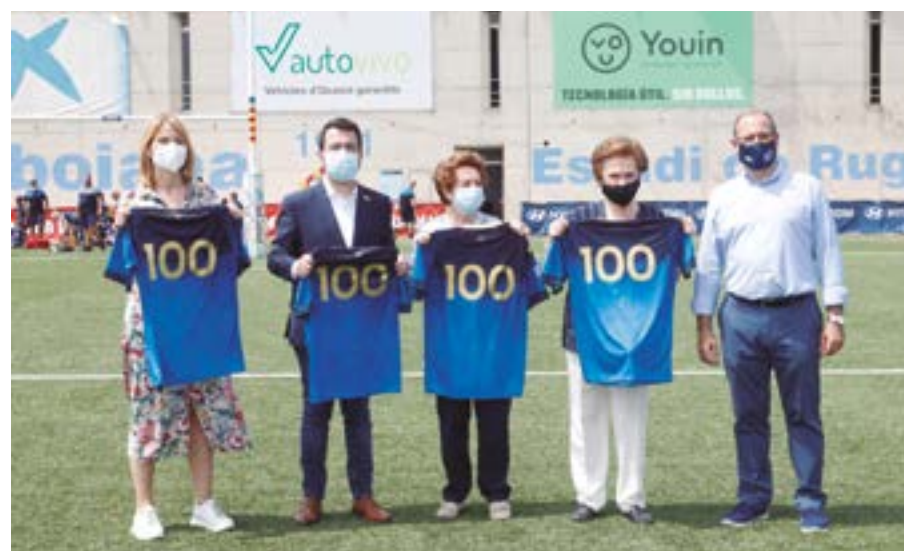
A l'acte institucional es va presentar la nova samarreta que vestiran els equips de l'entitat durant aquesta commemoració històrica