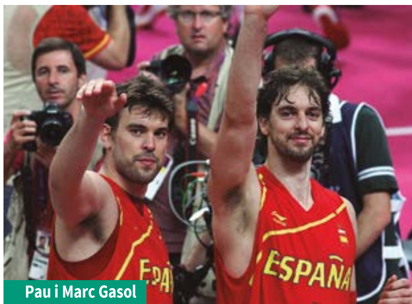
Pau i Marc Gasol