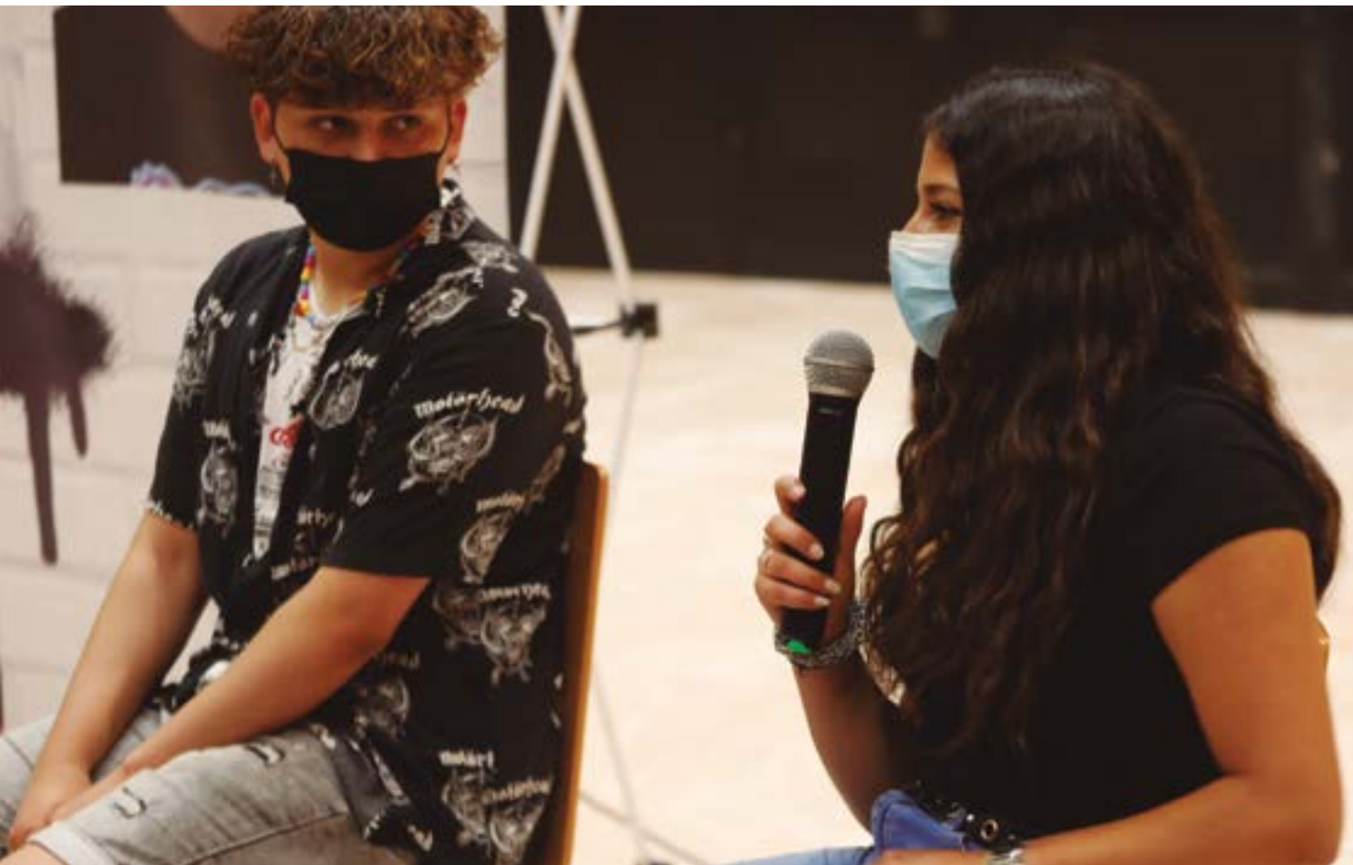
Adolescents de la ciutat van explicar les seves vivències de la pandèmia durant la presentació del Pla de Xoc

● La Diputació de Barcelona, l'AMB, la Generalitat i la Fundació Agbar col·laboren en el finançament del Pla de Xoc d'Adolescència de Sant Boi