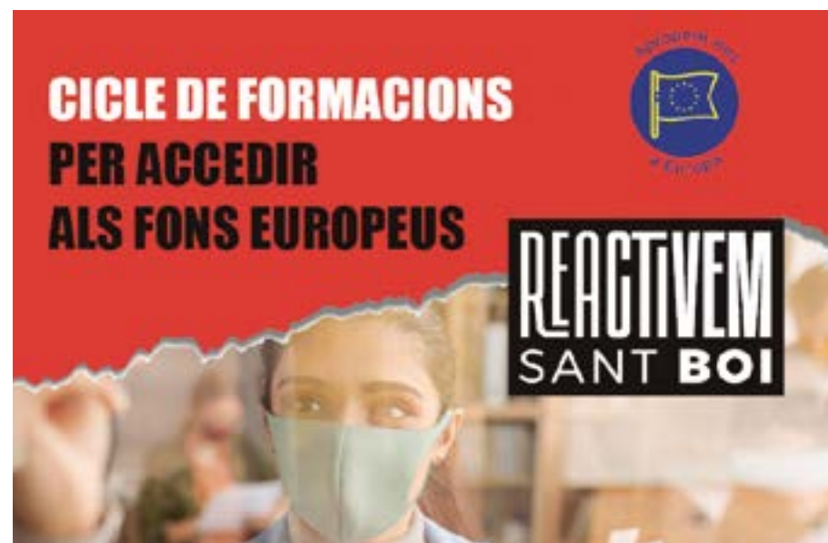
Al setembre es faran sessions temàtiques i sessions de formació específiques per a empreses comerços, entitats i operadors culturals, entre altres

El cicle continuarà a la tardor amb sessions temàtiques i sessions específiques per a públics concrets, com