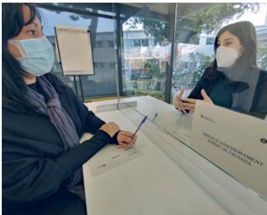
El nou servei de l'Ajuntament facilita tràmits i gestions amb altres administracions

Aquest nou servei municipal s'ubica provisionalment a l'edifici Sant Boi Centreserveis (carretera Santa Creu de Calafell), tot i que per accedir a ell cal demanar cita prèvia per telèfon (al 93 635 12 46) o mitjançant un formulari disponible al web municipal.