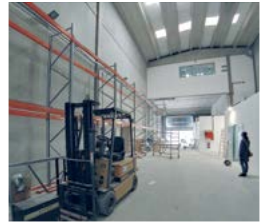
Almacén para los servicios de Verde urbano (calle Tints)