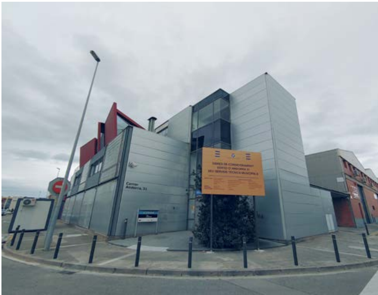
Este edificio de la calle Andorra albergará los servicios de Mantenimiento de equipamientos, Logística y Oficinas