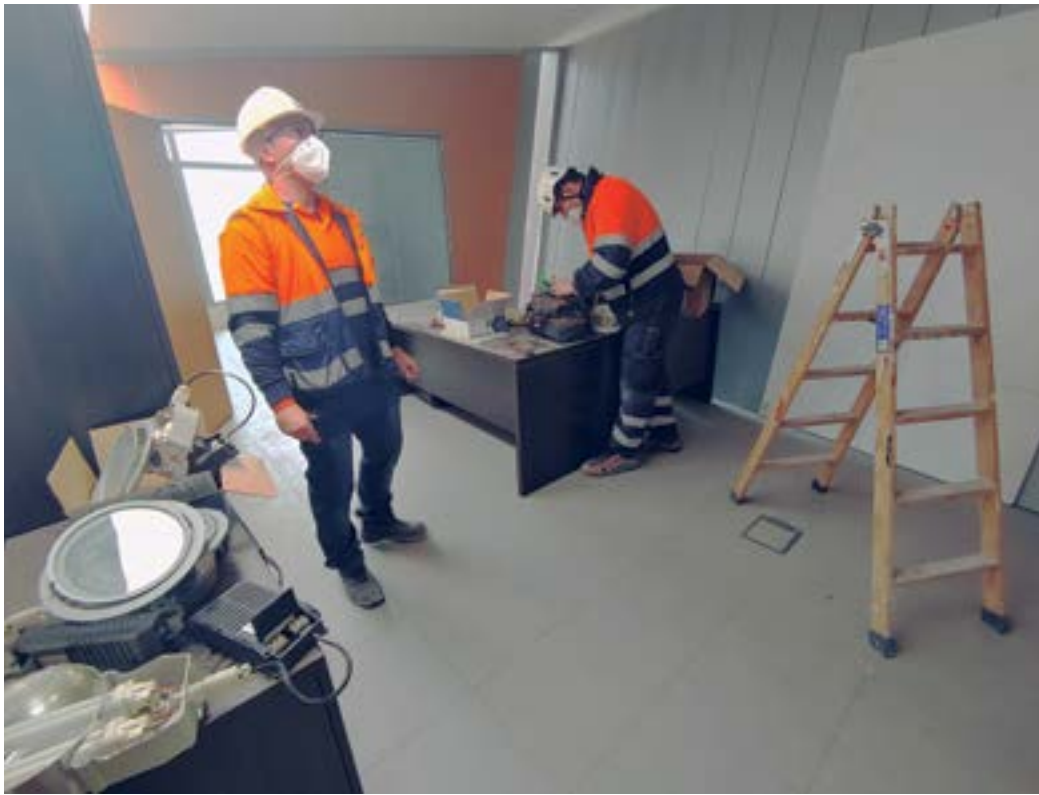
El propio personal municipal se encarga de acondicionar las nuevas instalaciones

sumos de energía, iluminación y climatización y las alarmas de la mayoría de equipamientos municipales.