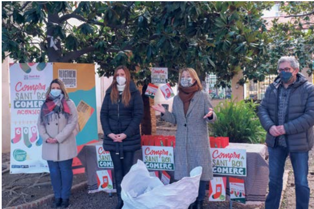
Els comerços de Sant Boi van lliurar 52.500 butlletes per participar en els sortejos de la campanya de Nadal