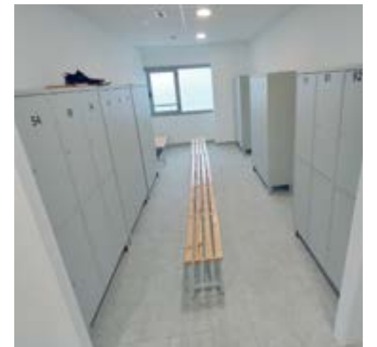
Vestuarios para los servicios de Espacio público (calle Fusos)