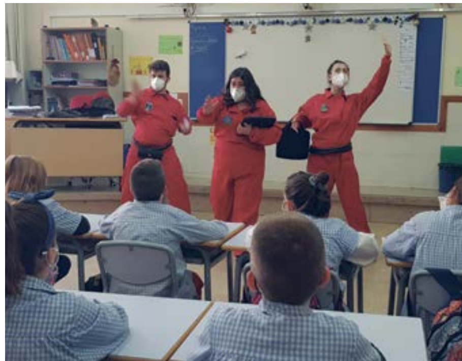
La cooperativa de teatre jove Inestables ha ofert micro teatre a l'alumnat de 4t de primària en el marc del programa educatiu Passaport Edunauta

Aquest curs la nostra ciutat ha estat un dels 10 municipis seleccionats per al projecte "Passaport Edunauta. Territoris que connecten oportunitats". Al gener, dins d'aquesta iniciativa, la cooperativa de teatre jove Inestables ha fet diverses intervencions de micro teatre a les escoles de Sant Boi per lliurar passaports a l'alumnat de 4t de primària i explicar com fer-los servir amb les seves famílies. L'objectiu és adquirir coneixements més enllà de l'escola i passar-ho bé en espais i moments diversos, com el museu, les biblioteques i les entitats del nostre territori. El "passaport" és una eina divertida que permet viatjar i aprendre experiències enriquidores tot sumant segells que acrediten allò que s'aprèn. La iniciativa està promoguda per la Fundació Bofill.