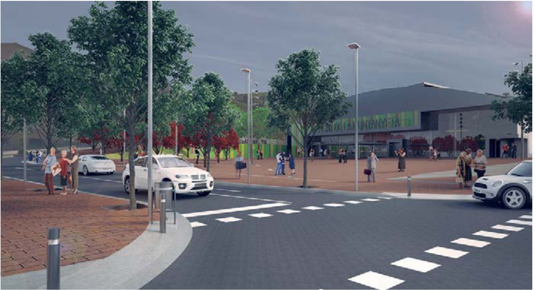
Las obras de remodelación permitirán ganar espacio para las personas, mejorar la accesibilidad y reforzar la conexión e integración de la actual plaza del Mercat de la Muntanyeta con el eje cívico y comercial de las calles Lluís Pascual Roca y Francesc Macià