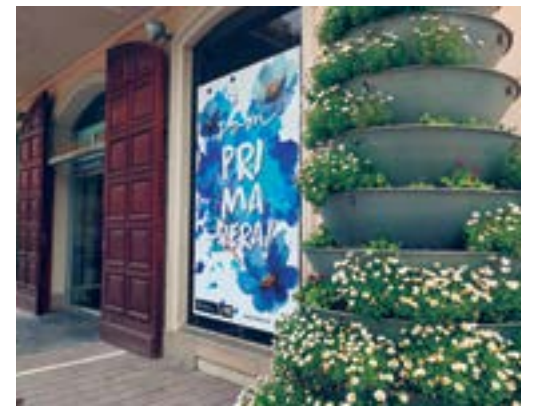
S'han posat jardineres amb flors als carrers de Lluís Pascual Roca, Francesc Macià, Eusebi Güell i Pau Casals i a la rambla de Rafael Casanova