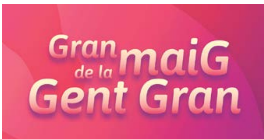
La programació ofereix activitats de teatre, cinema, tecnologia i esport

Durant el Gran Maig de la Gent Gran es podrà veure l'espectacle de cabaret Confinament Survivors , a càrrec de la