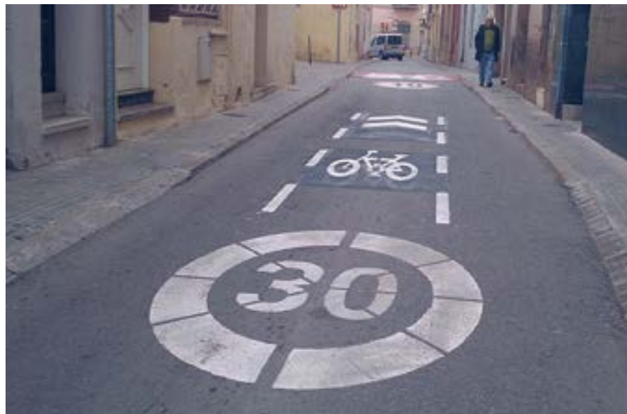
Des de l'any 2009, a la ciutat hi ha carrers amb la velocitat limitada a 30 km/h

La nova normativa obliga que als carrers d'un únic carril per cada sentit de circulació no es pugui anar a més