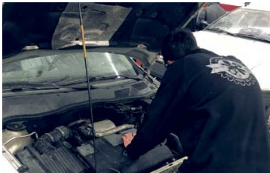
La preinscripció als Programes de Formació i Inserció (PFI) s'inicia al maig. S'ofereixen tres perfils de cursos diferents

Des de l'equipament municipal de l'Oliviera s'ofereixen tres perfils de PFI diferents: Auxiliar de reparació i manteniment de vehicles lleugers, auxiliar d'activitats agropecuàries i auxiliar de vendes, oficina i atenció al públic. Els cursos es fan en grups reduïts, amb un equip docent que