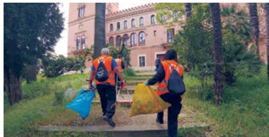
Igualssom treballa per la inclusió de persones amb discapacitat o trastorn mental

A l'abril, Igualssom ja ha netejat els parterres a Camps Blancs i Ciutat Cooperativa i Molí Nou i als dos parcs del barri de Marianao (parc de Marianao i parc de la Sargantana ), al voltant de l'Hotel El Castell, a l'exterior dels Jutjats i la comissaria dels Mossos, al carrer Pablo Picasso, als espais verds de la C-245, la zona de la Parellada i el carrer Bonaventura Calopa. Pròximament s'inclouran més zones, per arribar a la totalitat de parterres del municipi.