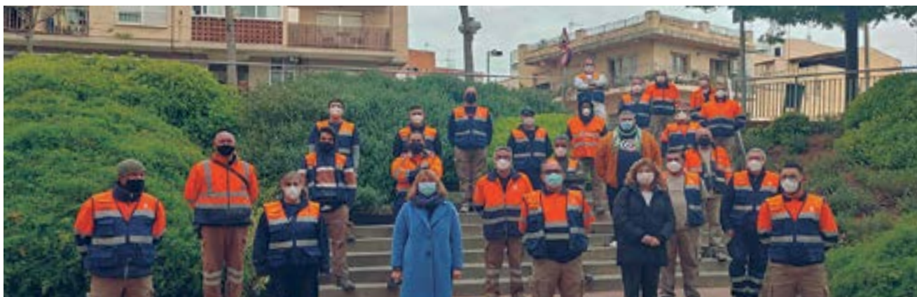
Un nou pla d'ocupació reforça les tasques de neteja viària, jardineria, fusteria, escocells, lampisteria i pintura.