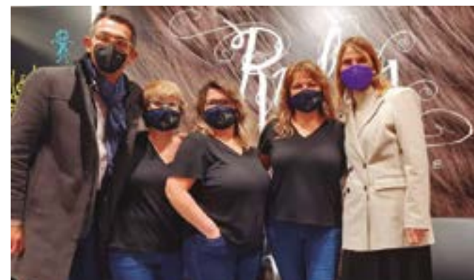
Rulos Estilisme (Mossén Jacint Verdager, 108)