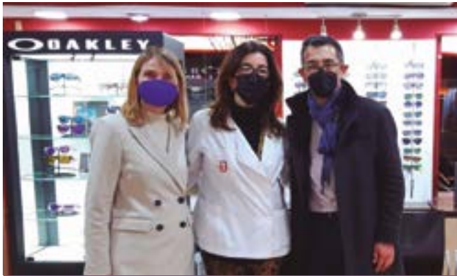
Òptica Sant Jordi (Mossén Jacint Verdager, 110)