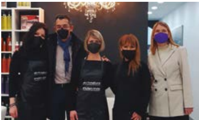
Naisís (Plaça Catalunya, 28)