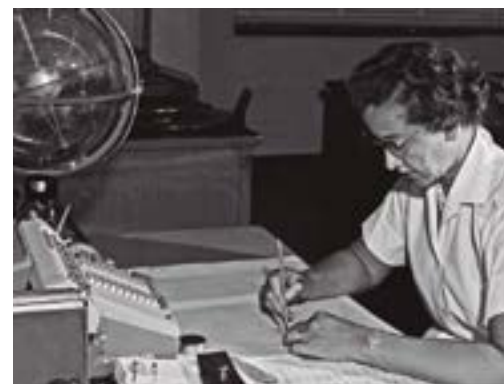
Tres dones que són referents històrics en el camp de la ciència: Marie Curie, Hipàtia d'Alexandria i Katherine Johnson