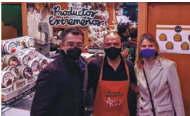
Productos Extremeños (Mossén Jacint Verdager, 192)