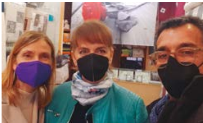
Mela Tèxtil, roba de la llar (Mossén Antoni Solanes, 91)