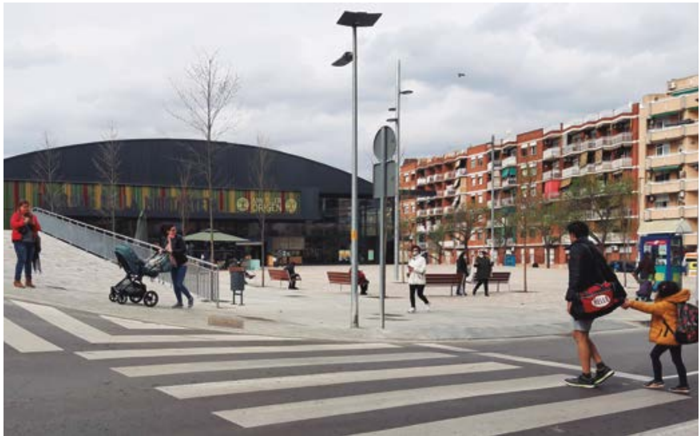
Les obres han guanyat espai per a vianants i han suprimit barreres arquitectòniques