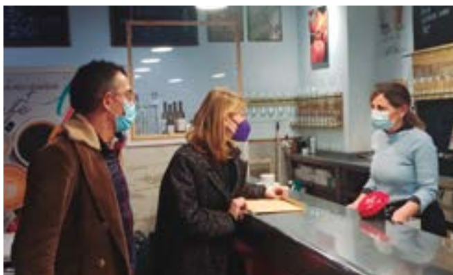
La Mossegada (carrer Francesc Macià, 82)