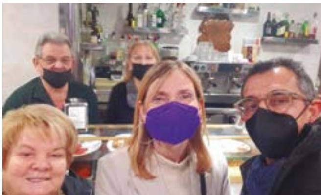
Bar Frankfurt Trébol (Mossén Antoni Solanes, 82)