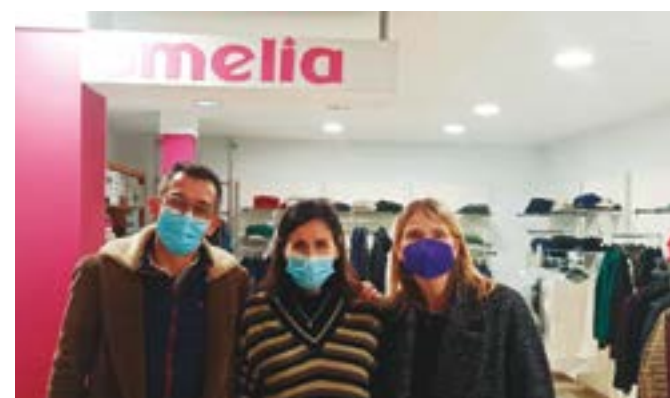
Modas Amelia (Mossén Jacint Verdager, 149)