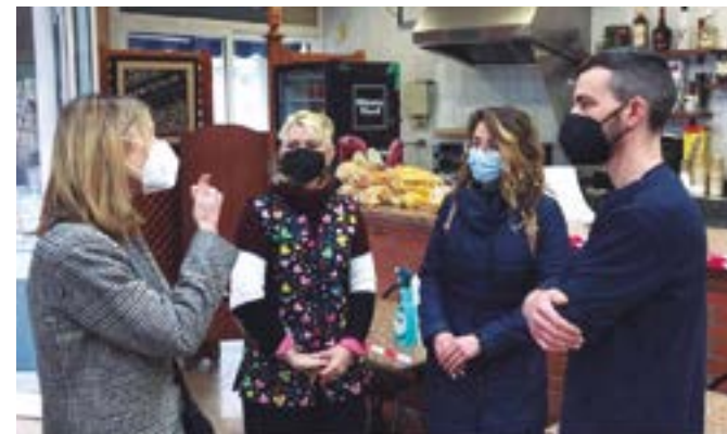
Churrería La Esperanza (carrer Girona, 35)