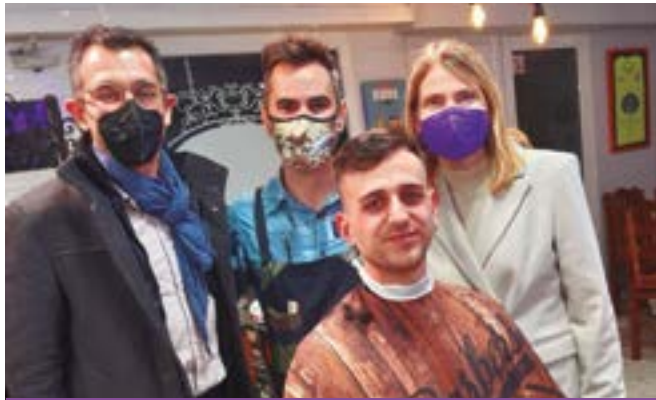
La Barbería del Cuartel (carrer Pau Claris, 89)