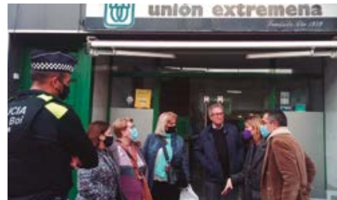
Unión Extremeña (Mossén Jacint Verdager, 161)