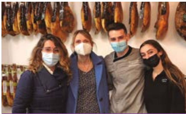
Selectum Maestros Jamoneros (ronda de Sant Ramon, 93)