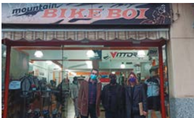
Bike Boi (Mossén Jacint Verdager, 163)