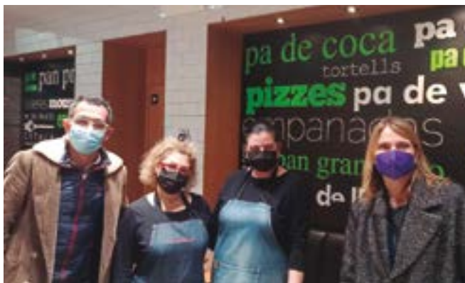
Forn La Rosella (Mossén Jacint Verdager, 157)