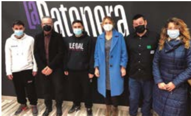
La Ratonera (Antoni Gaudí, 8)