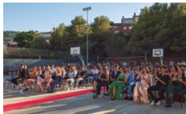
Graduació Institut Marianao