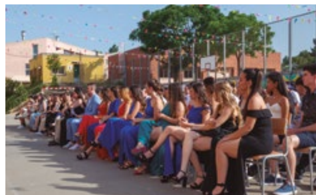
Graduació Batxillerat INS Rubió i Ors