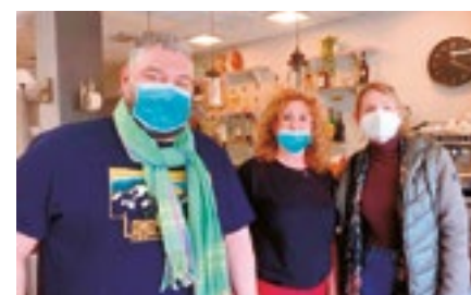
Restaurant El Gaucho (Joventut, 12)