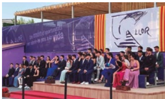
Graduació Batxillerat Llor