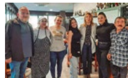
Restaurant El Portugués (Dr. Antoni Pujadas, 48)

Durant les jornades de treball i visites als barris de Sant Boi, l'Ajuntament continua donant suport al comerç i la restauració de proximitat. A l'edició del mes de juny del Viure Sant Boi , es van relacionar erròniament els noms i les fotografies d'alguns dels establiments que havien rebut aquestes visites. Per aquest motiu, en aquest número els tornem a publicar.