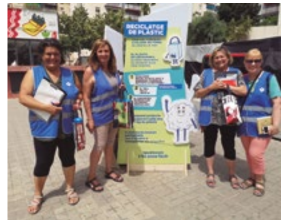
Imatge de l'exposició itinerant pels casals de barri, amb la distribució d'ampolles i bosses porta clakis