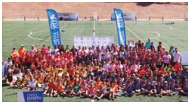
Cloendes de curs dels Jocs Esportius Escolars