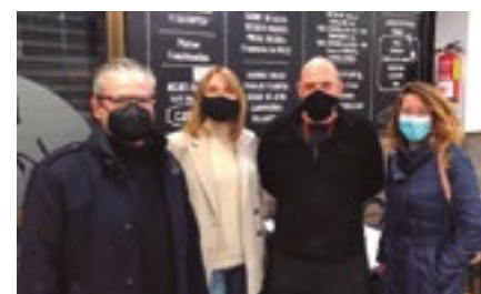
Bar La Ruta (Joan Pagès, 7)