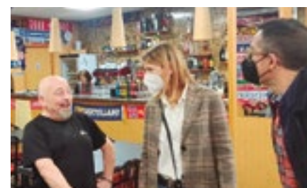
Restaurant Can Lluís (ronda de Sant Ramon, 179)