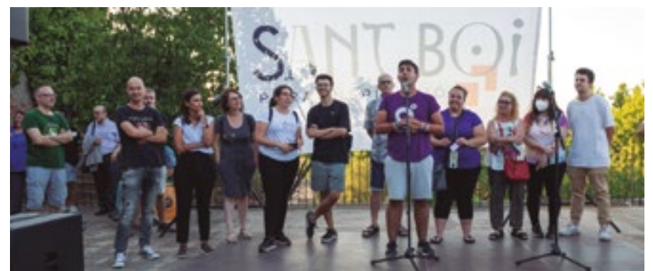
L'alcaldesa va destacar el relleu generacional que viu el teixit associatiu local