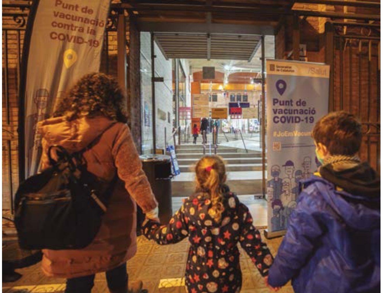
L'Ajuntament ha cedit al Servei Català de la Salut l'ús de Can Massallera com a punt de vacunació contra la covid

de la Vila. La nau antiga ha quedat destinada a projectes de recerca i desenvolupament (R+D).