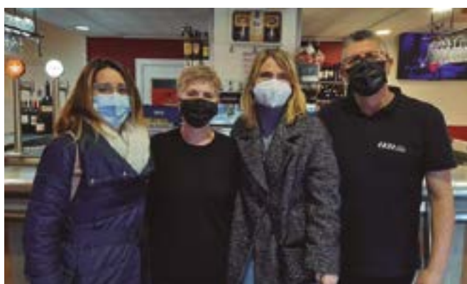
1331 Bar (carrer Eusebi Güell, 7)