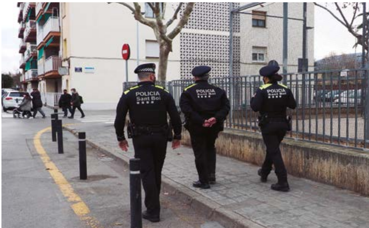
Agents de la Unitat de Seguretat Comunitària (USEC) patrullen al barri de Ciutat Cooperativa i Molí Nou