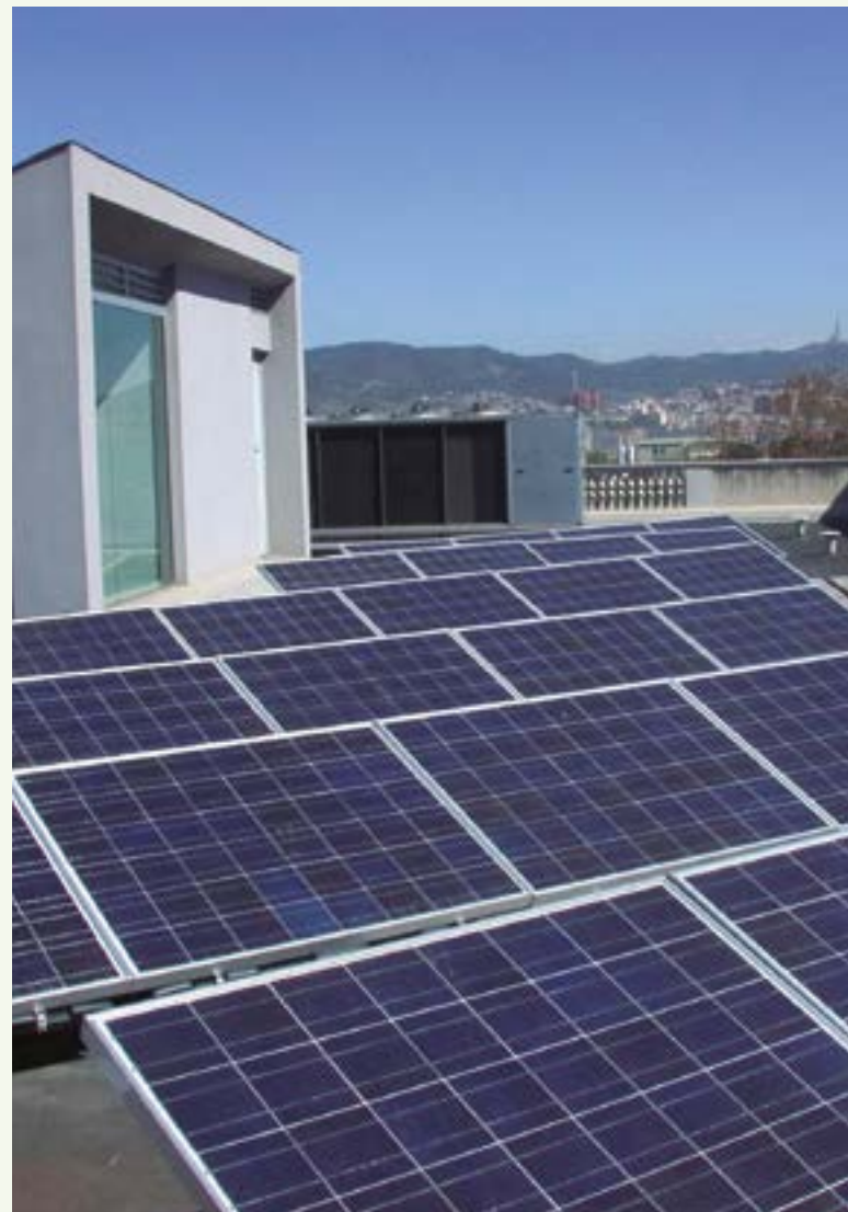
El Ayuntamiento prevé instalar placas solares en 16 edificios públicos y crear zonas de autoconsumo compartido

La madera se seca y se trata en un almacén de biomasa situado en el camí del Llor y, posteriormente, se aprovecha para alimentar la primera red de calor de Sant Boi, que ya está en funcionamiento en la zona de equipamientos de La Parellada. Con ella se proporciona agua caliente para las duchas y la calefacción de la escuela, los vestuarios del campo de fútbol y el polideportivo.