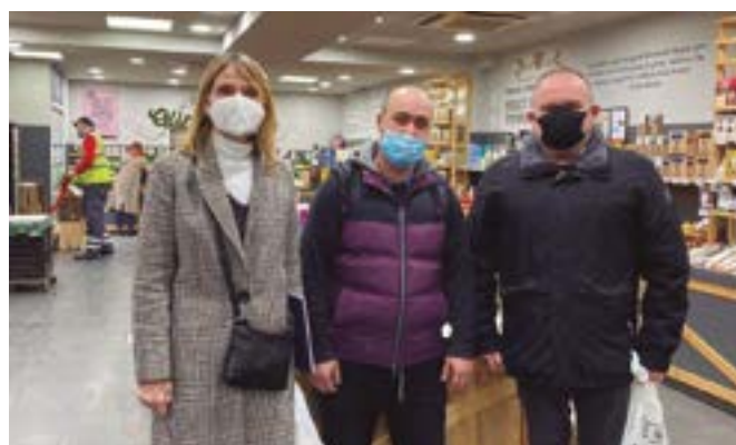
Cal Fruitós (carrer Primer de Maig, 54)