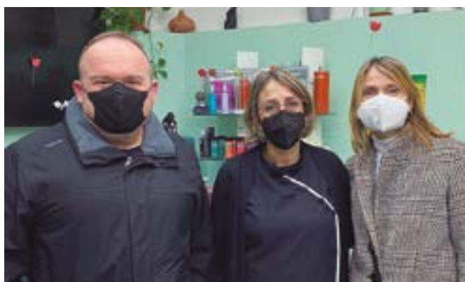
Perruqueria De Luxe (carrer Primer de Maig, 50)