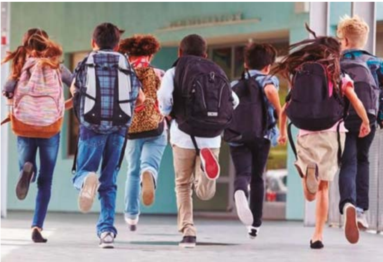
Les polítiques municipals aposten per una educació que no deixi ningú enrere i que ensenyi a conviure pacíficament