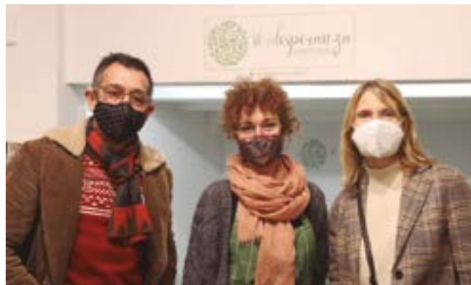
Verde Esperanza (carrer Major, 3)