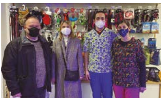
VetXperience Clínica Veterinària (carrer Frederic Mompou, 33)