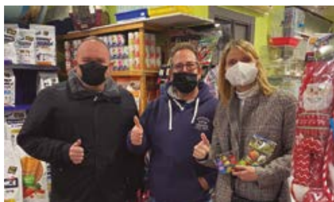
Prehistòrics Sant Boi (carrer Primer de Maig, 48)