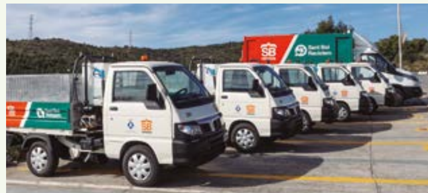
La flota municipal ha empezado a incorporar vehículos eléctricos y de gas

Una ciudad verde, inclusiva y justa en el ámbito de la energía necesita un compromiso compartido por la ciudadanía, los comercios, las empresas, el tejido social y el Ayuntamiento