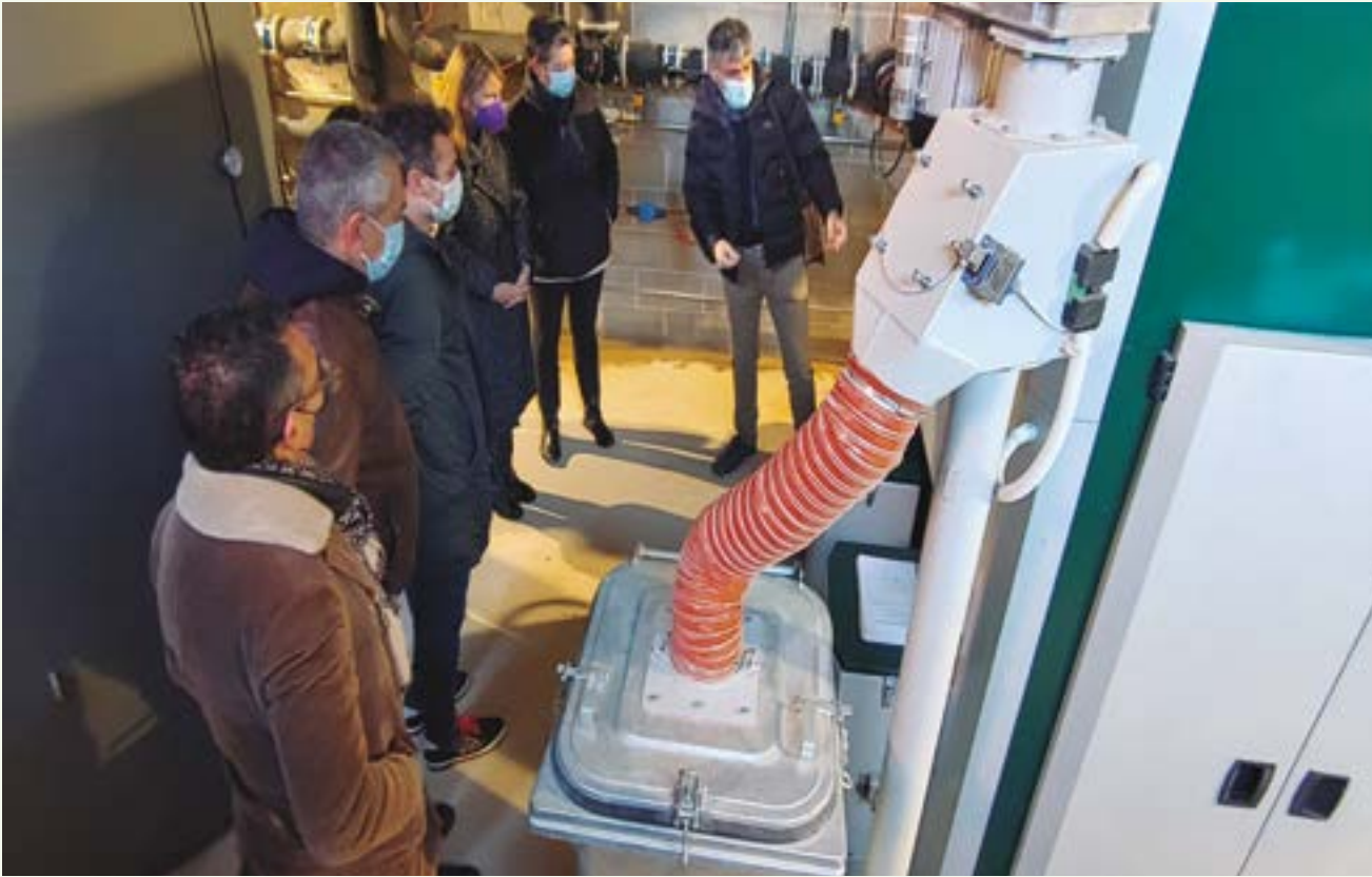
Desde finales de 2021, la caldera de biomasa de La Parellada proporciona agua caliente para las duchas y la calefacción de la escuela, el polideportivo (incluida la piscina) y los vestuarios del campo de fútbol