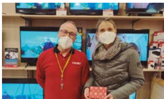
Electrodomèstics Calbet (carrer Jaume I, 84)