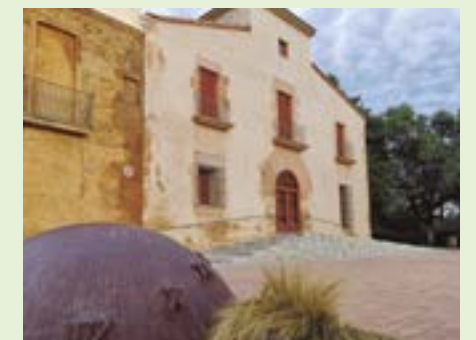
La masía Can Julià es la sede de AEMAS

La sede de AEMAS es la masía Can Julià (calle Bonaventura Calopa, 26), situada en el entorno del parque del mismo nombre.