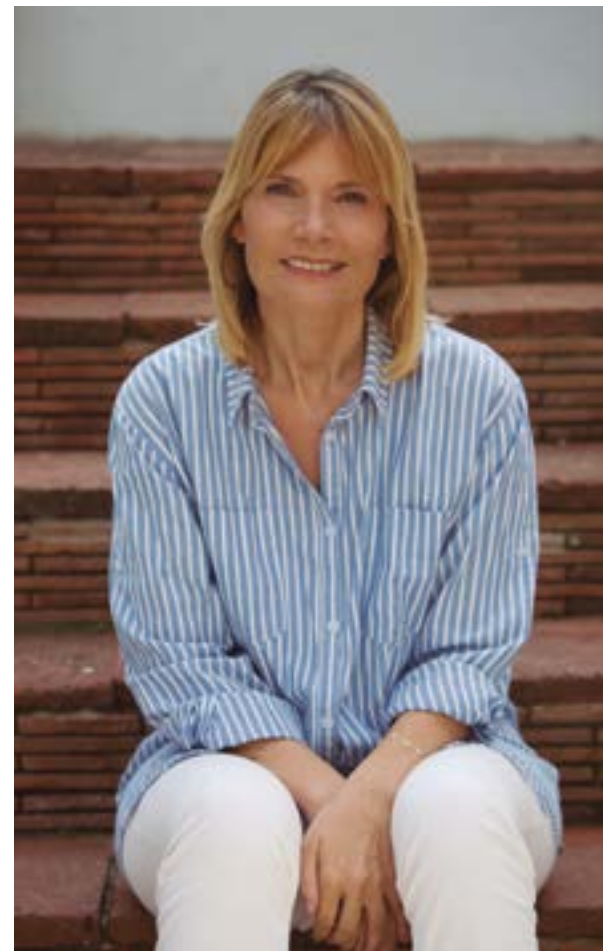
Lluïsa Moret i Sabidó, alcaldessa

Pero las nuevas cuentas municipales pretenden sobre todo dar continuidad al proceso de reactivación social y económica de la ciudad. La lucha contra la desigualdad, agravada por la pandemia, y el conjunto de servicios dirigidos a la ciudadanía (con un gasto que representa el 43% del Presupuesto) vuelven a dar sentido a la agenda política y presupuestaria de Sant Boi.