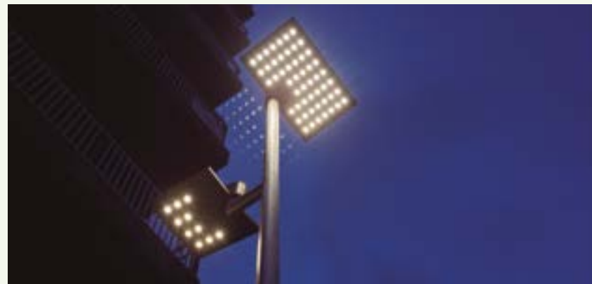
Todo el alumbrado público de Sant Boi funcionará con tecnología LED

En el ámbito de la movilidad se está llevando a cabo una acción para ambientalizar la flota municipal, con el objetivo de conseguir una gestión eficiente y sostenible de los vehículos. Se ha iniciado ya la sustitución de los más antiguos y contaminantes por vehículos eléctricos y de gas natural comprimido (GNC). Una plataforma de gestión inteligente de la flota permite optimizar su uso y mantenimiento, reducir consumos y emisiones de CO 2 , ganar en seguridad y disminuir el gasto público.