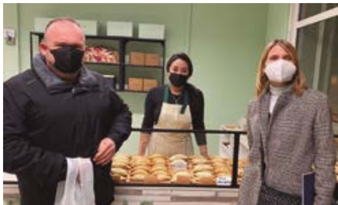
Majaretas, Empanadas Argentinas (camí Vell de la Colònia, 9)