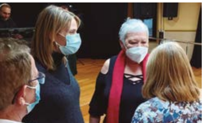
Associació de Gent Gran de Ciutat Cooperativa i Molí Nou