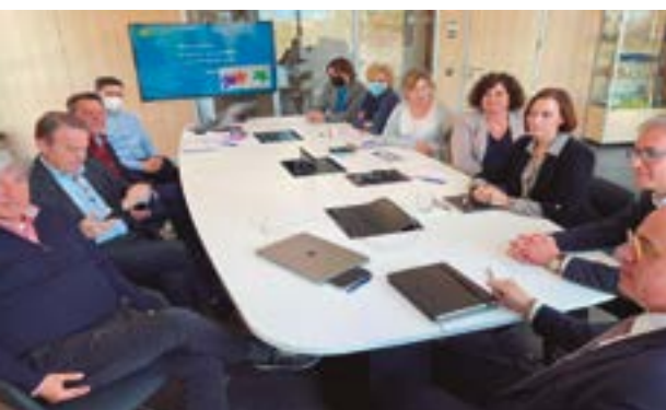
Empreses referents del sector van aplegar-se en una reunió de treball

L'Ajuntament va reunir el dia 5 d'abril un grup d'empreses santboianes referents i agents clau en l'àmbit de la logística i la formació (concretament, Lotrans, Naeko, Schneider Electric, BCCL, ICIL, Vit Air Cargo, la fundació Transcatlit i la Fundació Llor).