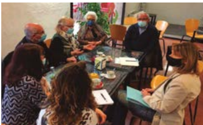
Gent Gran de Marianao