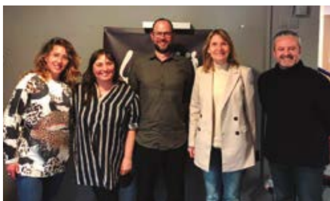
Espai cultural Les Muses