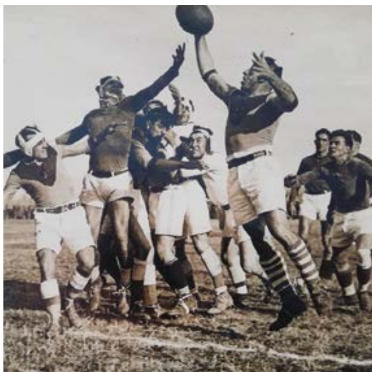
Una de les moltes imatges històriques del Centenari. Una touche en un partit al Camp del Riu guanyada per la UES a finals dels anys 1920.