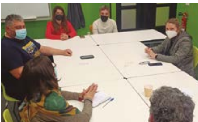
Camps Blancs TransForma