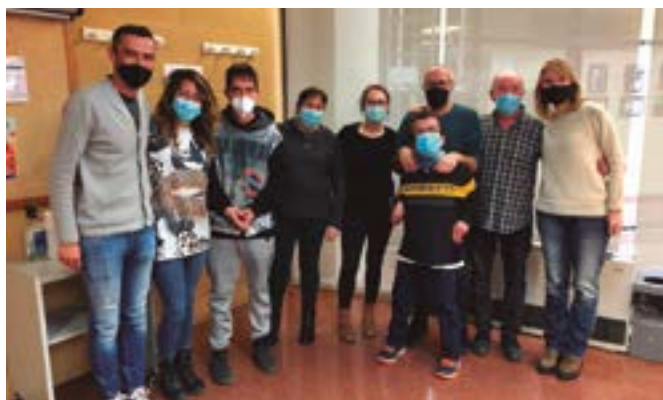
Tots Som Santboians