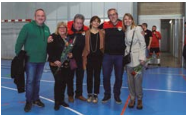
Club Handbol Sant Boi