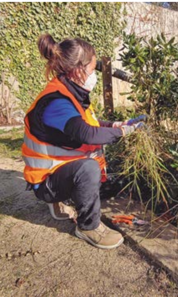
Treballs de jardineria a l'espai públic