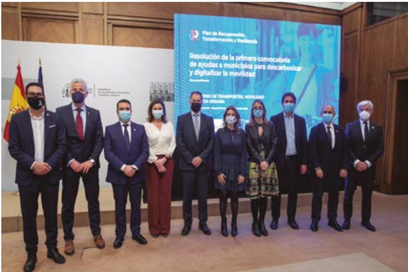
La ministra Raquel Sánchez va presidir la presentació dels ajuts, que va tenir lloc a finals del mes de febrer a la seu del Ministeri de Transports, Mobilitat i Agenda Urbana (Mitma)