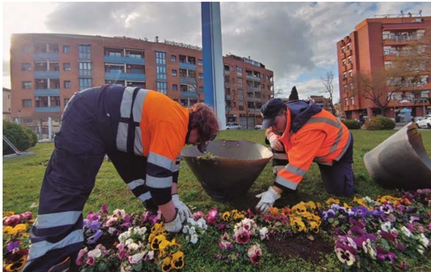
La majoria de les tasques de manteniment del 'verd urbà' estan al càrrec de la brigada municipal