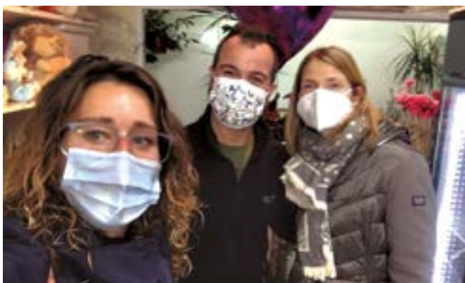
Floristeria Amore (carrer Raurich, 2)