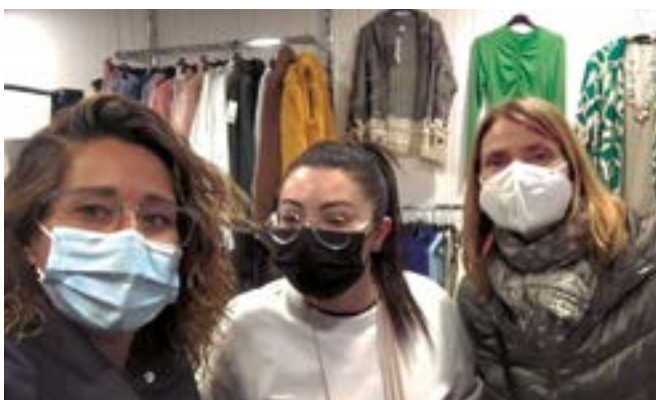
Fashion Paradise (carrer Montmany, 27)