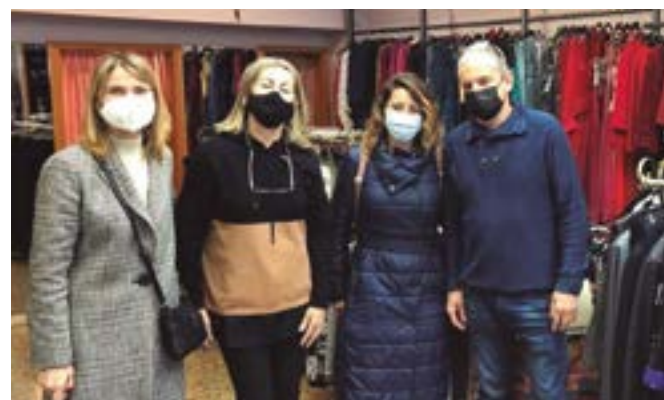
Modas Mayte (plaça Generalitat, 28)