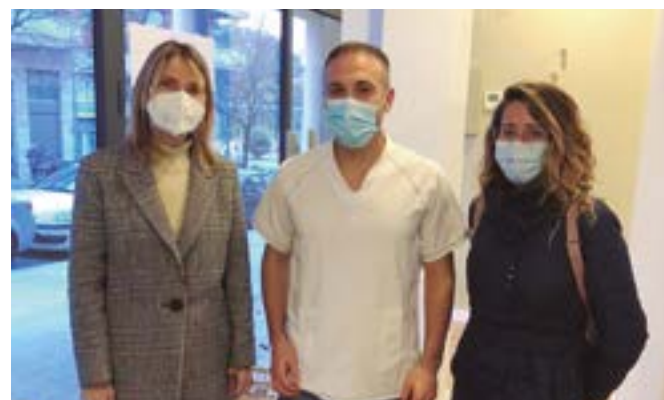
Henko Osteopatia (Lepant, 34)