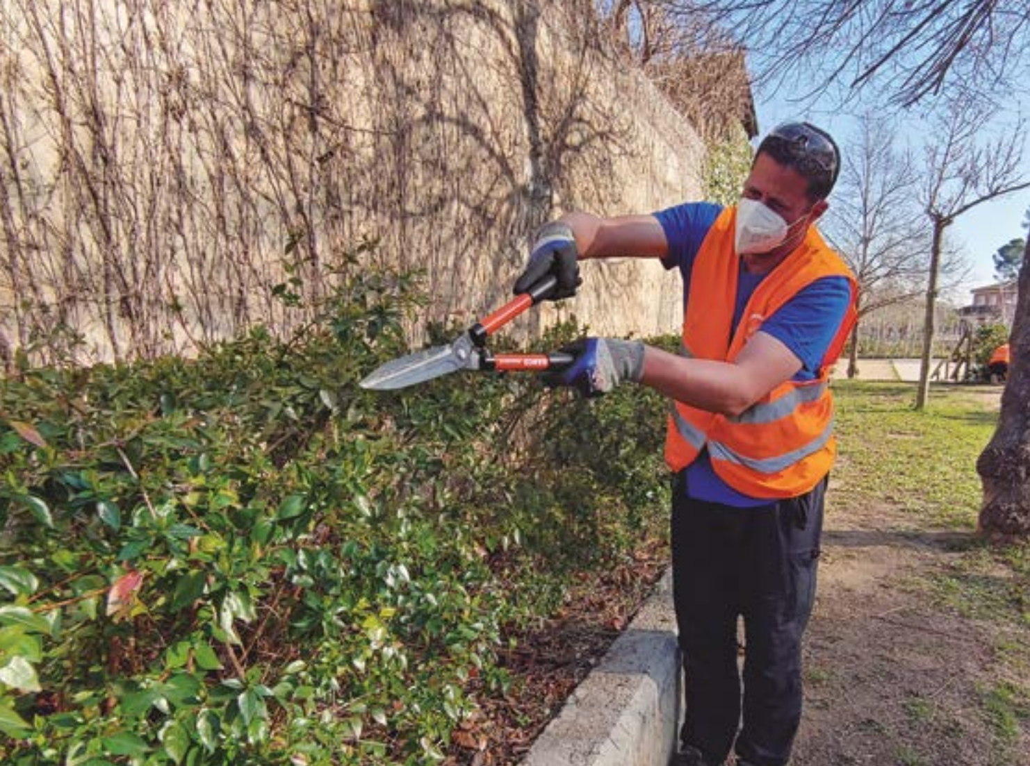
L'empresa Igualssom s'ocupa del manteniment de zones verdes a diferents indrets de Sant Boi