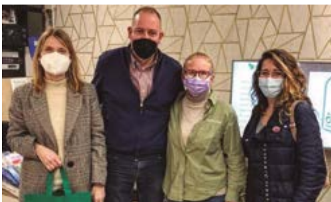
Mundo Ozono (ronda de Sant Ramon, 111)