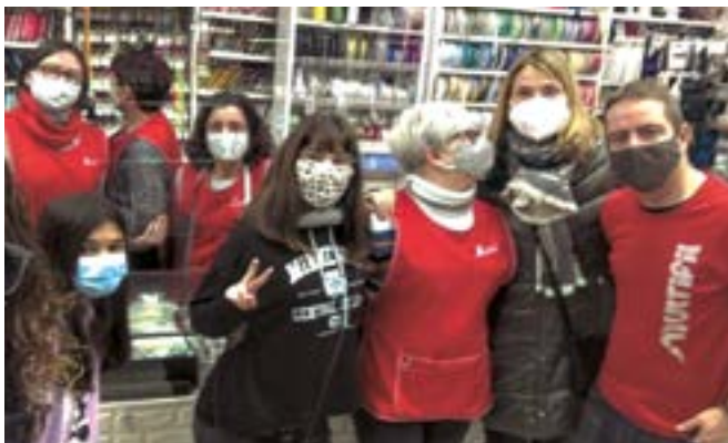
Multifil (carrer Montmany, 25)