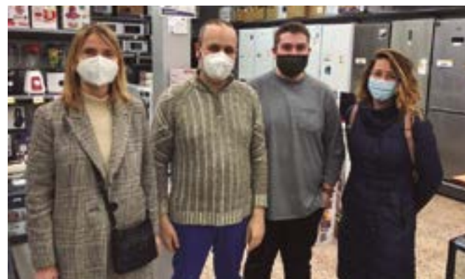
Electrolozano (ronda de Sant Ramon, 102)