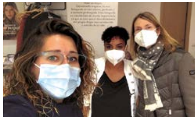
Ikigai Bellesa (carrer Francesc Pi i Margall, 66)