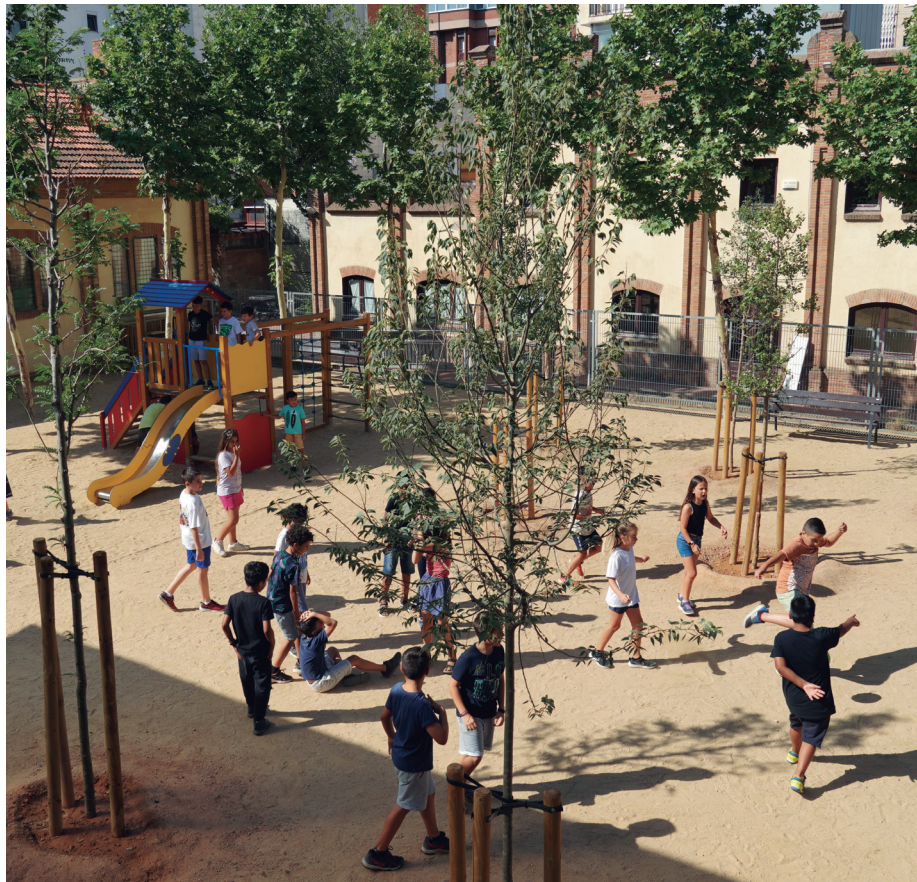
La presència de vegetació a l'exterior de les escoles s'està incrementant per ajudar a millorar el confort tèrmic (a la imatge, Escola Can Massallera)

L'Ajuntament destina més 400.000 euros per a nous espais d'ombra als patis i ventiladors a les aules