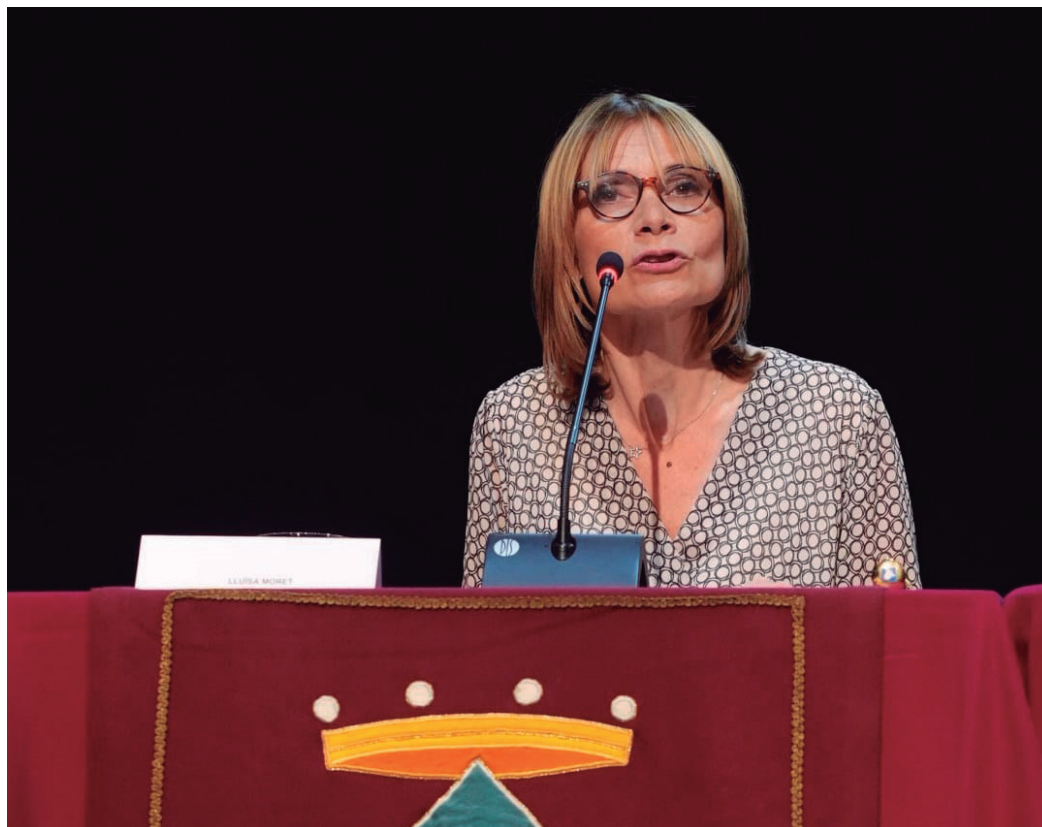
L'alcaldesa va afirmar sentir-se orgullosa de continuar treballant "per la ciutat que estimo"

→ L'alcaldesa va prendre possessió del càrrec el 17 de juny a Can Massallera. Al discurs d'investidura va apostar per un mandat amb "diàleg constructiu, lluny de la confrontació i la intolerància"