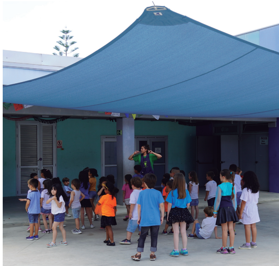
Algunes escoles han prioritzat que es col·loquin tendals per amortir l'impacte dels raigs de sol als patis (a la imatge, Escola Vicente Ferrer)

La situació de canvi climàtic que vivim té conseqüències en molts aspectes de la vida quotidiana de les ciutats. La incidència de les altes temperatures n'és un dels signes més evidents i un dels llocs on es pateixen els seus efectes són les escoles.