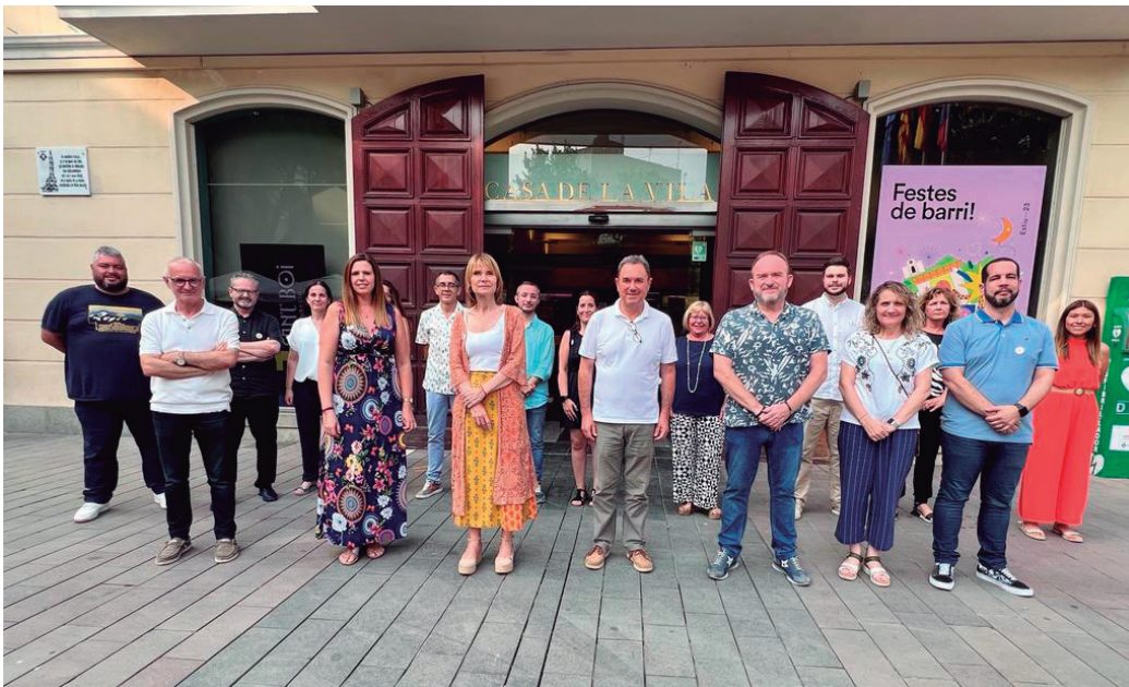
El nou equip de govern de l'Ajuntament està format per 18 regidores i regidors

→ L'estructura del govern municipal segueix les línies de treball de l'Agenda Urbana de Sant Boi i els ODS