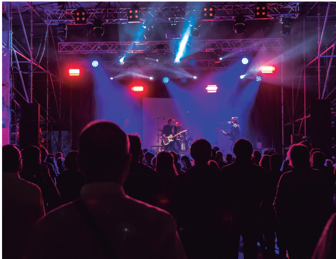
Concert de Los Deltonos a l'escenari de la plaça de l'Ajuntament en una edició anterior del festival

I l'associació santboiana Karxofarock, serà l'encarregada d'apropar als infants i les seves famílies a l'univers del hip-hop a través de l'Altaveu en Família.