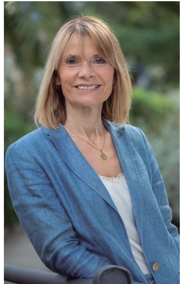
Lluïsa Moret i Sabidó, alcaldessa

También me gusta compartir los momentos en los que la ciudadanía santboiana celebra y recoge el fruto de su esfuerzo, como la semana pasada en el acto de reconocimientos deportivos que tuvo lugar en Can Castells. Fue el momento de premiar a los clubs, entidades y santboianos y santboianas que cada día dan impulso a la práctica deportiva, que se despliega en nuestro municipio acompañada siempre de valores como el trabajo en equipo, la tolerancia o la igualdad. Días antes, Sant Boi acogió la I Copa Senior Femenina del Baix Llobregat, el primer campeonato de fútbol 7 femenino, que contó con cuatro equipos santboianos y otros de la comarca. Con esta vitalidad deportiva, no sorprende que por los mismos días el Secretario de Estado de Deportes visitara el Club de Béisbol y Softbol de Sant Boi, en otra muestra de reconocimiento al empuje y al carácter referente del deporte santboià. Empuje y mucho talento que se manifiestan en todos los ámbitos de la actividad ciutadana, desde la educación, la cultura o la empresa hasta la salud o la cooperación. Es esta la base para seguir trabajando, para seguir construyendo de forma colectiva una ciudad cada vez más habitable, cada vez más igualitaria, cada vez más segura y con más oportunidades para todos.