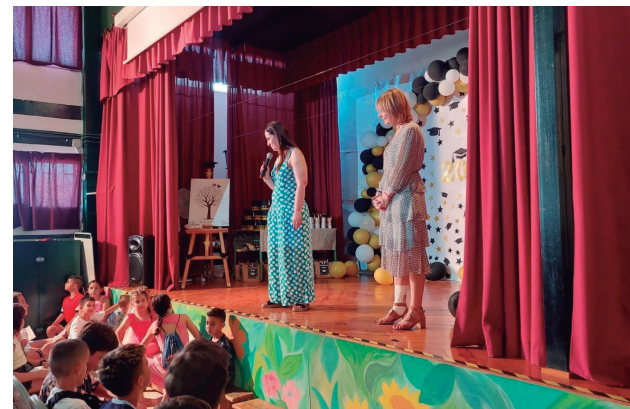
Comiat Amat Verdú

També han tingut lloc diversos comiats d'equips esportius. Recollim la trobada on més de 700 esportistes es van reunir per celebrar la cloenda dels Jocs Esportius Escolars 2022-2023.