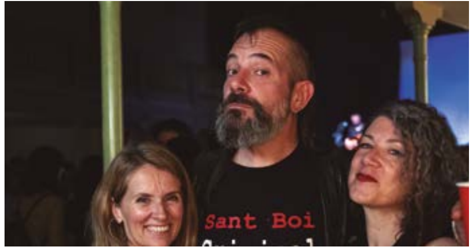
Nit Knaya a Cal Ninyo amb Jo ni Cas, 13 Grados i La Pereza del Loco