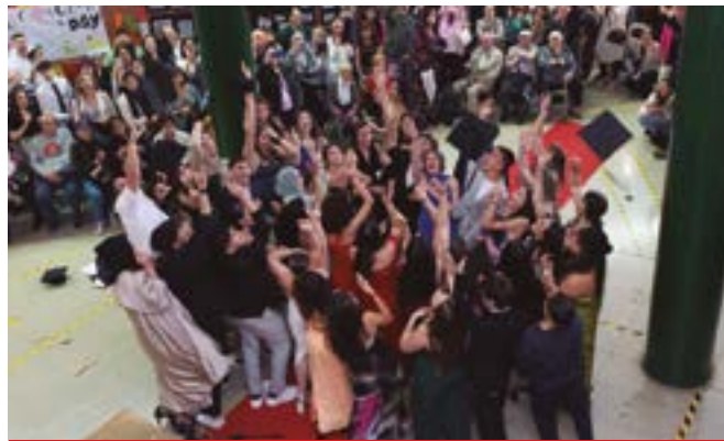
INS Rafael Casanova