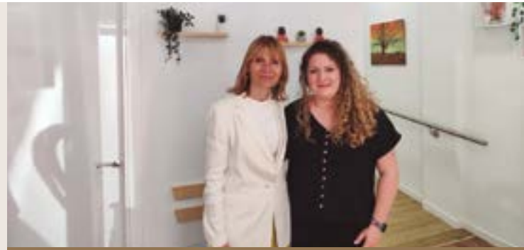
Vita Stètic (carrer Rosselló, 69)