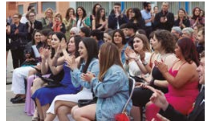
IES Camps Blancs