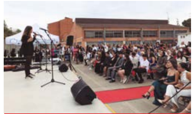
Graduació 4t ESO Camps Blancs