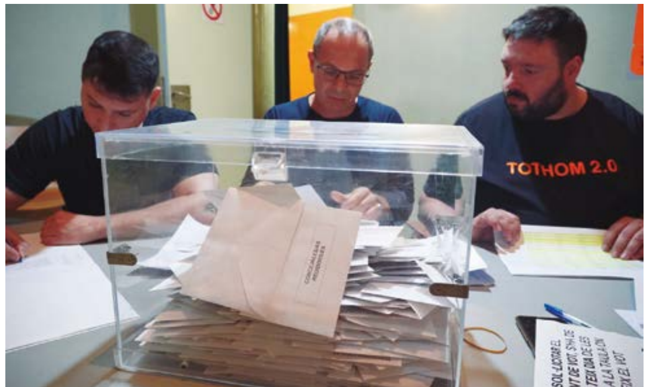
El 28 de mayo se celebraron las duodécimas elecciones locales del período democrático