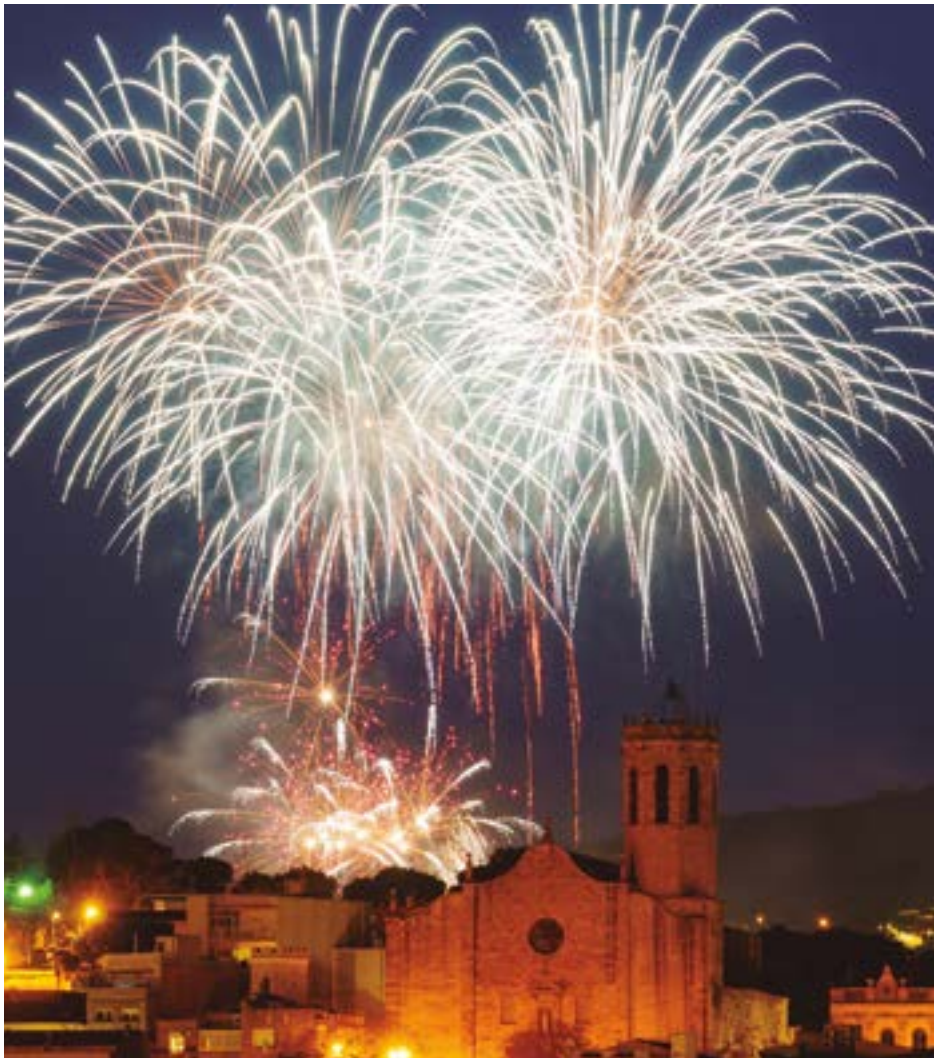
El Piromusical va tancar la festa tot il·luminant el cel de la ciutat.