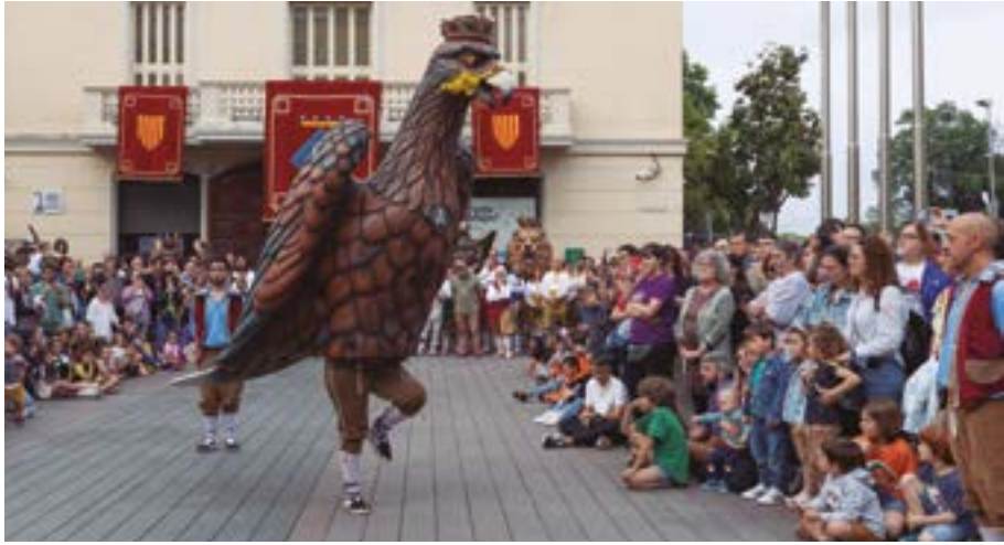
Presentació del nou element del bestiar de la ciutat: L'Àliga