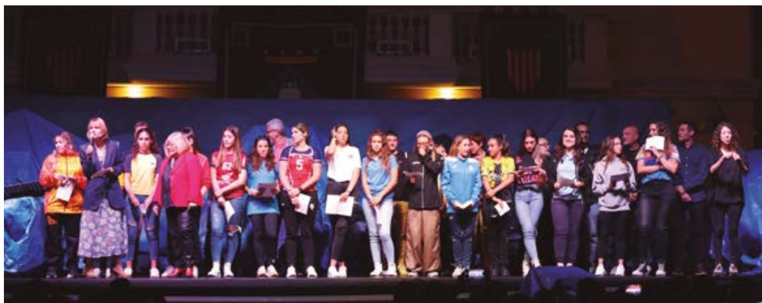
Representants dels equips femenins dels esports que es practiquen a Sant Boi van ser les encarregades de fer el pregó que va marcar l'inici de la Festa Major.