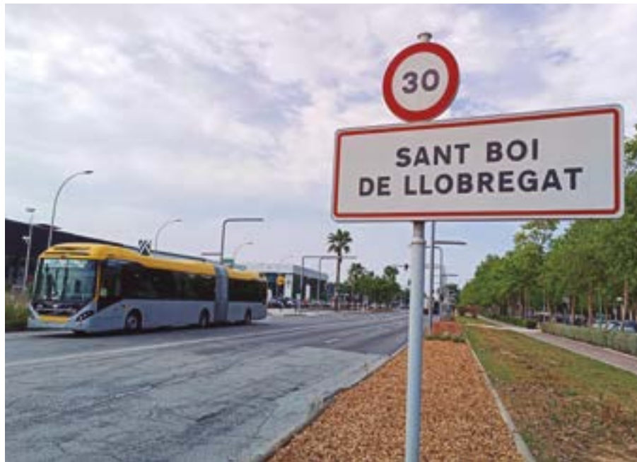
La línia circula pel carril bus segregat de la C-245 i connecta els municipis de l'eix de la carretera amb el metro, el tramvia i Rodalies a l'intercanviador de Cornellà

A més, les marquesines de les parades disposen ara d'il·luminació durant la nit i d'una pantalla informativa on s'indica el temps d'espera previst.