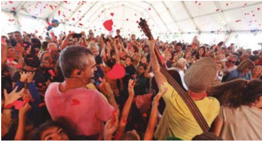
Espectacle familiar amb Xiula