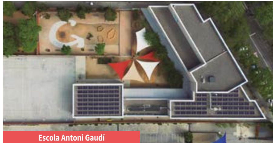
Escola Antoni Gaudí

El següent equipament on ja es treballa és el Casal de Marianao. L'Agrupació d'Empreses Ambientals i Sostenibles de Sant Boi (AEMAS) executa les obres mitjançant l'empresa municipal Claus. Les actuacions formen part del projecte estratègic municipal 'Sant Boi té energia'.