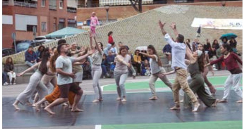
Sant Boi Balla, espectacle comunitari