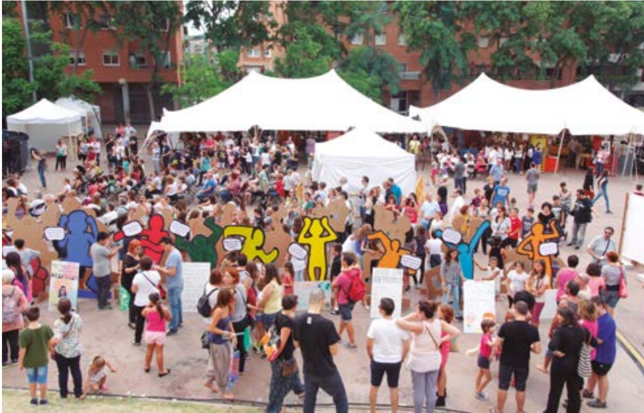
La trobada del Barrejant mostra cada any l'aposta de Sant Boi per la solidaritat i la cooperació