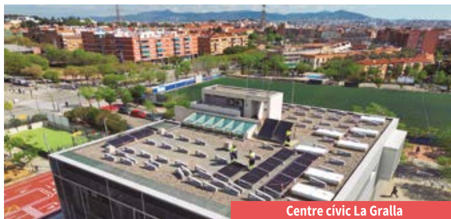
Centre cívic La Gralla