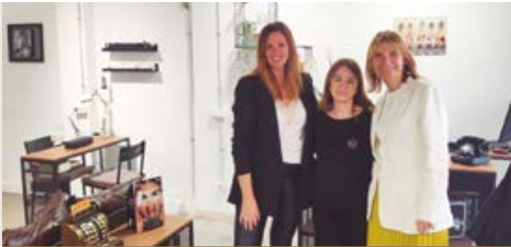
Peluquería Miriam (carrer Montmany, 25)