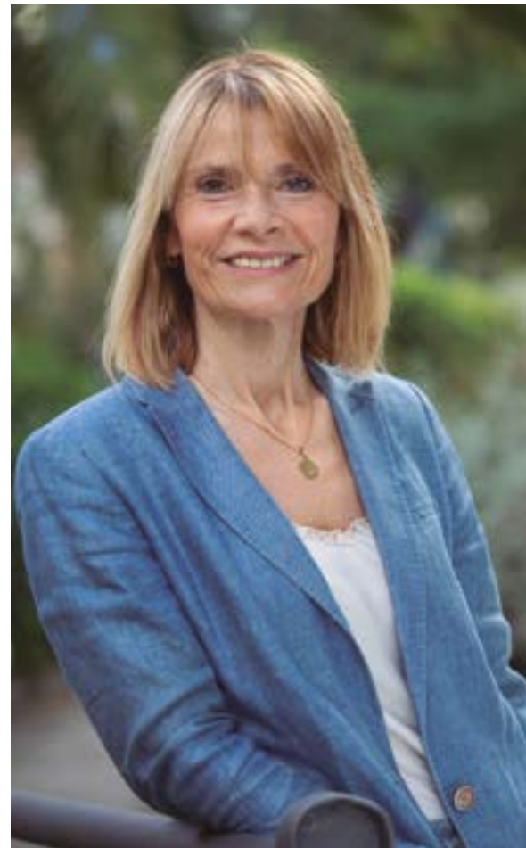
Luïsa Moret i Sabidó, alcaldessa

→La Festa Major és el millor aparador de la nostra vitalitat i empenta col·lectiva