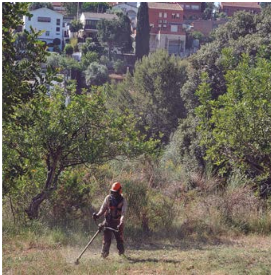
A causa de l'excepcional situació climatològica, Sant Boi amplia enguany la dotació de recursos i les actuacions de prevenció contra incendis

Bombers, Protecció Civil, ADFs i voluntaris de Sant Boi també treba-