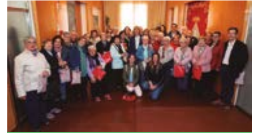
Puntaires del Barri Centre

Magnífica organització i èxit de participació en aquesta nova edició de la Cursa de la Roca Negra. Enhorabona a les persones participants per l'esforç i l'empenta.