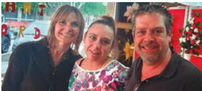
Floristeria Roser (Carrer Mossèn Antoni Solanas, 17)