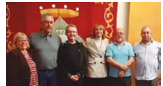
Junta Club de Billar Sant Boi