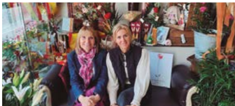
Floristeria Torrents (Carrer Lluís Pascual Roca, 81)