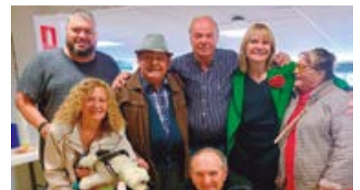
Associació Gent Gran de Casablanca