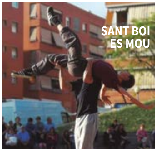
SANT BOI ES MOU