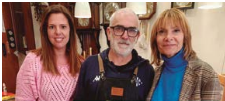
Rellotgeria Joieria Gelabert (Carrer Lluís Castells, 13)