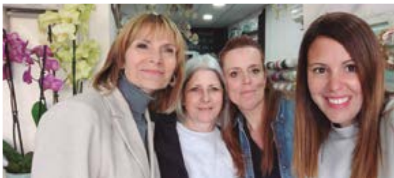
Floristeria Celinda (Carrer Girona, 21)