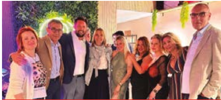
Perruqueria Rodelas (Carrer Tres d'Abril, 28)