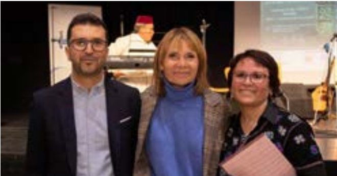
Associació Ibn Rochd-Iftar intercultural