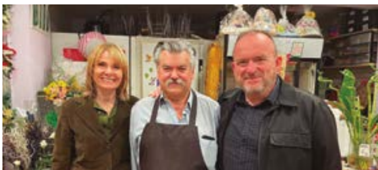
Floristeria Tere (Carrer Primer de Maig, 54)