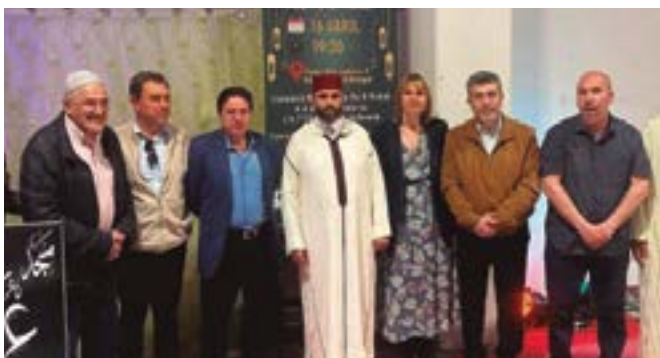
Mezquita Omar Ibn El Khattab-Iftar intercultural