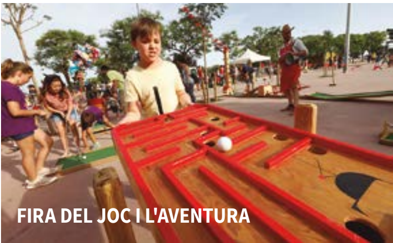
FIRA DEL JOC I L'AVENTURA