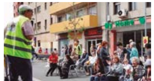
Avv Poblet Marianao