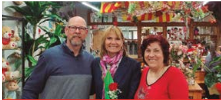
Floristeria Cáliz (Carrer Cardenal Vidal i Barraquer, 4)