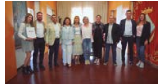
Nova Junta Sant Boi Empresarial