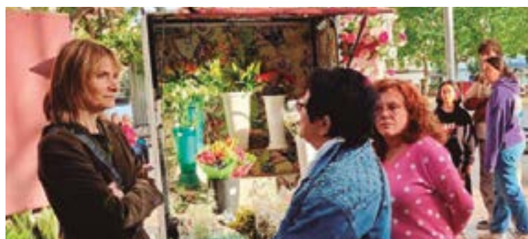
Floristeria Quiosc La Plaza (Plaça Catalunya)