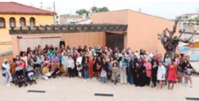
Associació de Dones El Farah-Berenar de germanor