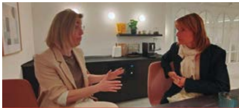
Coworking La Plaza (Rambla Rafael Casanova, 39)