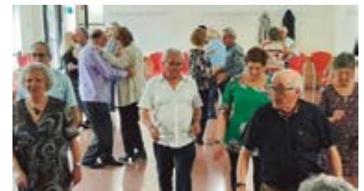
Associació Gent Gran de Marianao