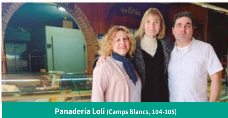
Panadería Loli (Camps Blancs, 104-105)

Continuen les visites de l'alcaldeessa al comerç de proximitat en reconeixement a la seva tasca.