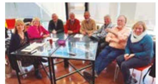
AV Can Paulet