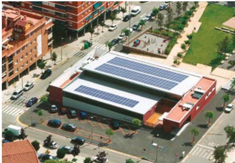
A la coberta s'instal·laran plaques solars per al consum de l'equipament

En aquest sentit, es posaran llums LED i s'instal·laran sistemes domòtics per controlar a distància de la climatització, l'enllumenat, el consum d'electricitat o