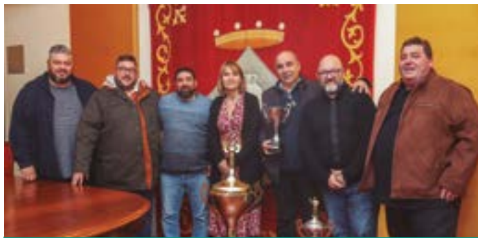
Club Dardos Goyos. Recepció