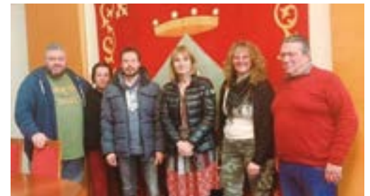
AV Camps Blancs