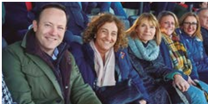
UE Santboiana. Rugbi internacional femení