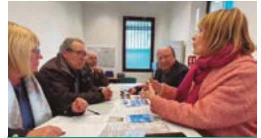
AV Parc de Marianao