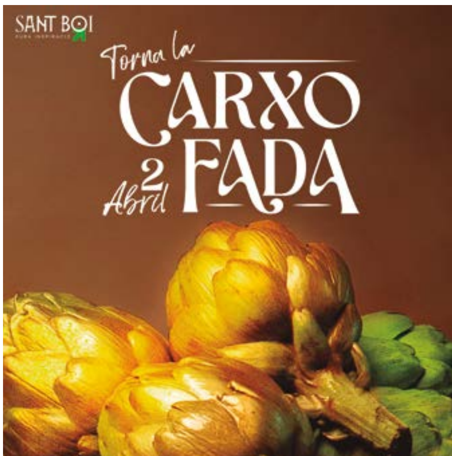
El fotògraf santboià Jordi Laguna és l'autor del cartell de la Carxofada

Aquest 2023 la Carxofada presenta un dia replet d'activitats. Al matí trobarem la trobada de puntaires, així com diversos tallers i showcookings relacionats amb la carxofa. També podrem fer-nos amb autèntiques