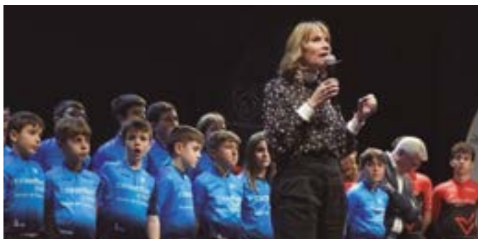
Club Ciclista Sant Boi. Presentació d'equips