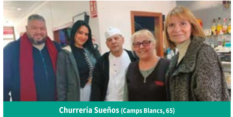
Churrería Sueños (Camps Blancs, 65)