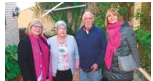
AV Els Canons

Trobades amb associacions veïnals i altres entitats