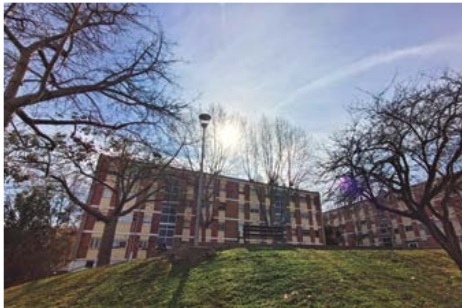
Les comunitats que s'han aollit a la subvenció estalviaran com a mitjana un 20% del consum. Els edificis milloraran la seva etiqueta energètica

Per poder demanar les subvencions, la UE exigia com a requisit la constitució formal de comunitats de