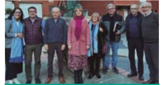
AV Can Carreras