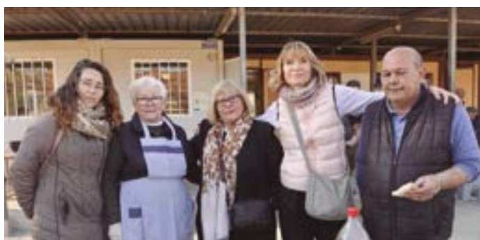
Petanca Peña Ronda 85. Esmorzar