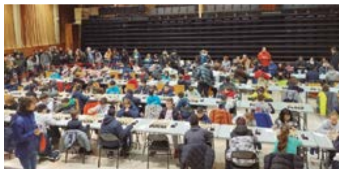
Campionat Escacs Escolars Baix Llobregat