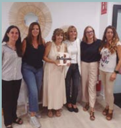
Bellagama-Perruqueria i Bellesa (C/ Lleida, 12 local 2)