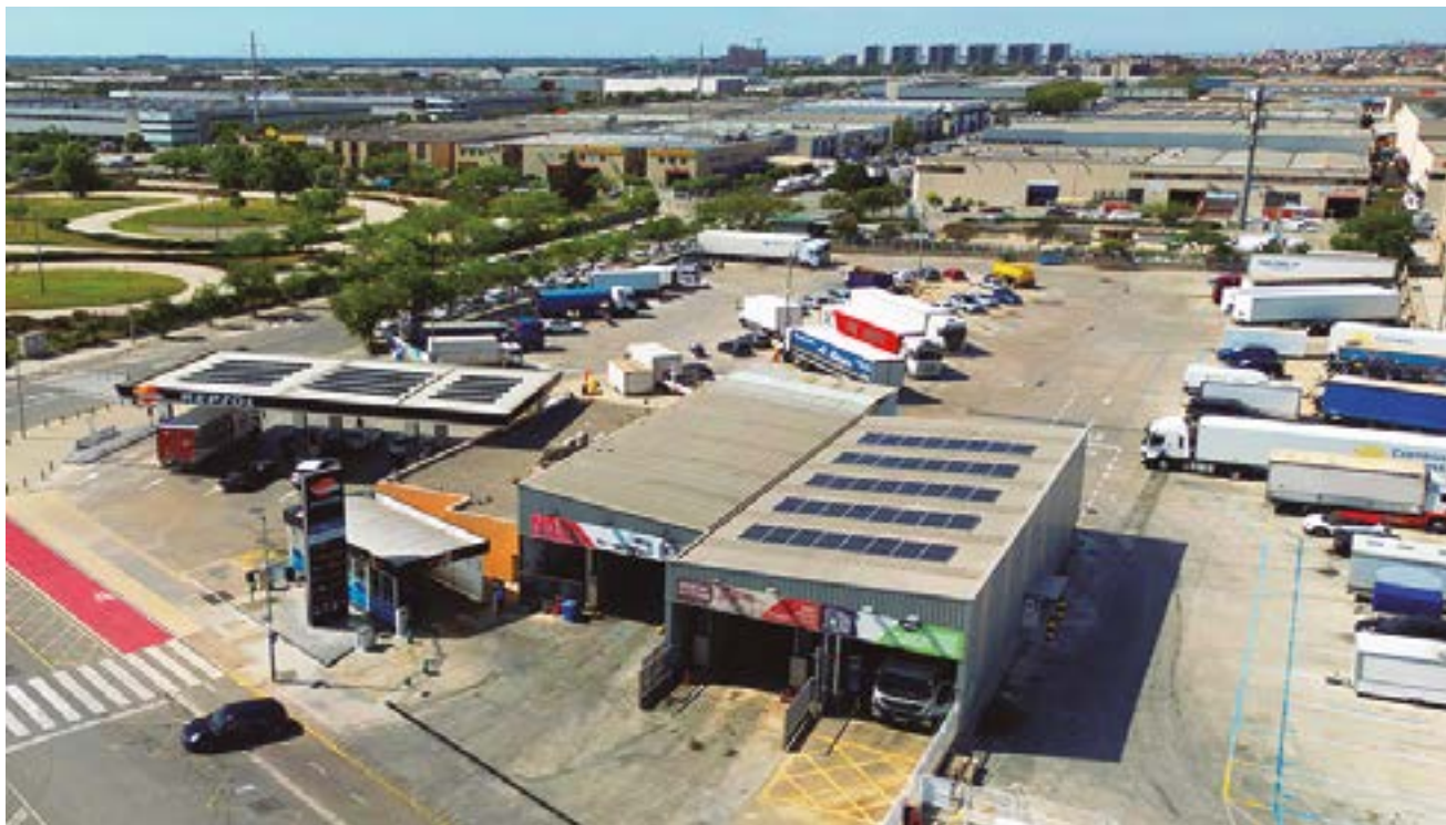
L'Ecoàrea de Serveis de Can Calderon aposta per la transició energètica