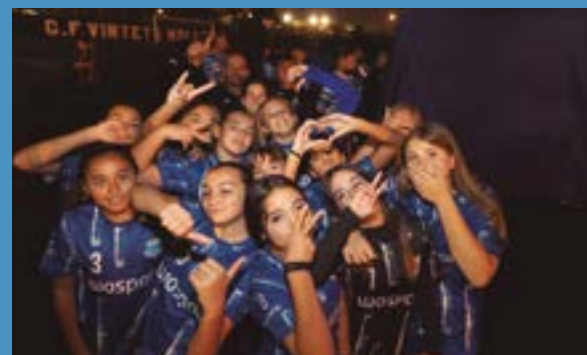
CF Vinyets i Molí Vell -Presentació d'equips