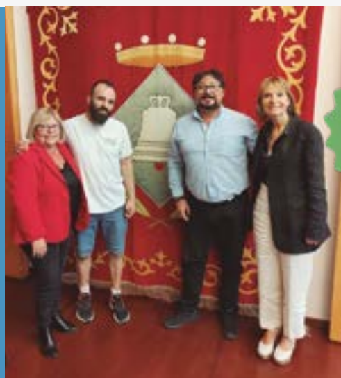
Penya Bètica -Junta directiva