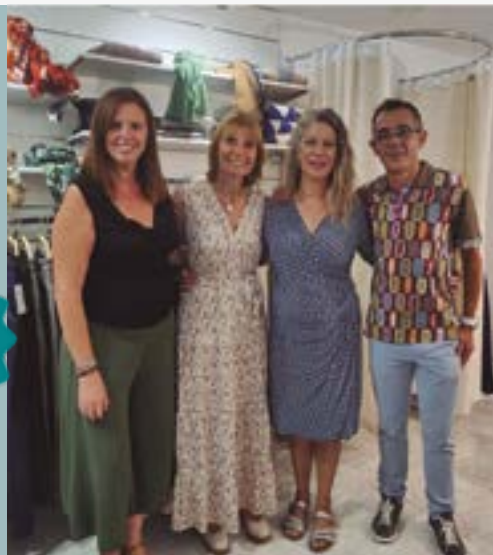
Moda Be Happy Sant Boi (C/ Francesc Macià, 57)