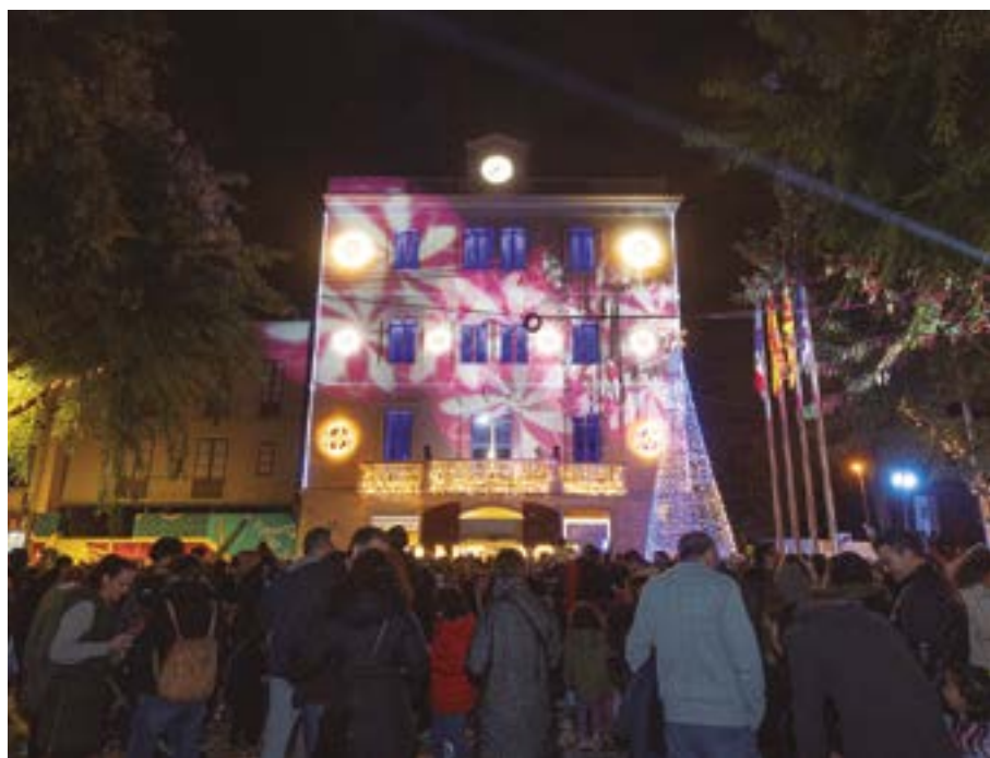
Un espectacle de llums a la plaça de l'Ajuntament i l'encesa dels fanalets a la plaça de la Generalitat donaran la benvinguda a les festes nadalenques

L'1 de desembre els carrers de Sant Boi s'il·luminaran per donar un any més la benvinguda a la màgia i la il·lusió de les festes nadalenques. Un espectacle de llums a la plaça de l'Ajuntament, a les 18.30 h, serà el punt de partida de les celebracions. Després, a les 19.30 h, també està prevista l'encesa dels fanalets de la plaça de la Generalitat, a càrrec de les vuit escoles de Maria-nao participants en la seva decoració. La data d'encesa es torna a retardar una setmana respecte a l'habitual amb l'objectiu d'estalviar energia.