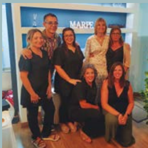
Centre d'Estètica Marpe (C/ Lluís Pascual Roca, 61)