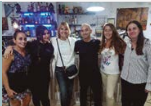
Bar Nou Primavera (C/ Lleida, 12 local 4)