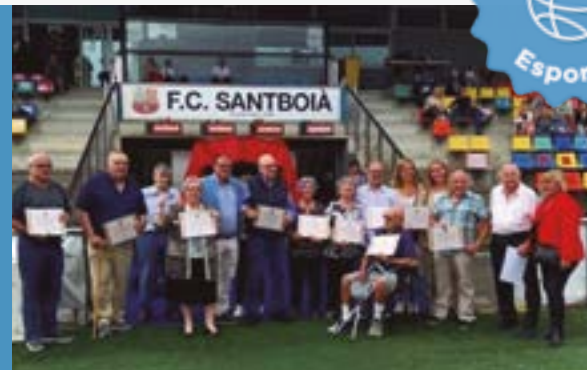
FC Santboià -Homenatge a primers socis i presidents