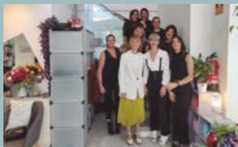
Arienes Perruqueries (C/ Girona, 21)