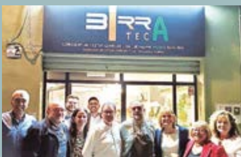
Birra i Teca (C/ Major, 3)