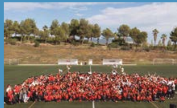
FC Santboià -Presentació d'equips