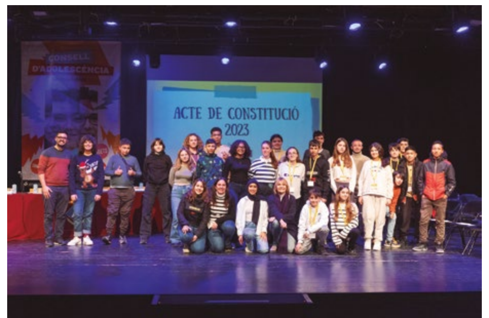
29 nois i noies plantejaran a la ciutadania reflexions i debats sobre els interessos i les inquietuds de la població adolescent de Sant Boi

El CLA es reuneix un cop al mes, en sessions dinamitzades per personal tècnic de l'Ajuntament i de l'entitat Circula Cultura.