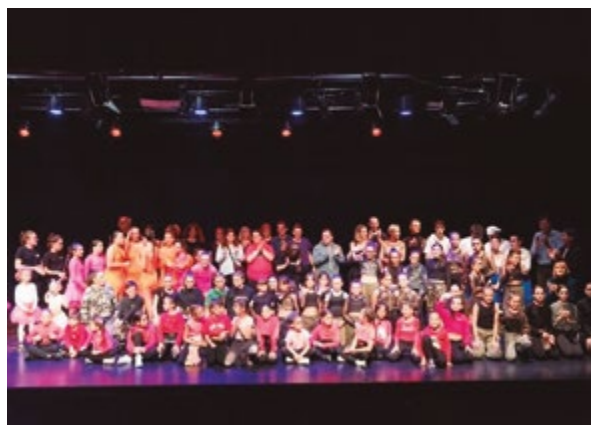
Escola de ball Fipball

Gran èxit dels dos Festivals d'Hivern que han tingut lloc aquest mes a la ciutat. L'Escola de Ball Fipball i l'AAVV Vinyets Molí Vell van omplir Can Massallera amb les diferents coreografies que havien preparat els grups de ball. Dansa de totes les edats per a totes les edats!