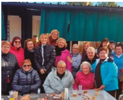
Club de Petanca de Ciutat Cooperativa Molí Nou

El Club de petanca de Ciutat Cooperativa Molí Nou i el Club de petanca de la Gent Gran de Marianao van organitzar durant les festes nadalzenques els seus tradicionals Mele de Nadal.