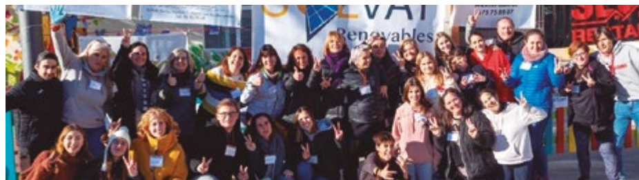
Salesians Sant Boi

Des del mes de desembre, entitats, associacions i centres educatius han estat organitzant activitats per recollir fons per La Marató.