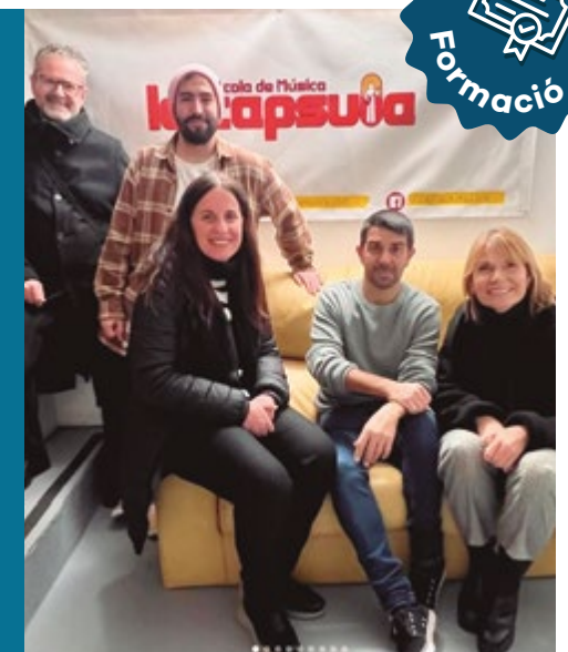
La Càpsula (C/de Josep Torras i Bages, 9)