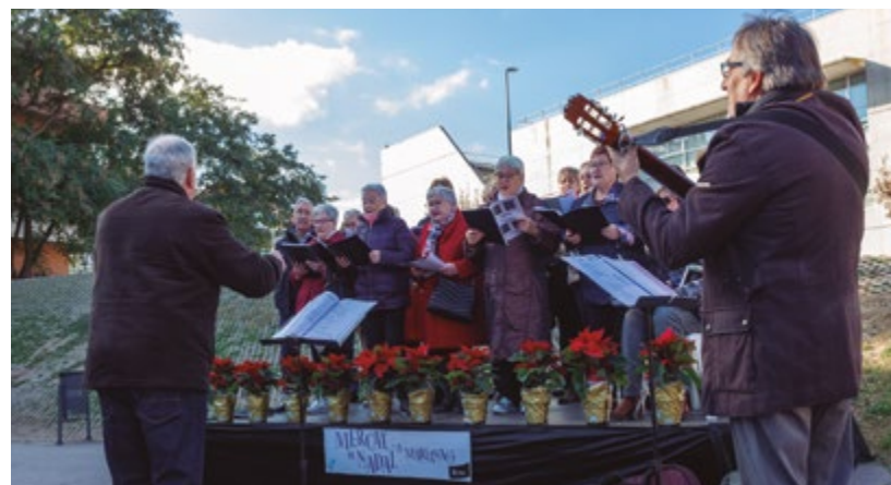
Mercat de Nadal - Pl. Teresa Valls i Diví