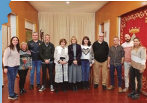
Junta Directiva del Club de Bàsquet Sant Boi