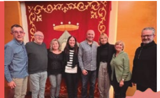
Junta Directiva Sant Boi Ball