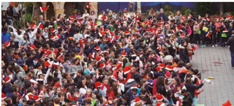
Cantada de Nadales Escoles - Pl. Ajuntament