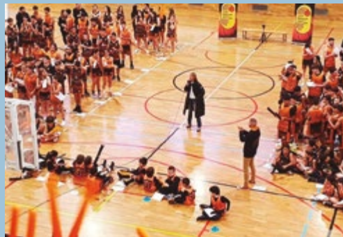
Presentació equips del Club de Bàsquet Sant Boi