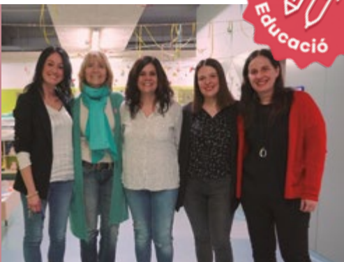
Visita Escola Vicente Ferrer