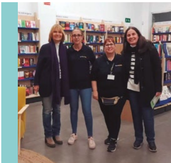
Abacus Sant Boi (C/de la Indústria, 16)