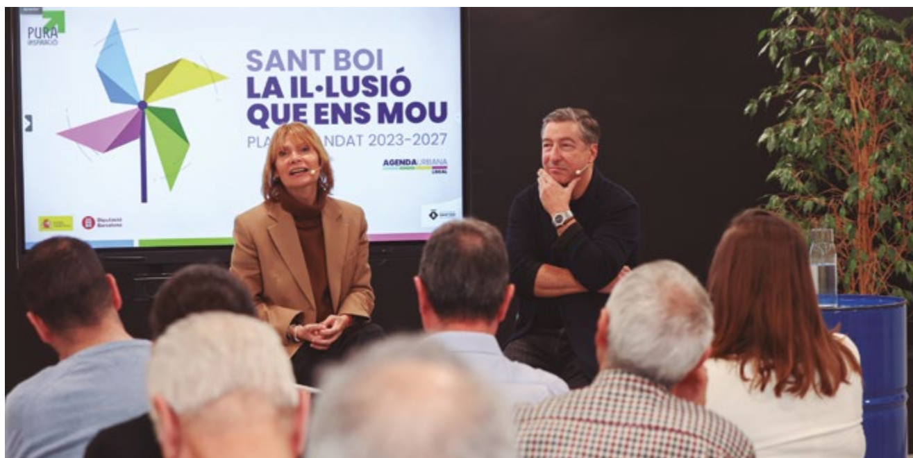
El xef català Joan Roca va ser el convidat especial a la jornada participativa 'Sant Boi, la il·lusió que ens mou'

Ara, l'Ajuntament treballa per integrar les conclusions de la jornada en el Pla de Mandat, que el govern municipal té la intenció d'aprovar a finals d'aquest mes de febrer. Aquest document estratègic, que guiarà les