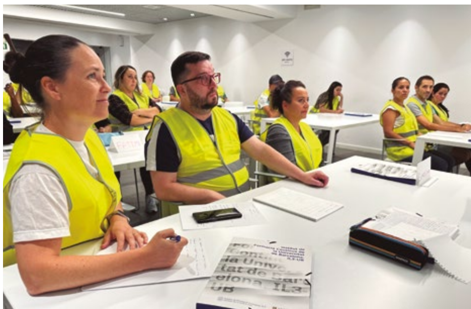
Alumnes de la primera edició del projecte 'Logistics training in motion', impulsat per l'Ajuntament de Sant Boi, Prologis i la Universitat de Barcelona

L'Ajuntament, la multinacional Prologis i la Universitat de Barcelona (UB) han obert la convocatòria per inscriure's en una nova formació en l'àmbit de la logística. Després de l'èxit de la primera edició de "Logistics training in motion", aquest cop s'ofereix la possibilitat d'una doble titulació.