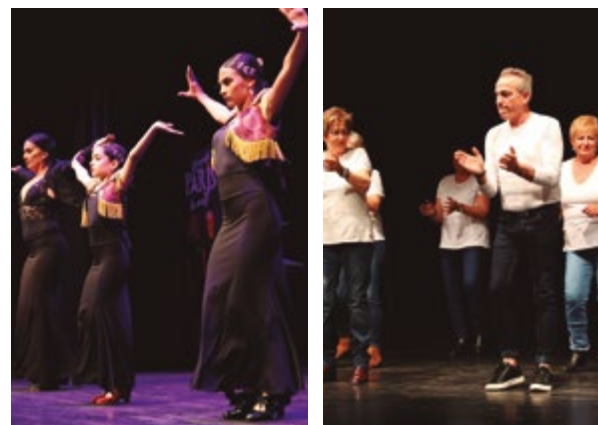
AAVV Vinyets i Molí Vell