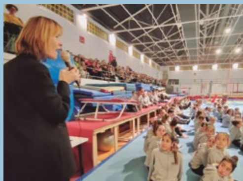
Presentació equips Club Gimnastic Sant Boi