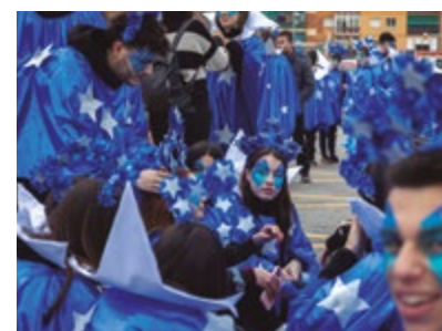
Cavalcada de Reis