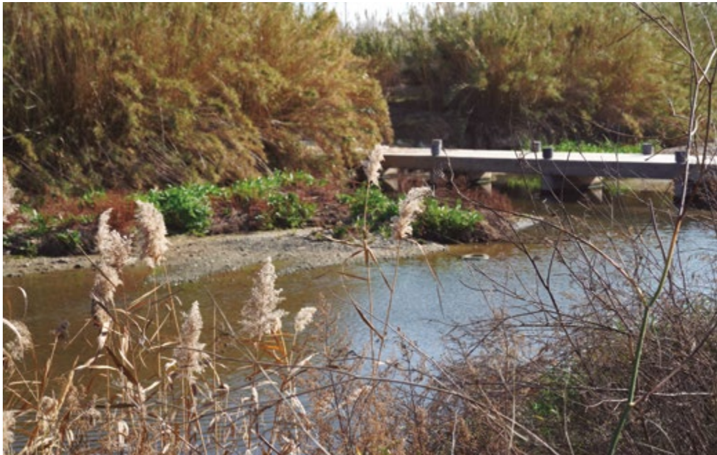
La declaració de la Generalitat afecta el sistema hidrològic Ter-Llobregat