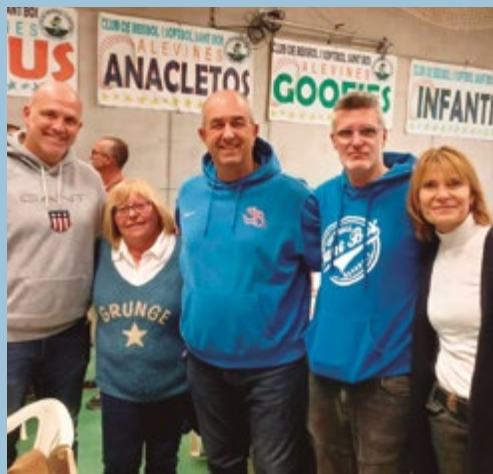
Club de Beisbol i Softbol Sant Boi Sopar fi de temporada