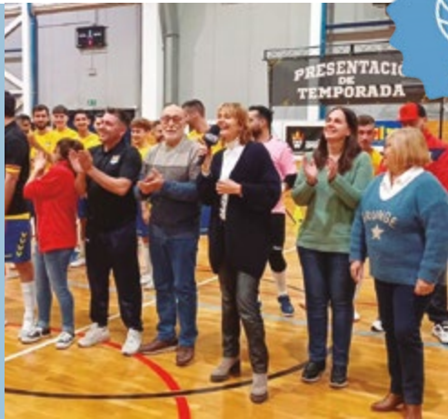
Presentació equips CFS Sant Boi