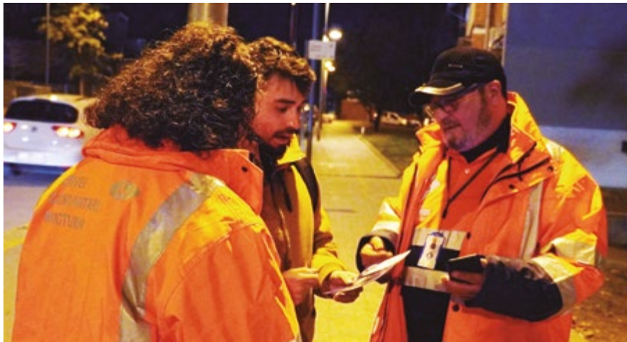
L'equip del Servei Comunitari Nocturn en una de les seves sortides informant sobre l'aplicació de Seguretat Ciutadana M7

Sant Boi ha posat en marxa el Servei Comunitari Nocturn. Durant un any, vuit persones contractades per l'Ajuntament mitjançant un pla d'ocupació faran a les nits tasques de prevenció, informació i acompanyament per atendre necessitats de la ciutadania, detectar incidències a l'espai públic i reforçar la seguretat. Les persones encarregades d'aquest servei són tres dones i cinc homes que es desplacen pels barris del municipi.