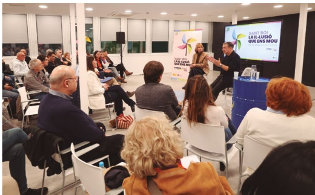
L'Ajuntament convida tothom a sumar-se a la construcció col·lectiva del futur de Sant Boi

polítiques municipals dels pròxims anys, prendrà com a referència els quatre eixos de l'Agenda Urbana Local: Reactivació social; Territori, model de ciutat i prosperitat; Ciutat sostenible, saludable, resilient i segura, i Digitalització i governança.