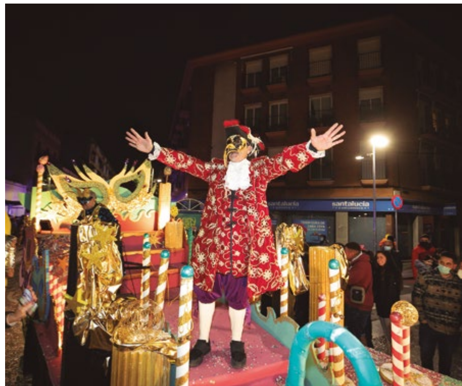
El Rei Carnestoltes tornarà a passejar-se pels carrers de Sant Boi per veure tota la ciutat disfressada

En aquest moment, enfilaran la recta final de la rua pel carrer de Pablo Picasso i el carrer de Girona que portarà a la cercavila a la plaça de Teresa Valls i Diví on es farà el gran final de festa.