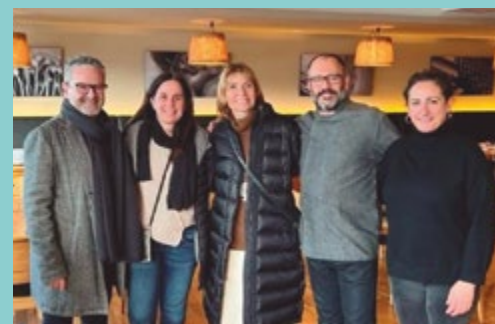
Restaurant La Marimorena (Ctra. de la Santa Creu de Calafell, 73)