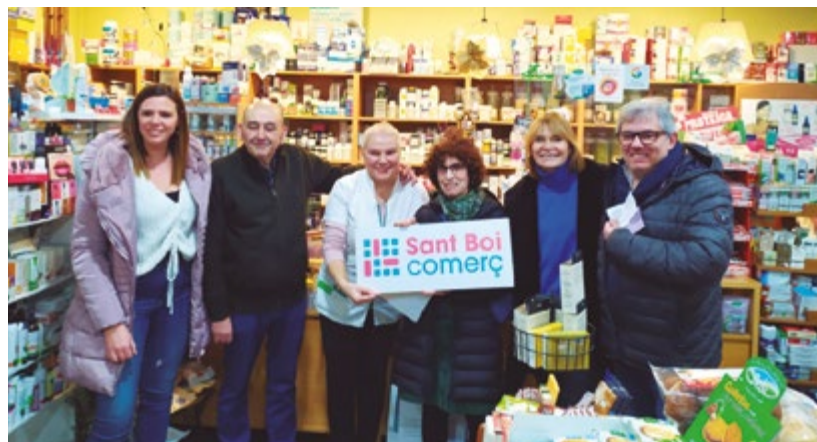
Sorteig Sant Boi Comerç 4.000€