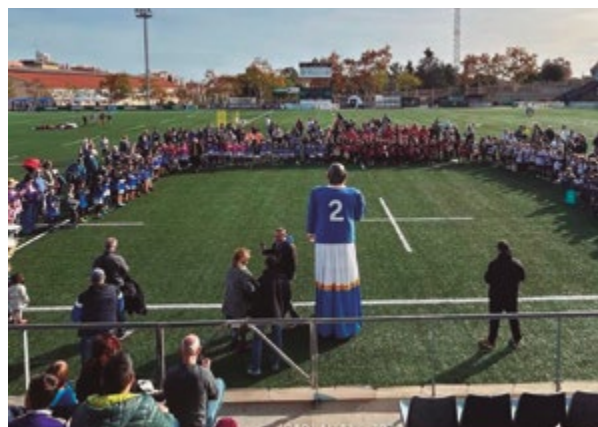
Rugbi a Sant Boi

Un total de set escoles de joves rugbistes de tot l'Estat van participar al Torneig Melé organitzat per la Unió Esportiva Santboiana.