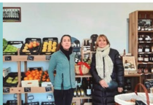
Agrobotiga de la Cooperativa Agrària Santboiana (Camí Les Salines)