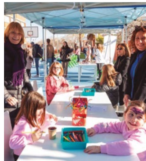
Col·legi Sant Josep