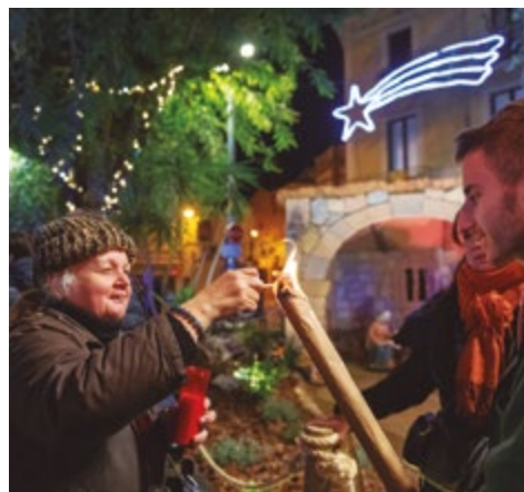
Flama de la Pau