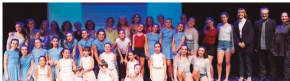
L'Estudi Dansa mostra de dansa