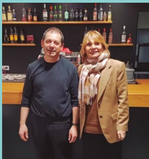
Bar-Restaurant "La Rotonda". (Ctra. de la Santa Creu de Calafell, 33)