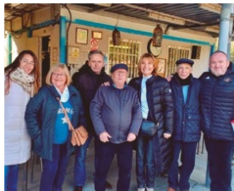
Club de Petanca de la Gent Gran de Marianao