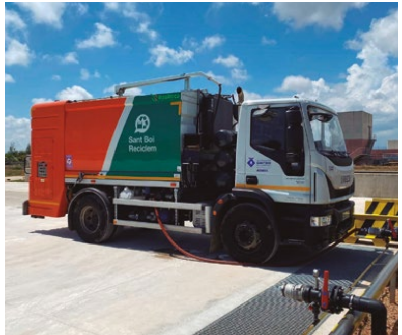
Recollida d'aigua regenerada a la depuradora del Prat