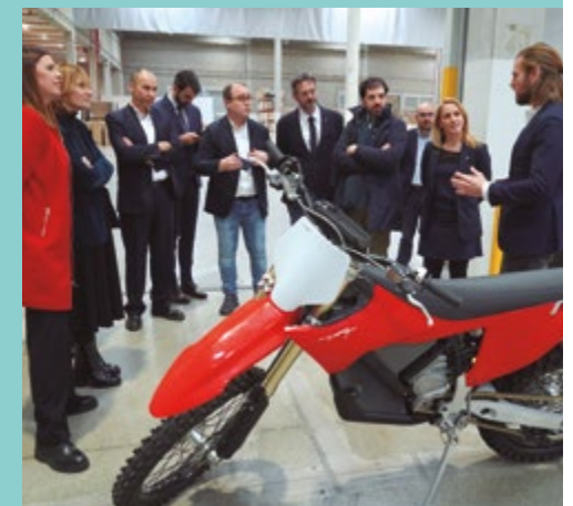
Stark Future (C/ Batan, 6)