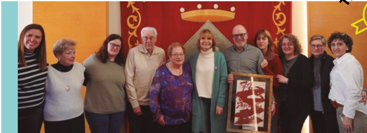
Joieria Sancho. C/Francesc Macià, 6. Un dels negocis històrics i referents a la ciutat celebra 100 anys de venda des de la proximitat i l'estima de la ciutat i el veïnat. Un negoci familiar que generació rere generació ha sabut adaptar-se i reinventar-se per continuar oferint a la nostra ciutat el millor servei