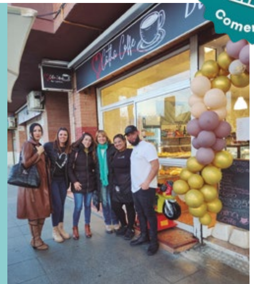
Catha Coffee Inauguració (C/Eusebi Güell, 1)