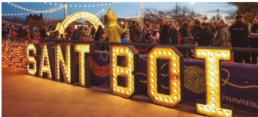
Campament Reial - Parc de La Muntanyeta