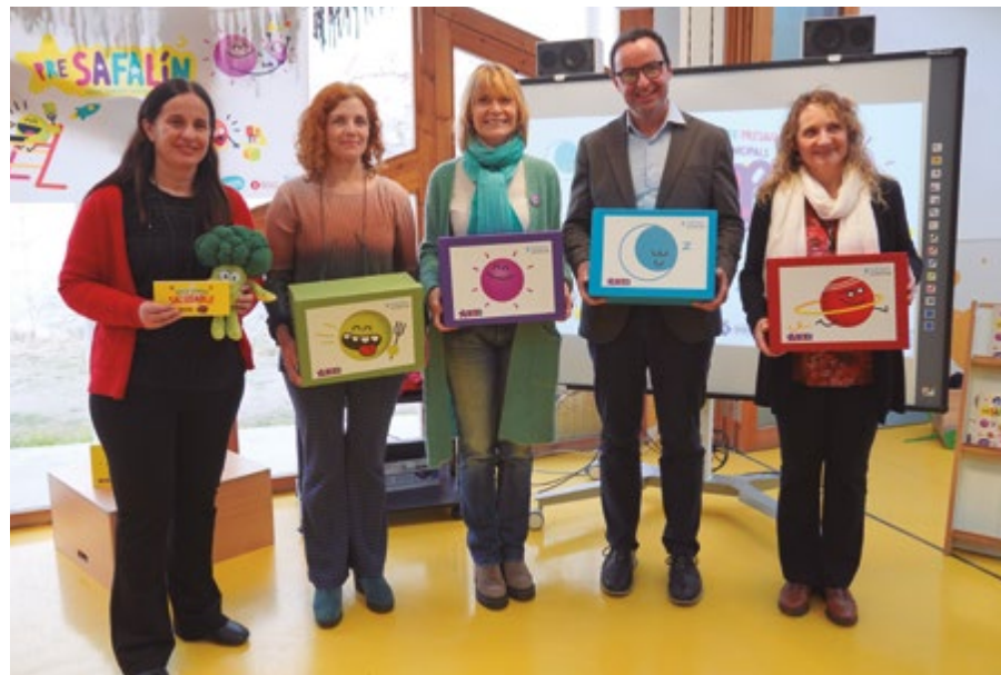
El projecte Presafalín treballa hàbits saludables com l'activitat física i l'esport, l'alimentació saludable, el descans i el benestar emocional

Hi participen els municipis de Pineda de Mar, Mollet del Vallès, Igual-