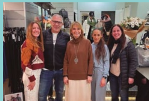
Xamfrà (C/ Lluís Pascual Roca, 2)