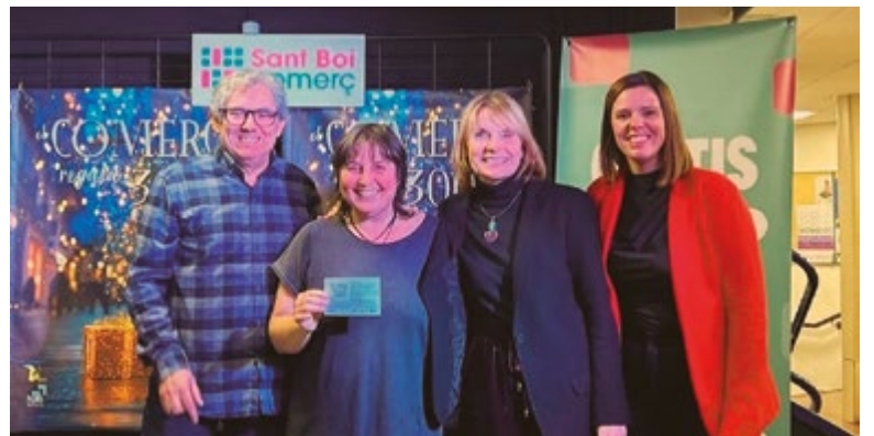
Sorteig: el comerç regala 3.000€!

Totes les fotografies a: bit.ly/fotosSB25