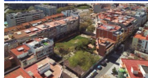
MÉS I MILLORS ESPAIS VERDS

■ La meitat de les despeses es destinen a polítiques per atendre les necessitats de les persones en les diferents etapes de la seva vida