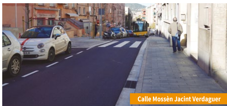
Calle Mossèn Jacint Verdaguer