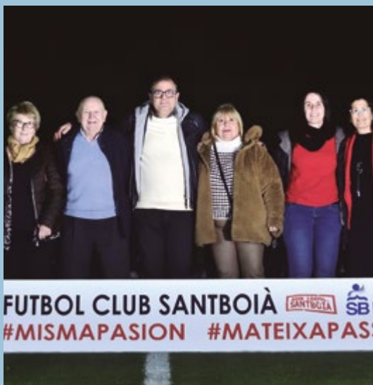
FC Santboià Presentació equips