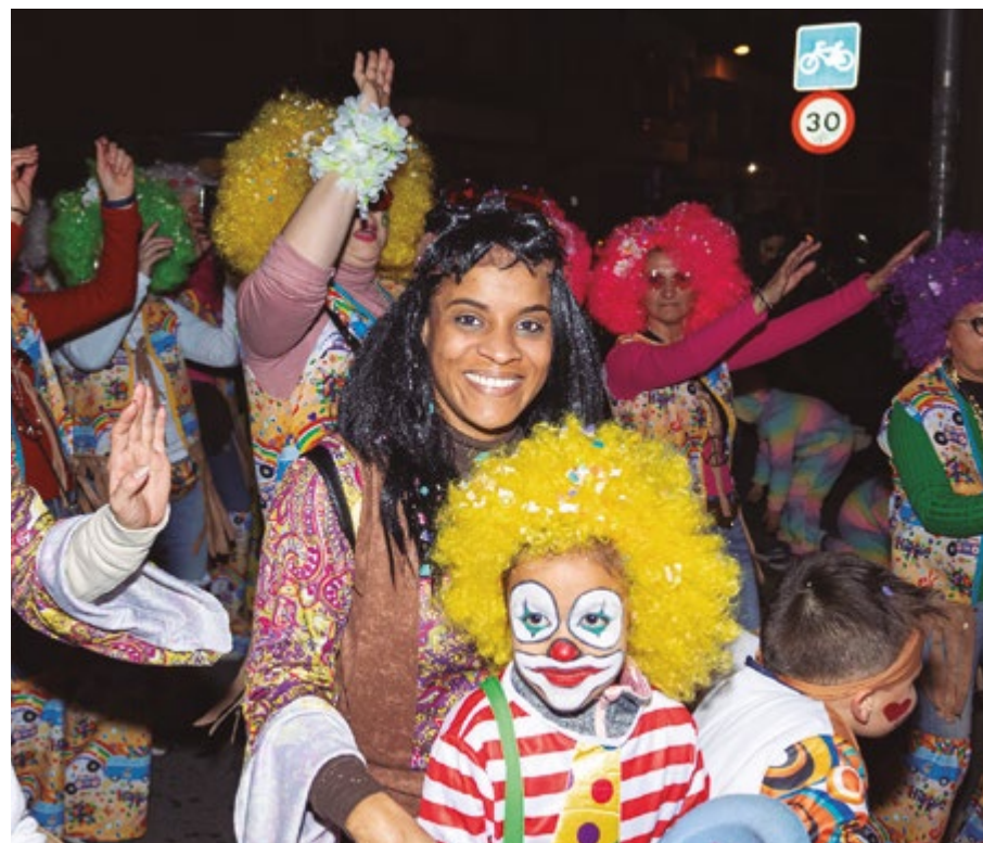
El Rei Carnestoltes tornarà a passejar-se pels carrers de Sant Boi per veure tota la ciutat disfressada acompanyat per les millors comparses