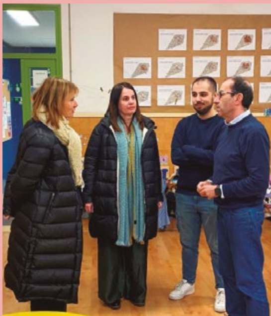
Col·legi Santo Tomás