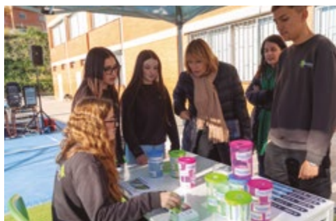
Col·legi Sant Josep