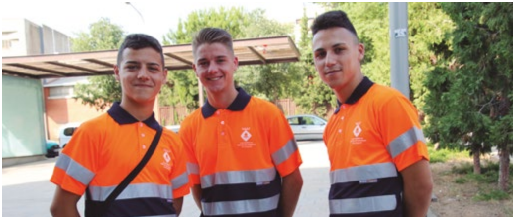
Participants en una edició anterior d'aquest programa ocupacional