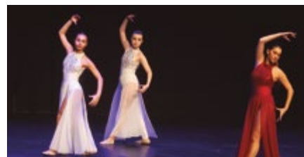
Acadèmia de ball Susy