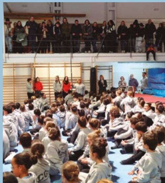
Club Gimnàstic Sant Boi Presentació de temporada