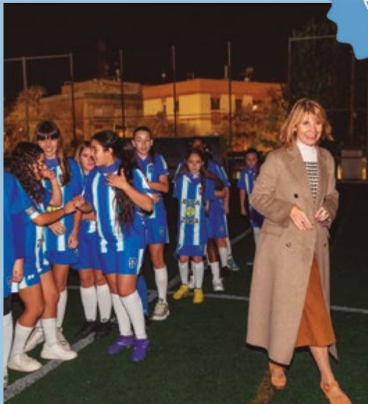
FC Casablanca Presentació equips