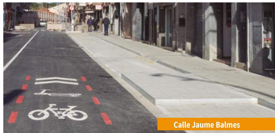
Calle Jaume Balmes

En el caso de Mn. Jacint Verdaguer, la circulación se reabrió durante el mes de diciembre. Tras la reapertura al tráfico, las obras continúan ejecutándose en la calle de Santiago Ramon y Cajal y en el eje perpendicular peatonal que conecta con los 'pisos de la Muntanyeta. Según las previsiones, terminarán en el mes de marzo. Durante estos meses se ha terminado con la instalación del nuevo alumbrado, aceras, barandillas y alcantarillado. El conjunto de las obras permite una mayor accesibilidad y conexión con el entorno y en especial para llegar a pie a las paradas de autobús. El conjunto de las obras se ha financiado con un presupuesto de 2,08 millones de euros, financiados en un 90% con fondos europeos Next Generation.