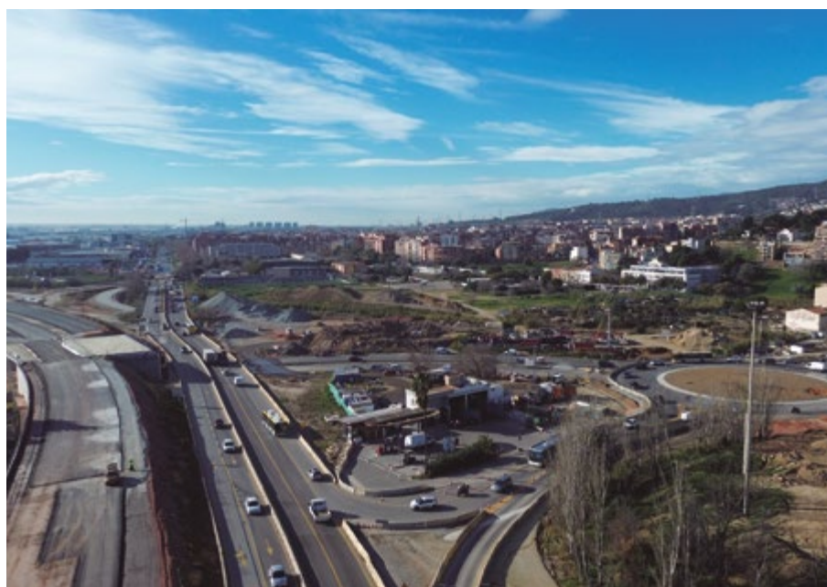
Vista aérea de la zona. A izquierda nuevos trazados, a derecha nueva rotonda

También se ha puesto en servicio parcialmente una nueva rotonda que será un elemento importante para las conexiones con la futura autovía.