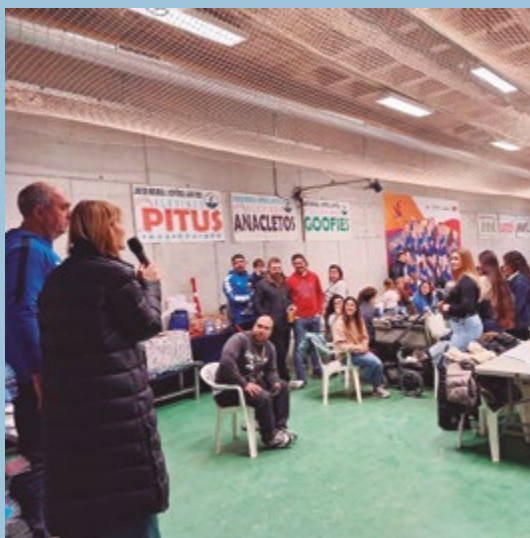
Club Beisbol Softbol Sant Boi Entrega de trofeus