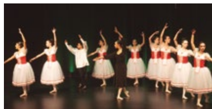
Loida Grau Dance School

Exhibició de dansa i ball a Can Massallera a càrrec de les escoles santboianes especialitzades.