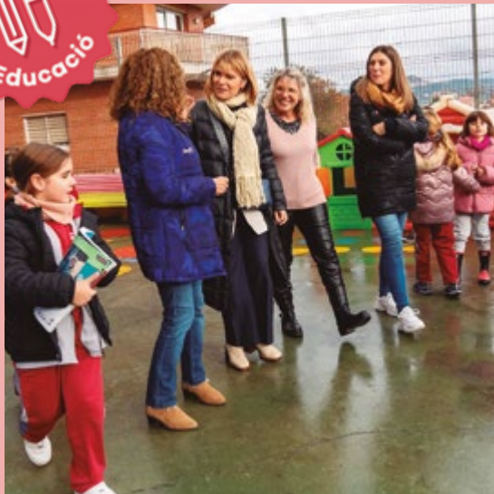
Escola Molí Nou