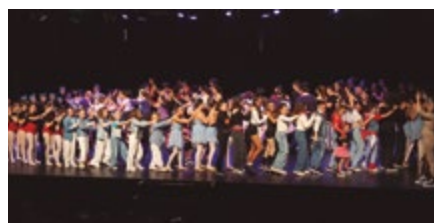
Play Dance Center