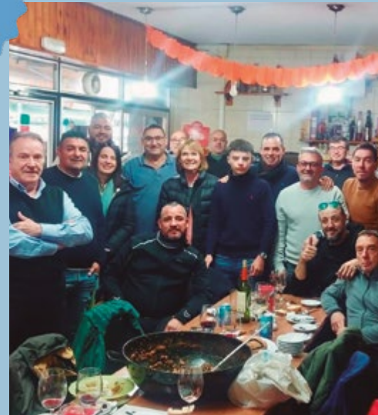
Club ciclista Casablanca