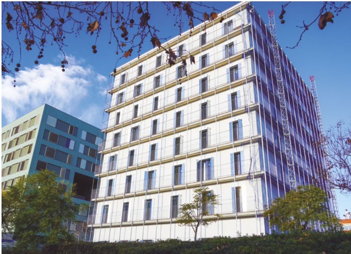
En este edificio del Saló Central se construyen viviendas de alquiler protegido. La promoción se convocará este mismo año