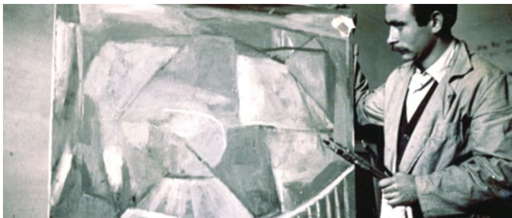
Miquel Rué va portar a territoris molt suggerents la pintura abstracta de la postguerra

Museu de Sant Boi: fins al 23 de març Preu: 2 € (entrada reduïda: 1 €)