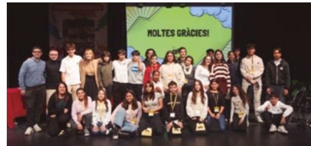
Consell Local d'Adolescència