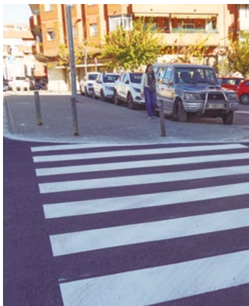
RENOVACIÓ DE L'ESPAI PÚBLIC