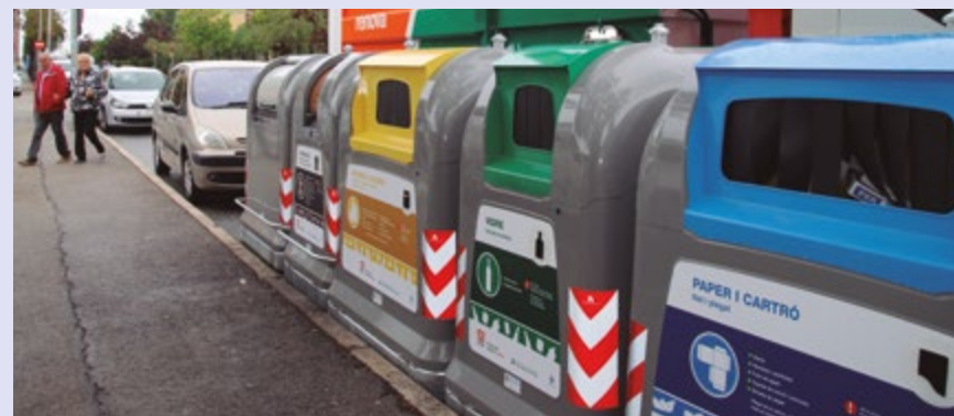
La taxa garantirà millores en els serveis vinculats a la recollida de residus