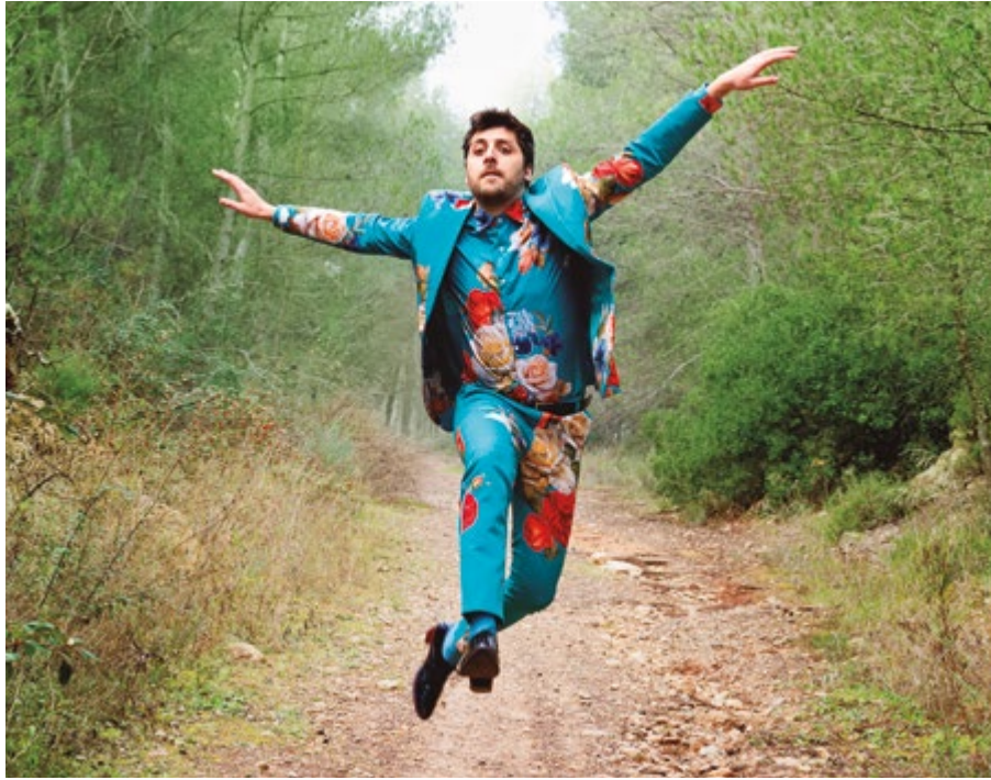
Cartell de 'Els Ocells', l'obra de Cia La Calòrica que està inclosa a la programació de 'A Escena'

Al març torna el festival teatral de Sant Boi, torna 'A Escena'. Durant tot aquest mes podrem gaudir d'una gran varietat d'espectacles, trobarem comèdia, dramatúrgia, històries d'amor, però també espectacles infantils i microteatre.