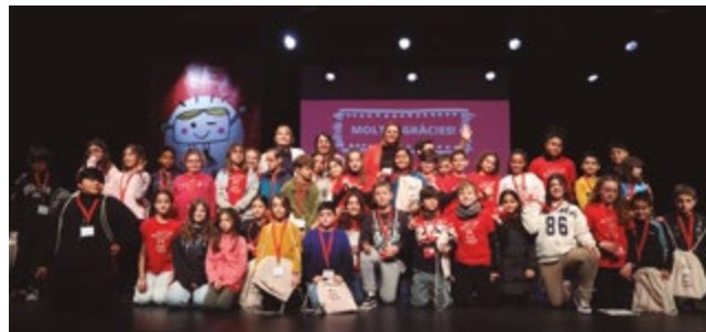
Consell Local d'Infància

El Consell Local d'Infància i el Consell Local d'Adolescència de Sant Boi s'han renovat. Es tracta de dos òrgans de participació ciutadana formats per infants i adolescents respectivament, que s'han escollit com a portaveus dels seus centres educatius i entitats de lleure de la ciutat/del municipi i que durant un període de temps determinat, afronten reptes de la ciutat. Incloure la visió i la implicació d'aquests col·lectius és fonamental.