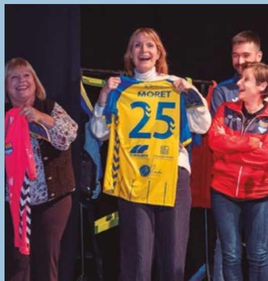
Club de futbol Sala Sant Boi 25 anys fent esport i valors