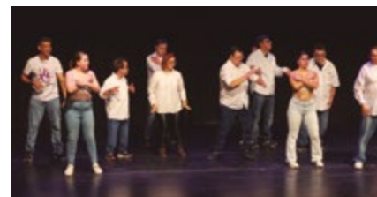
Escola de Dansa Luisa Fernando