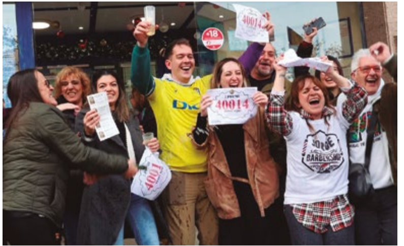
El segon Premi de Loteria de Nadal toca a Sant Boi!