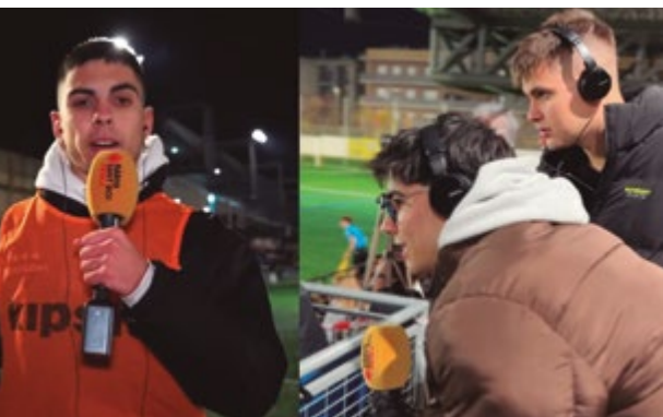
L'emissora municipal ja va retransmetre el 'derbi' al desembre

L'emissora municipal Ràdio Sant Boi ha posat en antena el programa 'Sant Boi en joc', que els caps de setmana segueix en directe els partits a casa del CF Ciutat Cooperativa (dissabtes a les 17.45 h) i el FC Santboià (diumenges a les 11.45 h). Els dos equips comparteixen categoria aquesta temporada a Primera Catalana. Puntualment, també s'oferiran partits fora de casa.