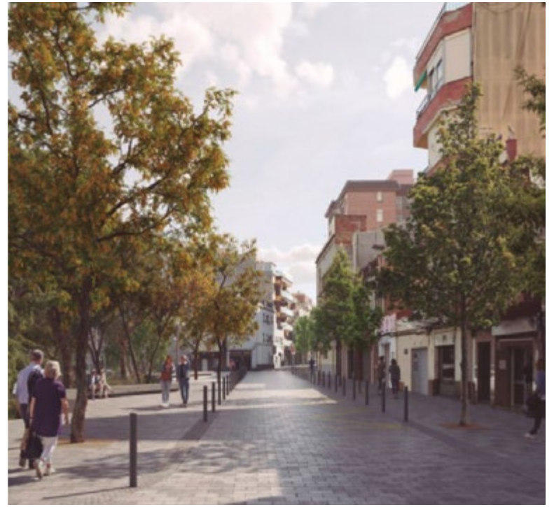
El carrer Llibertat serà més accessible i més agradable per caminar