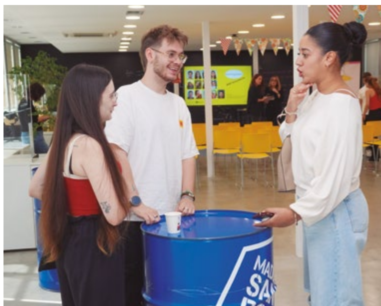
SERVEIS PER A LES PERSONES