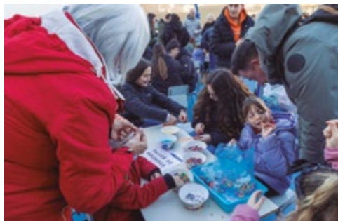
Col·legi Joan Bardina

Diverses organitzacions i entitats de la nostra ciutat han continuat organitzant actes per recaptar fons amb finalitats solidàries per La Marató.