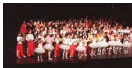
Baobabs Escola de Dansa