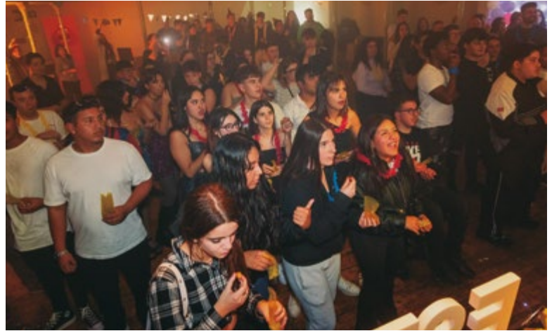
Festa jove pre-cap d'any