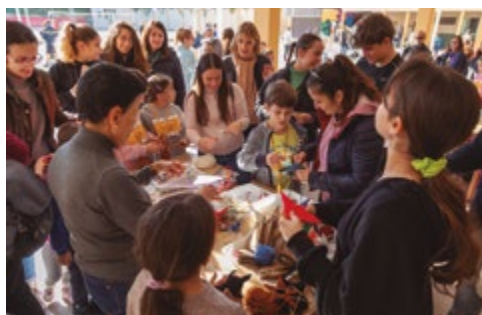
Col·legi Salesians Sant Boi