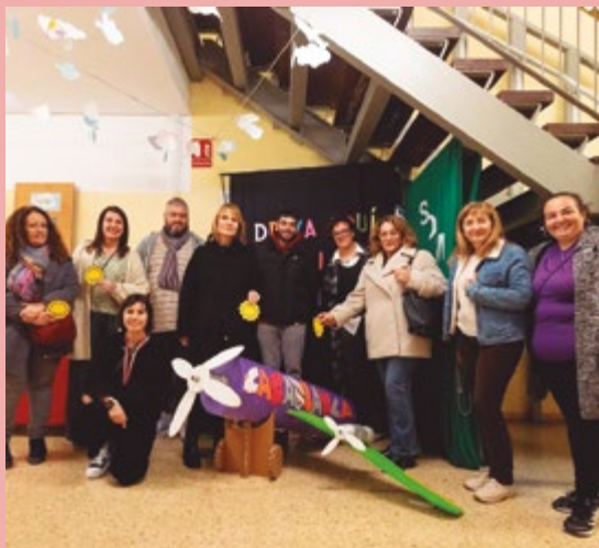
Escola Casablanca 50è aniversari