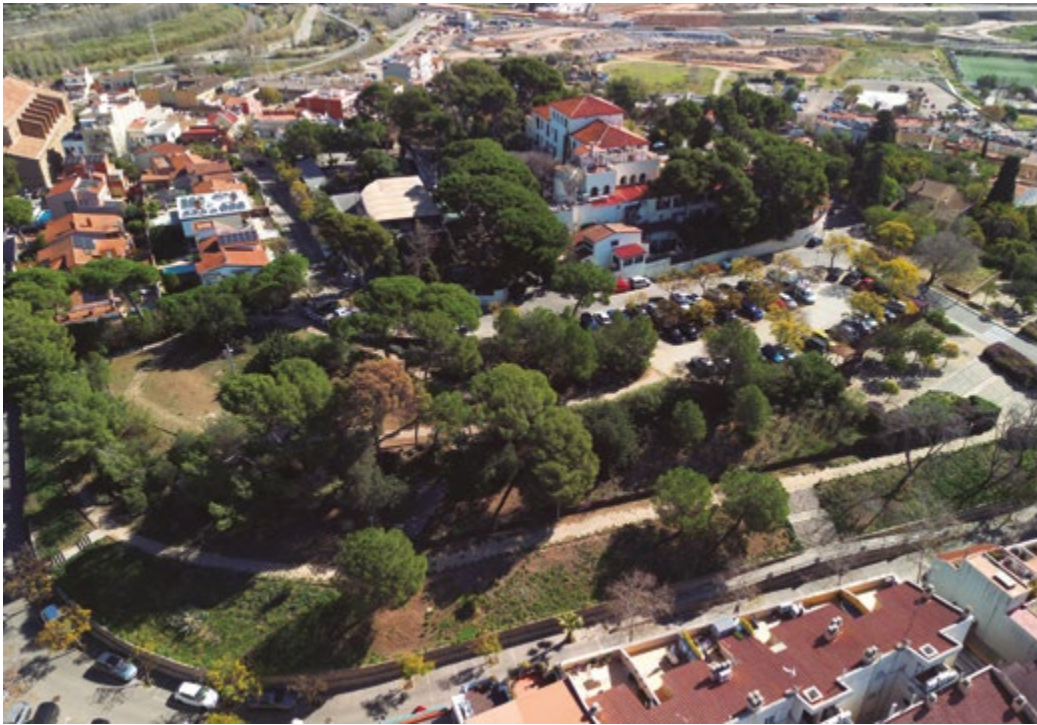
Enguany es duran a termes les actuacions del projecte Sant Boi Respira més Verd