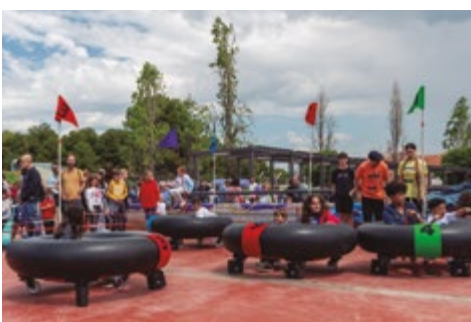
Fira del Joc i l'Aventura