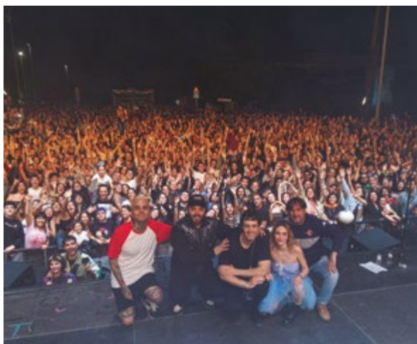
Concert La La Love you