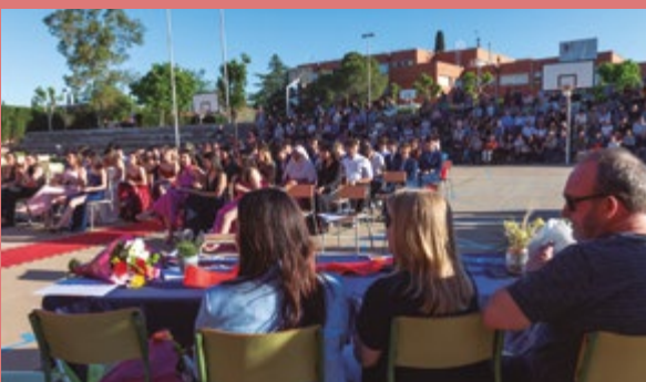
Graduació Rafael Casanova 2n Batxillerat