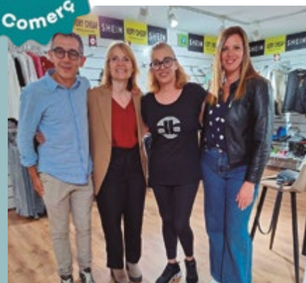
Very Cheap-Shein, Carrer Francesc Macià, 78