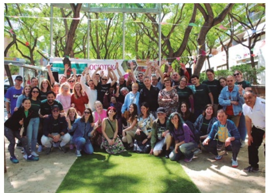
Trabajadoras y trabajadores de Prologis compartieron la fiesta de celebración con integrantes de la Ocioteka, familias, entidades sociales y comercios de Marianao

La Ocioteka es uno de los servicios que la Fundació Cassià Just-Cuina Justa ofrece a sus trabajadores y trabajadoras. Actúa como estructura de apoyo social y desarrolla actividades de socialización, vinculación con el entorno y participación en la vida de la comunidad. El 70% de quienes trabajan en la fundación son personas con discapacidad. La entidad lleva más de 30 años ofreciendo oportunidades laborales en el ámbito de la gastronomía a personas con enfermedad mental o problemas de exclusión social.