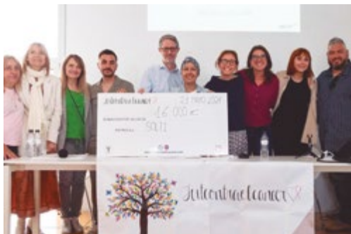
Donació de 16.000€ a Solti

L'associació continua ben activa i compromesa en la recerca solidària de fons per contribuir a la recerca contra el càncer. Durant aquest mes ha tingut lloc l'entrega d'un total de 16 mil euros per part de l'associació al grup d'investigació, Solti, i també la Ruta Motera, per recollir més fons.