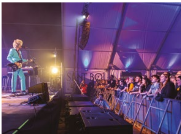
Concert Los Zigarros