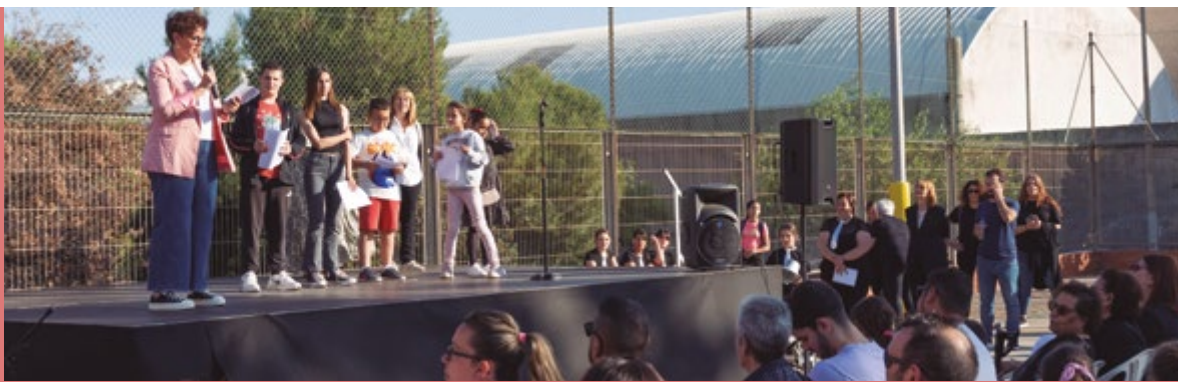
50è aniversari Escola Casablanca