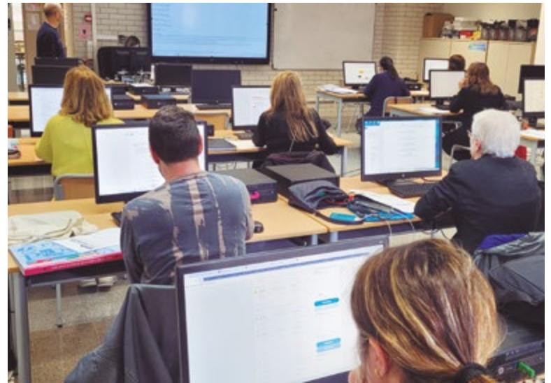
Alumnes durant una classe a la segona planta de L'Olivera

Unes 700 persones estudien cada any al Centre de Formació de Persones Adultes de Sant Boi. Està ubicat a la segona planta de l'edifici de L'Olivera i disposa d'una oferta flexible d'ensenyaments impartits per una dotzena de docents. Els objectius principals de la seva tasca són afavorir la incorporació de l'alumnat al mercat de treball, millorar les seves expectatives laborals i, de forma més genèrica, ajudar tothom qui assisteix a les classes a enriquir-se com a persones gràcies al coneixement.