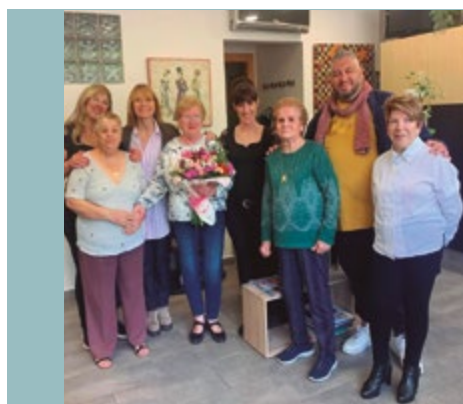
Perruquería Rosa Mari Av. General Prim, 34