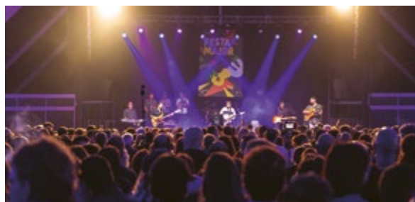
Concert Los Niños Jesús