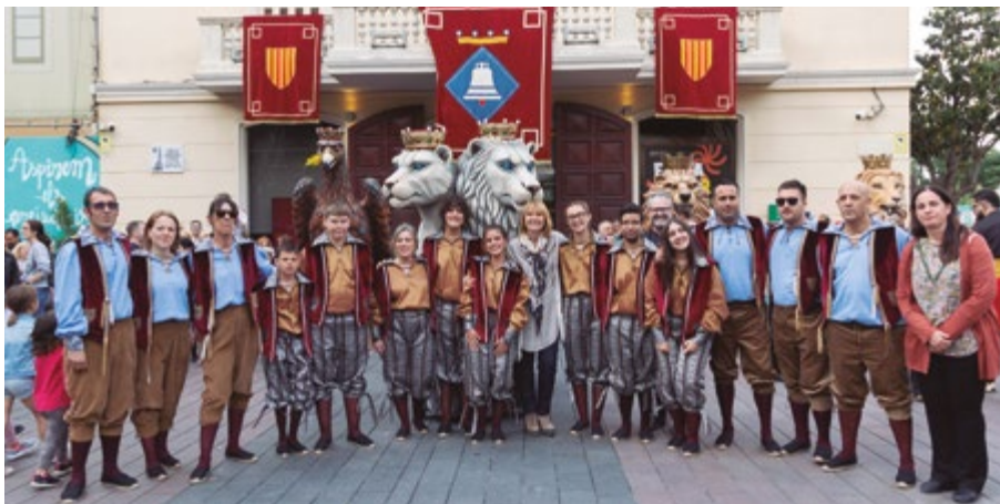
Ball de l'Àliga i presentació de Li Lleoni