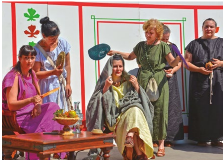
Al Sant Boi de l'època romana ja hi havia persones que tenien diferents oficis relacionats amb la cura del cos