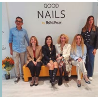
Good Nails, Carrer Tres d'Abril, 37