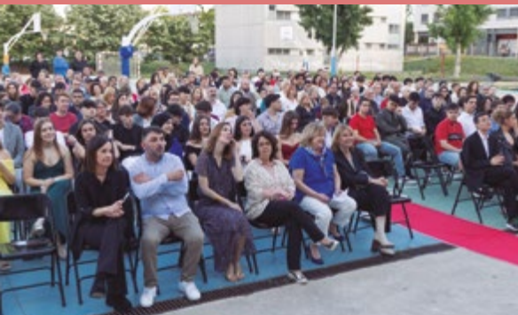
Graduació Itaca 2n Batxillerat