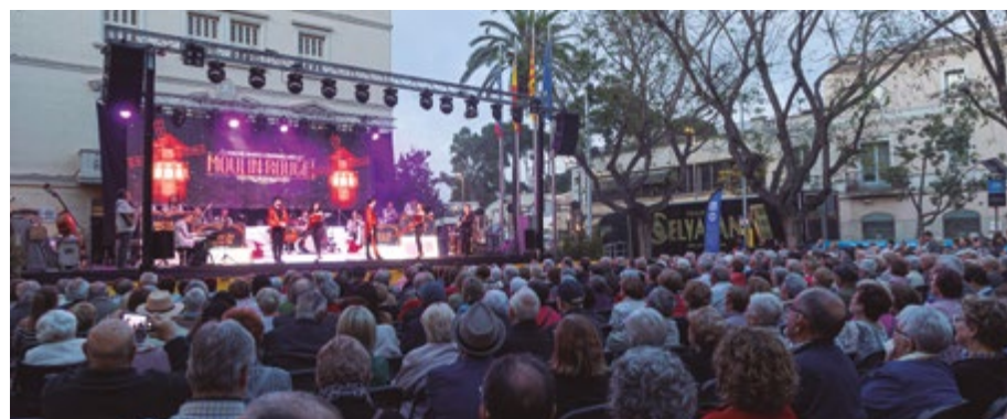
Concert Orquestra Selvatana