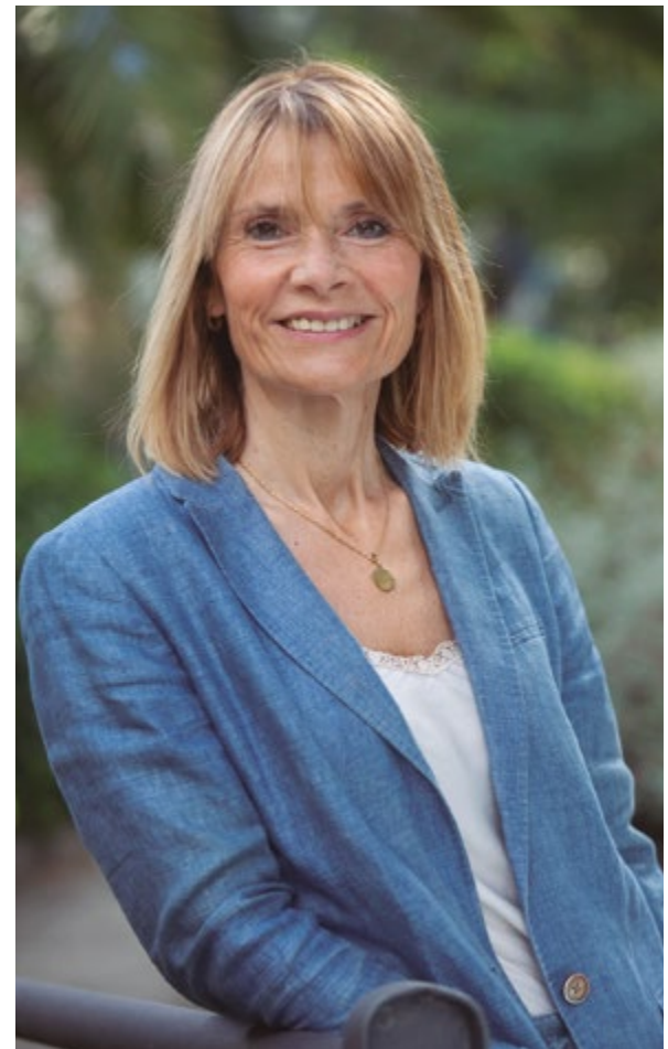
Lluïsa Moret i Sabidó, alcaldessa

Todo ello me hace reflexionar sobre lo que hemos construido con los años, siempre desde la ilusión y el esfuerzo colectivos: una ciudad abierta, solidaria, segura, respetuosa con las diferencias y orgullosa de su gente. En definitiva, una ciudad inclusiva, con el enorme valor que eso tiene hoy, cuando asistimos a derivas autoritarias en otros países y se hacen oír con fuerza voces que confrontan y niegan derechos básicos. En nuestro caso, lo tenemos claro: progreso significa sumar, significa inclusión, significa igualdad de oportunidades.