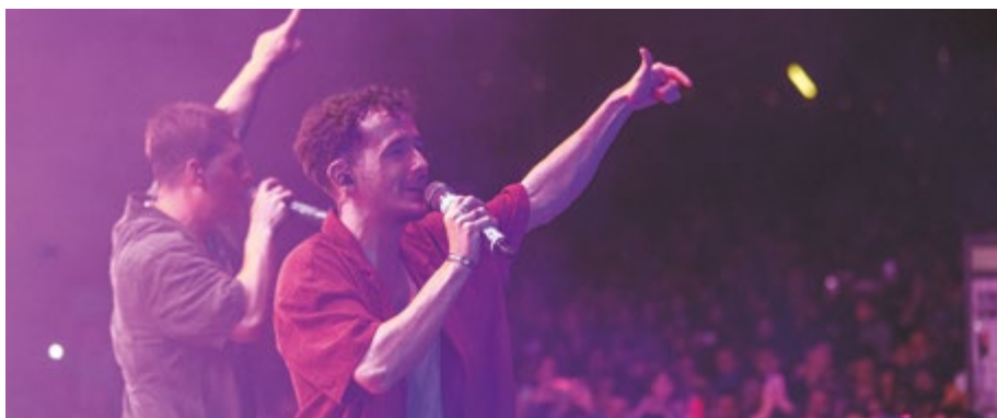
Concert The Tyets