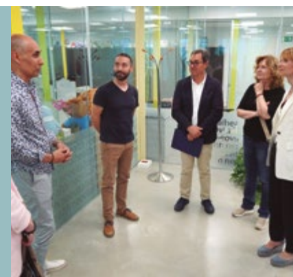
Neovital Health Carrer de la Riera Roja, 3