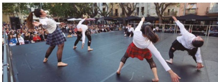
Mostra de Dansa