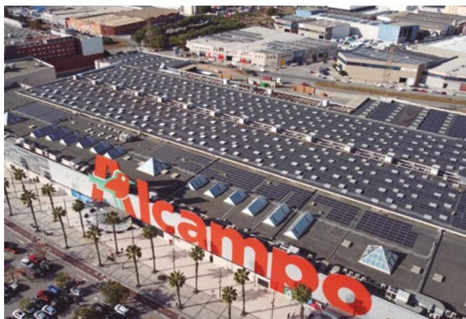
La de Sant Boi es la cuarta instalación de este tipo de Alcampo España

La multinacional tiene el objetivo de consumir su propia energía verde para reducir significativamente sus emisiones de CO 2 a la atmósfera.