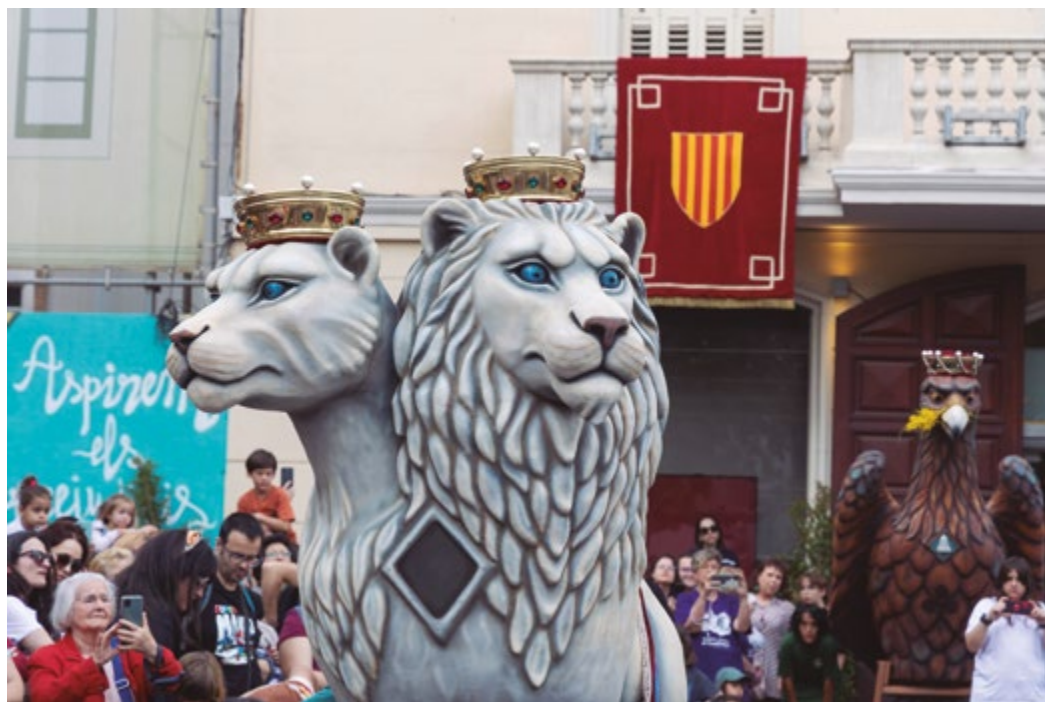
Li Lleoni és un lleó blanc de dos caps que ja forma part del protocol de la ciutat

La cultura popular és sempre un dels ingredients principals de la Festa Major de Sant Boi. A la darrera edició, s'hi va incorporar un nou protagonista. Es tracta del nou membre de la imatgeria de la ciutat: un lleó blanc de dos caps que s'ha batejat amb el nom de 'Li Lleoni'. La seva presentació oficial va tenir lloc el 19 de maig a la plaça de l'Ajuntament.