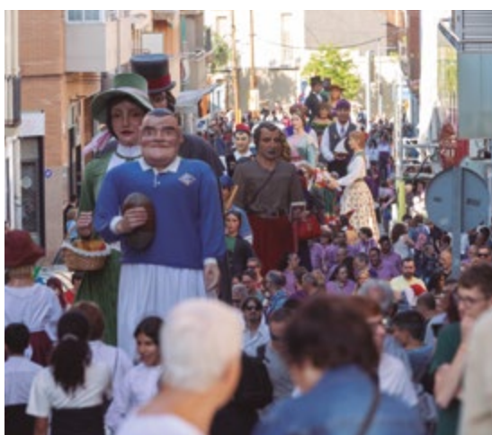
Trobada de Gegants