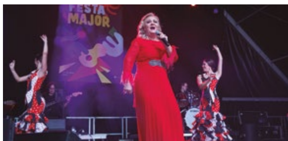
Concert Tribut a Rocío Jurado