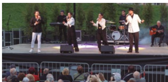
Concert Somos Sur