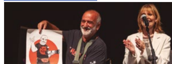
Nit Knaya: homenatge al fotògraf Antonio Benítez