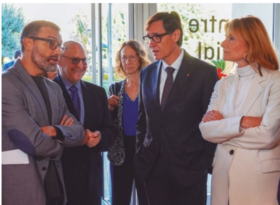
Salvador Illa va conèixer de primera mà les instal·lacions del nou Centre de Recerca i Innovació en Salut Emocional (RISE Center)