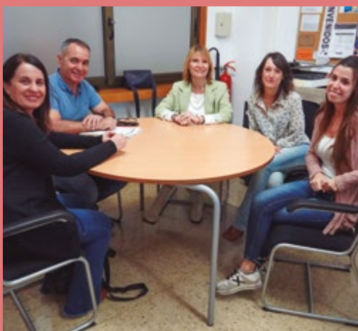
Escola Rafael Casanova