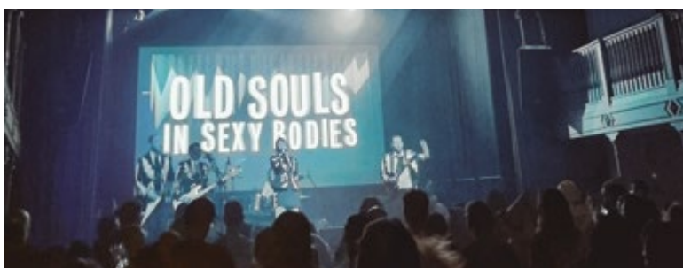
Concert de Nits d'Ànimes