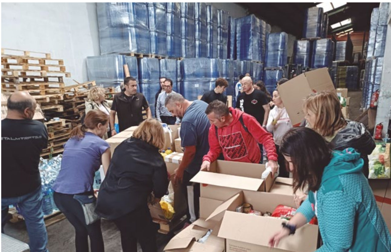
Mitjançant una recollida solidària es van omplir 300 palets amb productes de primera necessitat