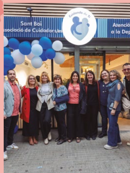
Cuidando de ti Inauguració del nou centre. C/ Jaume I, 79