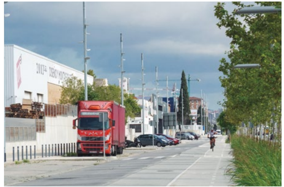
Los polígonos del municipio tienen un alto grado de ocupación de sus naves (87%)