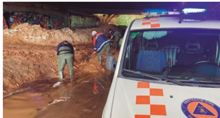
Els serveis municipals van resoldre múltiples incidències