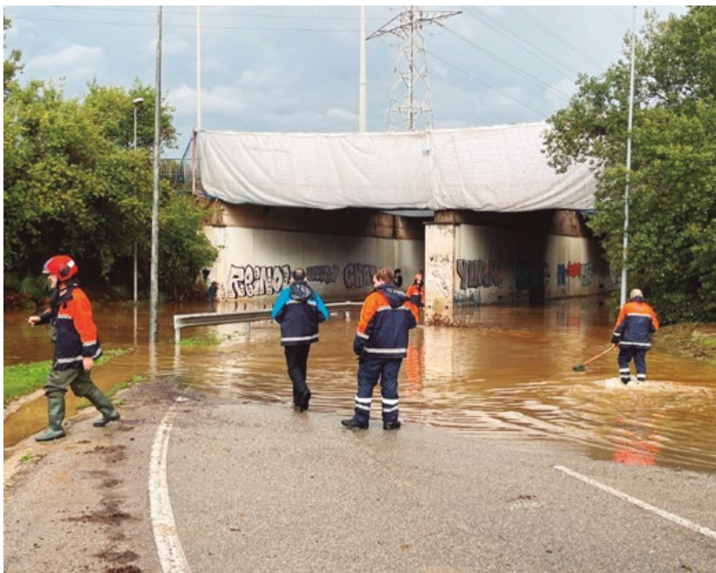
Les inundacions van obligar a tancar temporalment carreteres i accessos a la ciutat