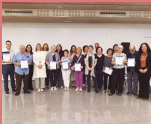
Inauguració del nou curs a la UNED