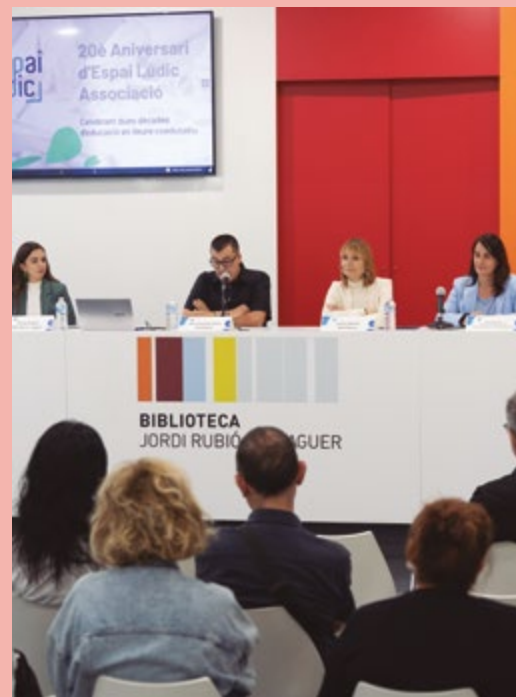
Espai Lúdic Associació Celebració del 20è aniversari