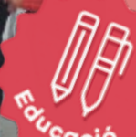
Escola Antoni Gaudí