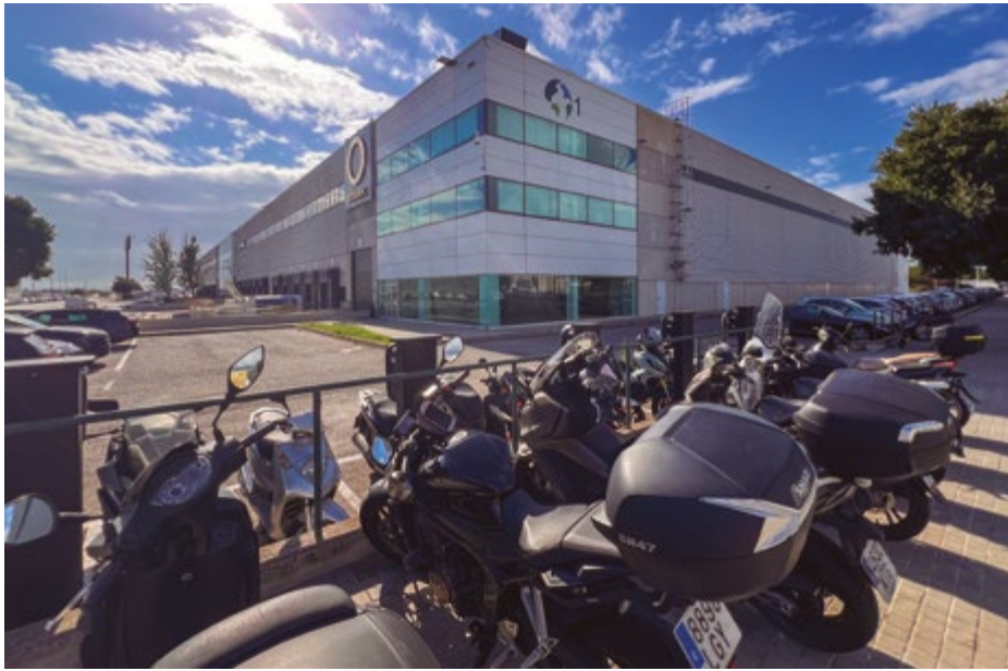
Stark Future es una empresa referente en el ámbito de la movilidad sostenible