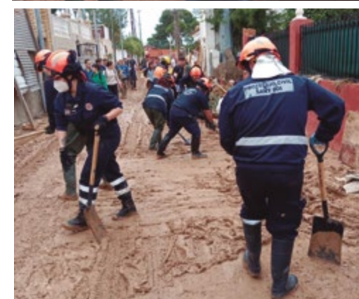
Voluntaris de Sant Boi, a València