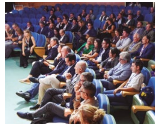
El Fòrum econòmic celebró su 22a edición