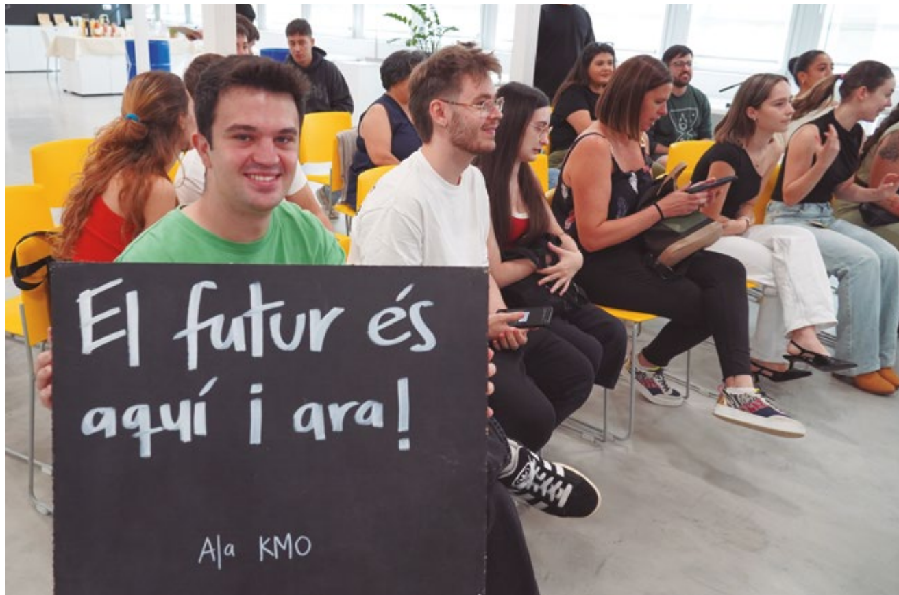
Les persones residents escollides en aquesta convocatòria van presentar els seus projectes en un acte públic

Tretze joves de Sant Boi amb esperit innovador han començat a fer créixer els seus projectes a les Residències de l'Espai BETA. A principis del mes d'octubre, l'Ajuntament va donar la benvinguda a les persones que participaran durant deu mesos en la primera convocatòria d'aquesta iniciativa experimental.