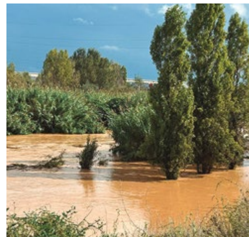
El cabal del riu va créixer durant unes hores

Els serveis municipals van treballar durant tota la jornada per restablir la normalitat. Es van fer múltiples tasques de neteja viària, retirada de fang i arbres trencats, reparació de semàfors i punts de llum avariats, entre altres ◀