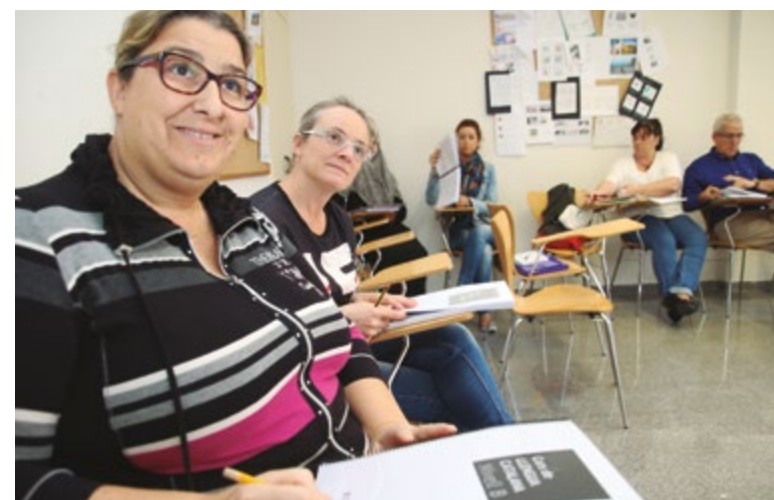
L'equipament és el punt de referència dels serveis educatius