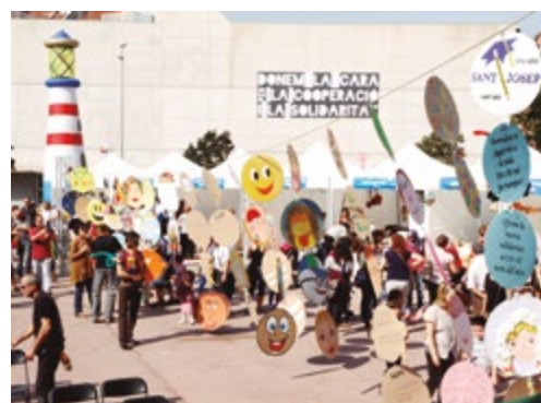
Una activitat familiar del Barrejant