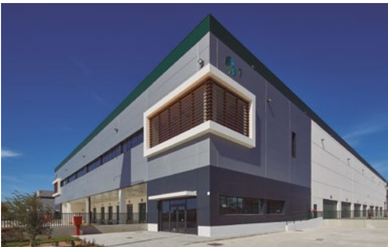
El ministre inaugurarà una nova nau al parc logístic Prologis

Aquell mateix matí, el ministre i l'alcaldesa participaran en l'acte d'inauguració de la setena nau del parc logístic Prologis a Sant Boi, que acull un centre de distribució de l'empresa CTT Express.