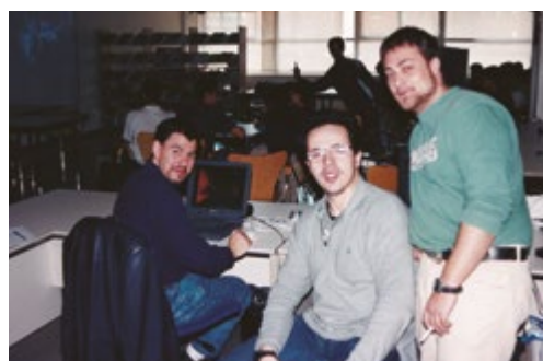
Centre de recursos per a joves