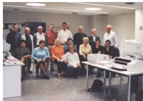
Classe d'informàtica per a la gent gran