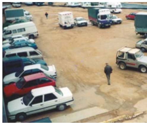
En aquest solar es va construir l'Olivera