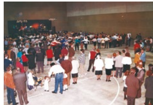
Acte d'inauguració, el febrer de 1999