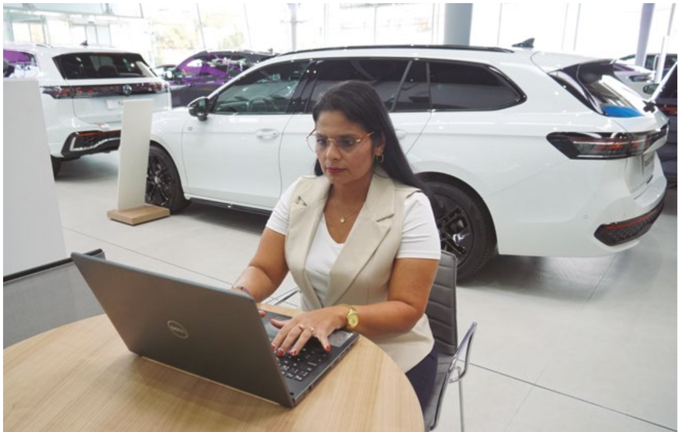
La Juliet treballa en un concessionari d'automòbils de Sant Boi, on va començar gràcies al programa 30+