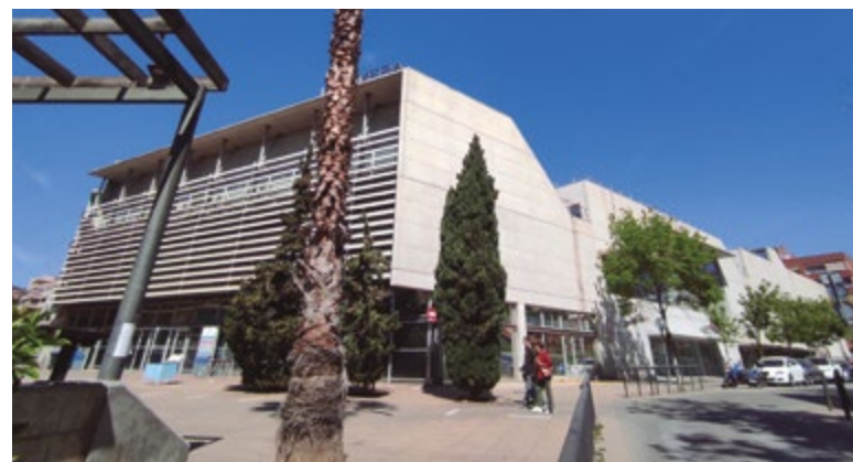
L'Olivera ofereix serveis al barri de Marianao i al conjunt de la ciutat