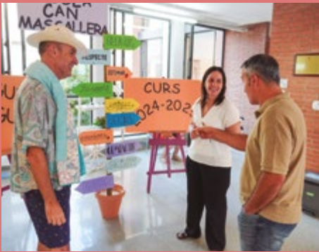
Escola Can Massallera