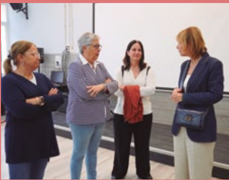
Escola Joan Bardina