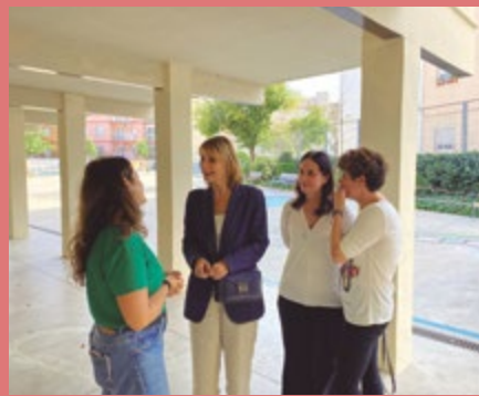
Escola Ciutat Cooperativa