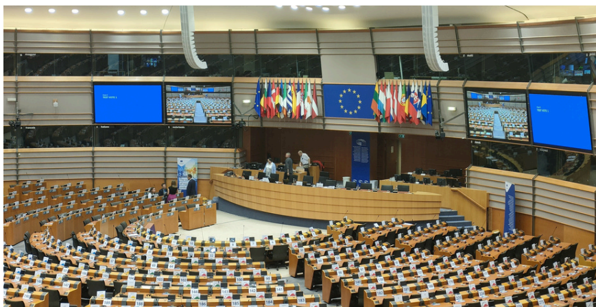
Visita al Parlament Europeu, octubre 2024

Els dies 8 i 9 d'octubre de 2024, es van organitzar unes jornades de treball a Brussel·les coordinades per la Diputació de Barcelona, amb la participació dels membres de la xarxa BELC de la província de Barcelona en el marc de la Setmana Europea de les Regions i les Ciutats . Durant aquestes jornades, els participants van realitzar visites al Comitè Europeu de les Regions, al Parlament Europeu i a l'Oficina de Brussel·les de la Diputació de Barcelona.