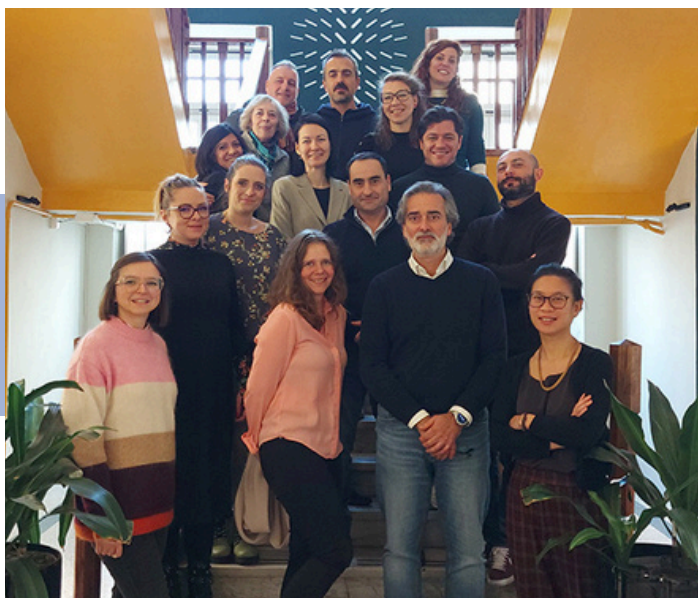
Visita a Torí de l'equip internacional del projecte 2Nite, novembre 2024

El projecte promou la col·laboració amb agents locals i la creació de serveis nocturns per revitalitzar espais públics i millorar la percepció de seguretat.