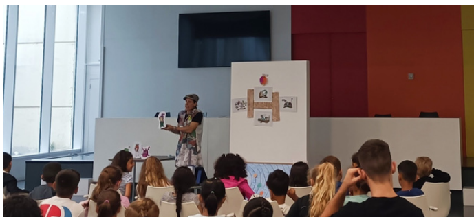
Dinamització del conte Kalòpsia, octubre 2024

A la Biblioteca Jordi Rubió Balaguer es van planificar tres sessions de contacontes per nens i nenes d'entre 5 i 9 anys. El setembre de 2024 es va organitzar una sessió d'Hora del Conte amb la història de " Kalopsia: un planeta no tan diferent ". Es van tractar temes com la tolerància, la diversitat i la solidaritat; valors que representen la base del projecte de cooperació europea. Addicionalment, a l'octubre es va fer un espectacle d'una hora explicant el conte " Yuki i la Unió del Bosc ", i al llarg dels mesos de la tardor es va poder gaudir de dues sessions de jocs relacionats amb la UE.