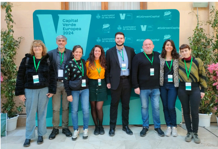
L'equip representant de Sant Boi a la Jornada de premis EGLA 2026 a València, novembre de 2024

La cerimònia de lliurament de premis va ser a València el 26 i 27 de novembre, on Sant Boi va presentar la candidatura.