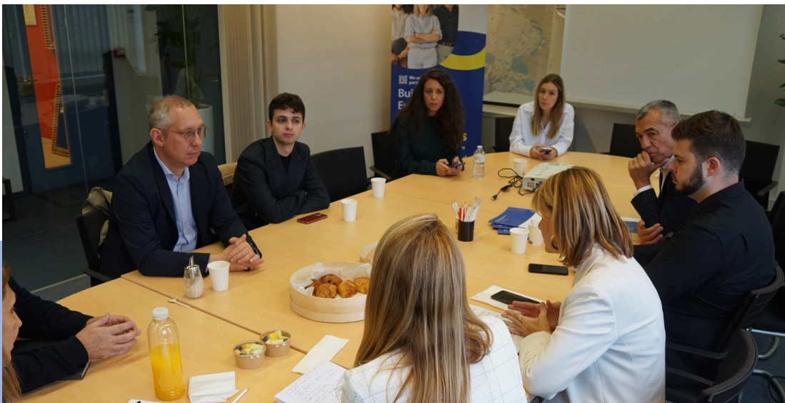
La regidoria de Projectes Europeus i l'equip tècnic de l'Oficina a Brussel·les, en una reunió amb l'Alcaldessa de Sant Boi i el Director de la xarxa d'EUROCITIES

L'Oficina tècnica de projectes europeus, creada dins del Departament d'Assistència a la Planificació i l'Avaluació, compta a una tècnica de projectes europeus i relacions internacionals , qui ha realitzat formacions (cursos i postgrau) i capacitació tècnica en l'àmbit de la gestió de fons europeus, així com de posicionament internacional dels ens locals. A l'últim trimestre del 2024, es va incorporar una tècnica auxiliar de projectes europeus , graduada en relacions internacionals, i una estudiant en pràctiques de relacions internacionals per a respondre a totes les necessitats sorgides com a conseqüències de l'augment de participació en xarxes, projectes, espais i iniciatives internacionals.