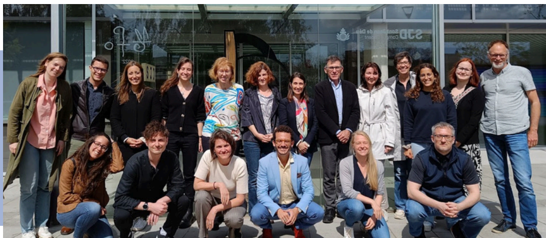
L'equip internacional d'IMPROVA al Parc Sanitari SJD, 2024