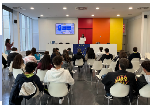
Simulació del Parlament amb joves, maig i desembre 2024