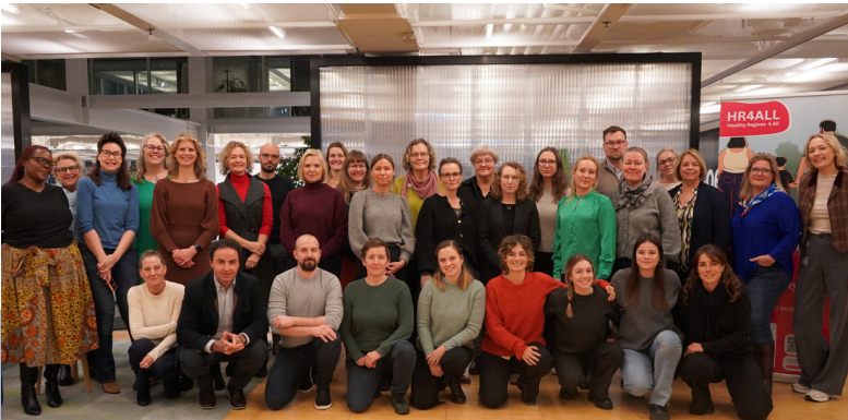
L'equip internacional del projecte, jornada a Rotterdam el gener de 2025

Està estructurat en 6 semestres amb activitats centrades en reptes polítics, intercanvi d'experiències i formació per millorar les polítiques de salut.