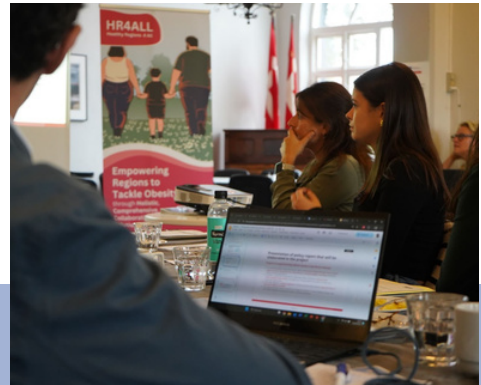
Jornada de treball a Dinamarca, novembre de 2024